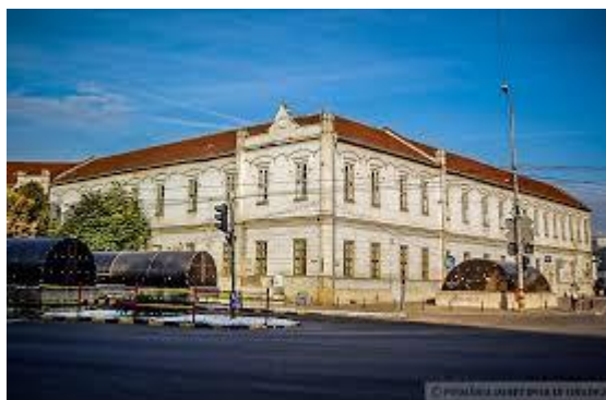
3. ábra Megyei kórház, Nagyvárad