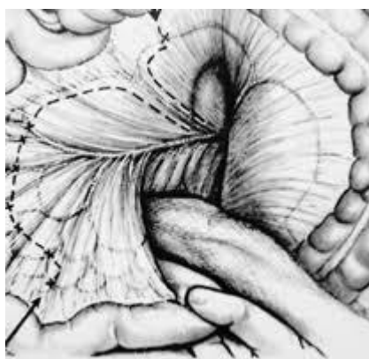
5. ábra Műtéti tervrajz

A tőle tanultak alapján 6 munkatársa kandidátusi, 1 az orvostudományok doktori, 2 egyetemi tanári címet szerzett.