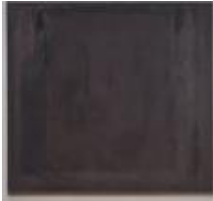
2. ábra Marc Rothko festménye

1994. nyarán már a betegség tudatával utaztam el egy hónapra Izraelbe. A Siratófalnál üzentem Jahvének, hogy gyógyítson meg. Egy év pesszimizmus, bizonytalanság következett. Természettudósként, végzett biológusként pontosan tudtam mi vár rám. Tudatosan végig nézhetem saját szervezetem leépülését, rosszabbodását. Éppen ezért talán feleslegesnek tartottam, a mai napig feleslegesnek tartom az internetes olvasás riadalmait. Egyébként is tele van hülyeséggel, siránkozással, felesleges információkkal. Félretájékoztatja az embert. Mivel tudhattam, mi vár rám, ezért felesleges volt az interneteztetés erről.