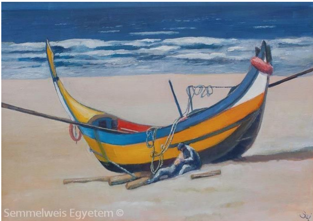
3. ábra Szirmai Imre festménye

Két év bizonytalanság, látásromlás és az orvosok hezitálása után 1994. márciusában találtam meg dr. Szirmai Imrét. Komoly volt, határozott és tudta mit dönt, mit mond. Azt is tudta, hogy mindezzel mit kockáztat és mit terel más útra az életében. Minden betegnek kívánom és biztatom arra, hogy keresse meg azt az orvost, aki meri vállalni tudását. Nem volt könnyű szembenézni azzal, amit mondott és ahogyan mondta. Az ijesztő határozottság mögött hatalmas tudás húzódott. Kezdő kutatót a tudományos pályáján megterhelni saját betegségével komoly felelősség. Szirmai professzor vállalta és arra biztató, hogy amíg tudom, csináljam. 1994 augusztusában ezzel a betegséggel engedett Izraelbe. Ő tudta mit kockáztat, én nem. Pireusból Haifába hajóval mentünk három napig. Soha nem felejttem el a Földközi tengeren azt a pillanatot, amikor fülemben szólt a görög zene, néztem a tenger hullámzását és eldöntöttem, ennek az embernek hiszek, ebben az emberben bízom. Mindent úgy fogok csinálni, ahogy ő mondja, mindent aszerint teszek, ahogyan ő javasolja nekem. Másfél évtizedig sikeresen építettem tudására. Mindent aszerint tettem, ahogy javasolta. Nagyon sokat beszélgettünk, érdekelt az, amit kutattam. Javaslatára komolyan elkezdtem sportolni. Mindez persze koránt sem volt olyan egyszerű, mint amilyennek most írásban rögzítem.