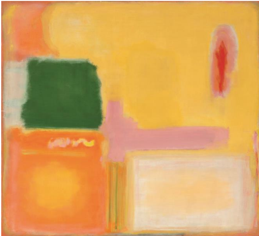
7. ábra Marc Rothko festménye

A betegség elleni pozitív dac uralkodott bennem. Egyre aktívabb és aktívabb életet éltem, amely szerződést jelentett az étellel és jelent a mai napig. Úgy gondolom, hogy ez mindenkinek nagyon fontos lehet! Szerződést kötünk az életre, s vele éljük, bármilyen is legyen az! Küzdünk, hogy jobb legyen! Ez az egyetlen igazi választás, amit tehetünk. Őszintén szólva nekem is volt egy pont, amikor a 90-es évek elején elgondolkoztam azon, hogy van-e értelme így csinálni. Nem vagyok szuicid alkat, de akkor egyszer elgondolkoztam ezen. És döntöttem, csinálom!