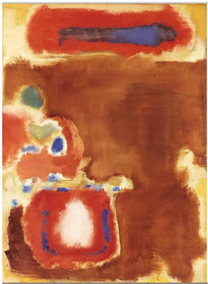
5. ábra Marc Rothko festménye

1995 és 98 között több európai városba is eljutottam pályázattal. Pécs, Lipcse, Hamburg, Berlin stb. városaiban megélhettem azt, hogy egyre jobban beszéltem németül és kutatásaim érdekelték nemzetközi partnereimet is.