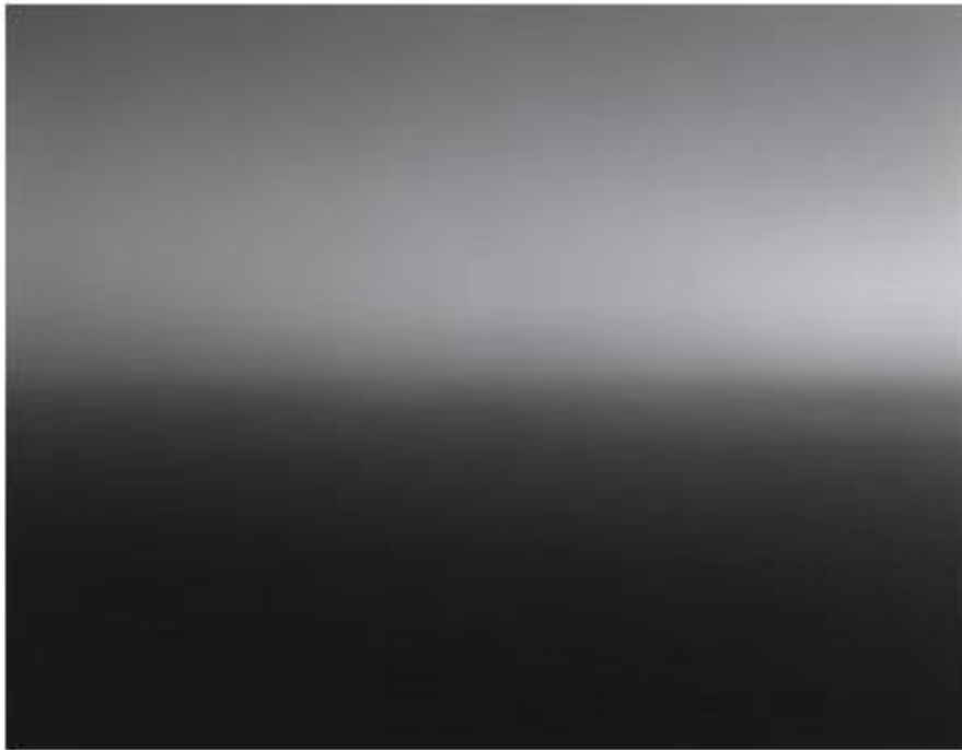
6. ábra Marc Rothko festménye