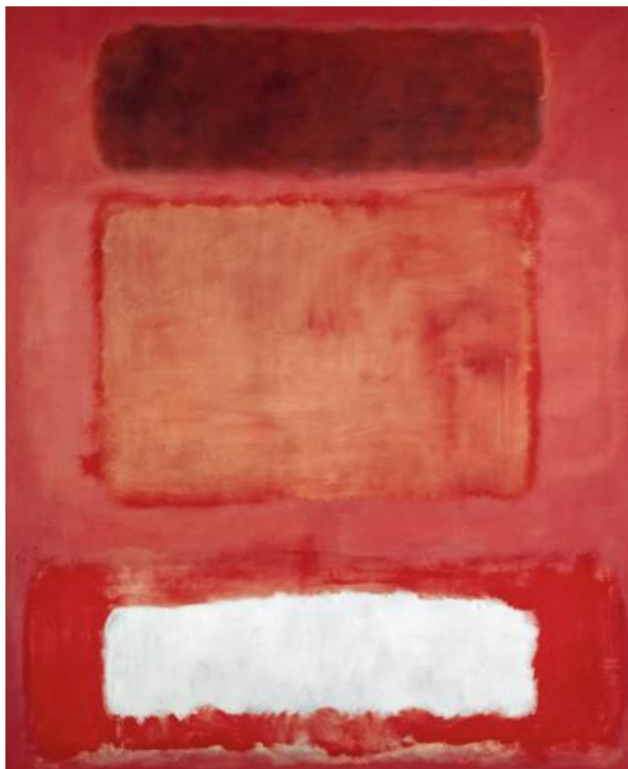
8. ábra Marc Rothko festménye

Ahogy azt Jan van Eyck festményére írta a 15. században: „Als Ich Can” (teszem a dolgom -- ahogy tudom!) Idén augusztusban Bécsben ismét megnéztem ezt a képet!