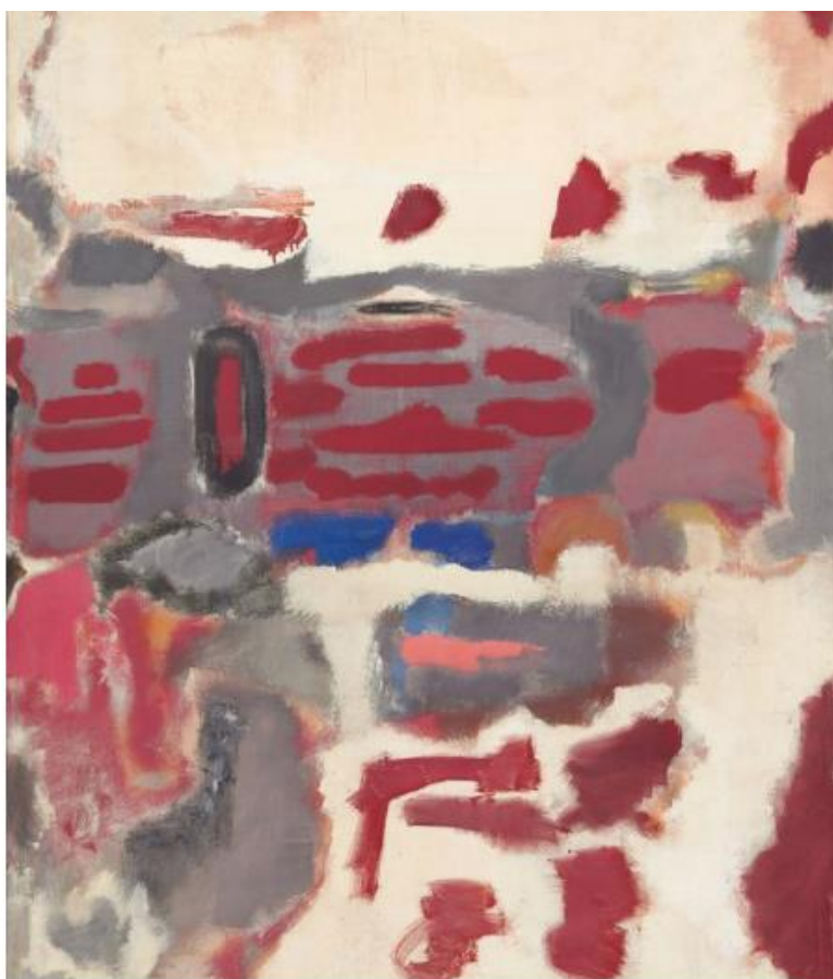
4. ábra Marc Rothko festménye

aszerint, ahogyan a társadalmi elvárások és lehetőségeink diktálták. Nem is tudom pontosan megfogalmazni azokat az érzéseket, amelyek vezettek akkoriban. Tulajdonképpen időm sem volt arra, hogy elmélyedjek a saját problémámban. Folyamatosan éltem a mindennapokat, ment az idő és én magamban próbáltam mindezt „megélni”. Tudomásul vettem, realitásként kezeltem, de nem adtam át magam a betegségnek. Kívülről egy teljesen egész, ép és magabiztos embernek látszódtam. Utáltam a körülöttem lévő vidám, boldog és féltő embereket, de mindebből semmi nem látszott. Belsőim, lelkem egy szétesett, darabjaira hullott, mondhatnám rohadó gyümölcs volt. Akkor nem fogtam fel ennek a kettősségét és ellentmondását. Egészen más látszott kívülről, mint amilyennek én éreztem magam. Hihetetlen ellentét volt a kettő között. Lelkem megnevezhetetlen valami volt, magam sem értettem az egészet. Bárki látott, azt gondolhatta, hogy nekem mennyire könnyű és mennyire jó.