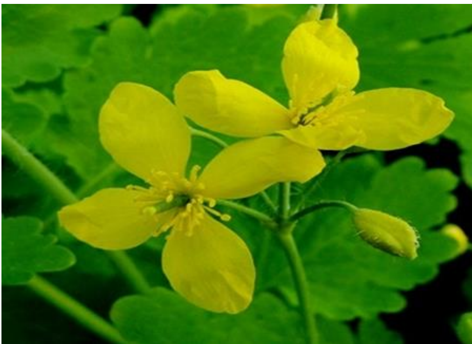
5. ábra Vérehulló fecskefű.

A vérehulló fecskefűvel kapcsolatban mindig szem előtt kell tartanunk, hogy ez a növény nagyon mérgező és fogyasztása akár életveszélyes is lehet. Több alkaloidot, gyantát, fehérjebontó enzimeket, illóolajat és nikotinsavat tartalmaz. [43] Hildegard már akkor ismerte a növény jótékony hatását a szemölcsök kezelésére, amely máig örökérvényű.