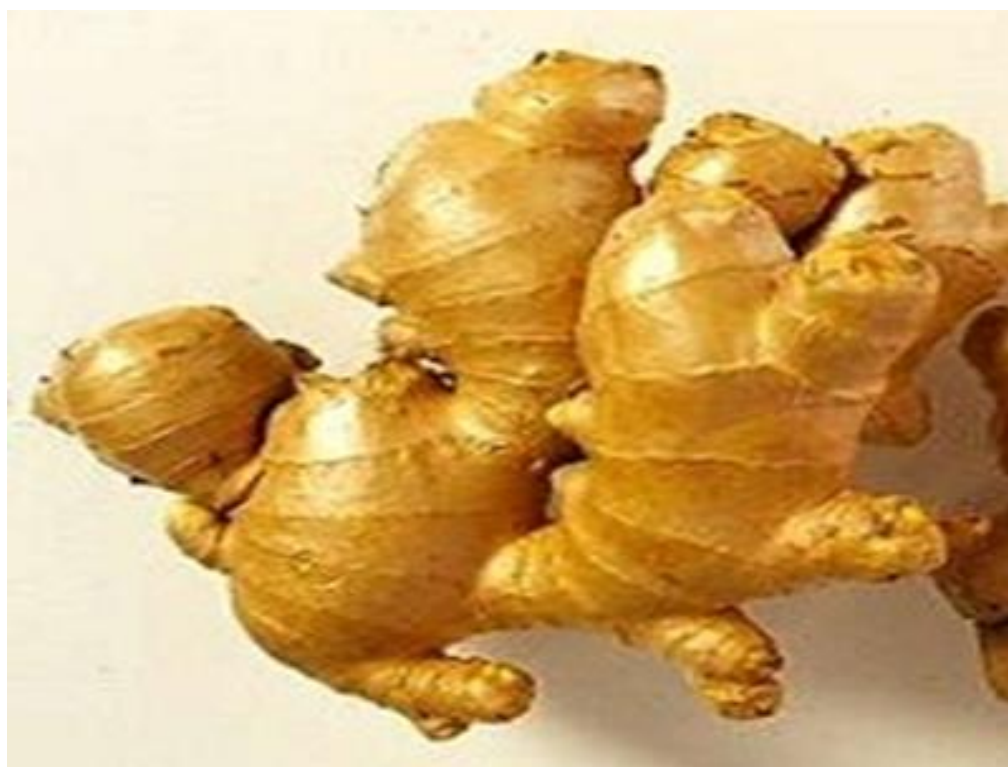
6. ábra Gyömbér.

frontátvonuláskor, valamint utazások alkalmával fellépő panaszok (pl. koncentrációkéesség zavara, általános rossz közérzet, szédülés, fejfájás, ízületi fájdalmak) megelőzésére és enyhítésére alkalmazható.