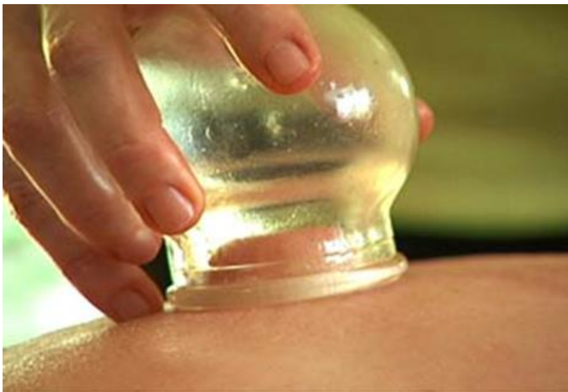
4. ábra köpölyözés

A köpölyözés a váladékot és a szövetekben lerakódott salakot távolítja el, és különböző szerveket serkent. Köpölyözésnél kis üvegharangot helyeznek el a test felszínre, amelyekből előzőleg kivonták a levegőt kis lánggal. A bőr azonnal benyomul az üvegbe, és kékes-vörös elszíneződése mutatja, hogy a vér odagyült. Ennél az eljárásnál csak nagyon kevés vér folyik az üvegbe, mert csak parányi metszést végeznek.