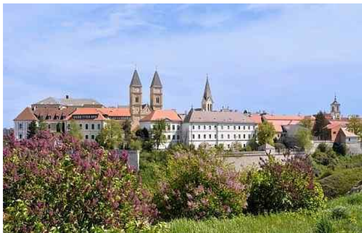
1. ábra Veszprémi vár

Öt-hatezer évvel ezelőtt az utolsó jégkorszakot követő melegedéssel népesült be lassan a mai város területe. Ebből az időszakból különböző használati tárgyak, így kőeszközök és vonalakkal díszített edények kerültek elő. A bronzkorban már földműveléssel foglalkozott a lakosság. A bekarcolt és mésszel kitöltött díszítésű edények legkorábbi lelőhelye Veszprém volt. Később az ókori Pannónia római tartomány felső részéhez tartozott a város. Ekkor már általánossá vált a mezőgazdasági gazdálkodás. Így alakult ki Veszprémtől 7 km-re, Nemesvámos mellett a Baláca-pusztai villa-gazdaság. Római kori neve Caesariana volt. Ebben az időben már éltek Pannóniában zsidók. Ebből a korból a város környékéről már héber feliratú sírkő került elő. ( 3 ).