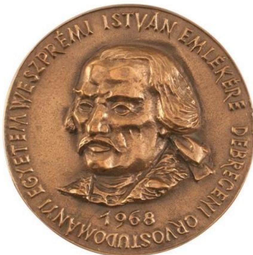
9. ábra Weszprémi István

Weszprémi István (Veszprém, 1723. VIII. 13. - Debrecen, 1799. III. 13.)