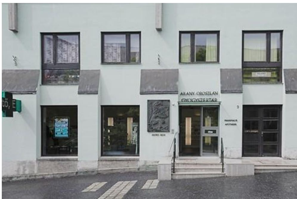
6. ábra Arany Oroszlán patika