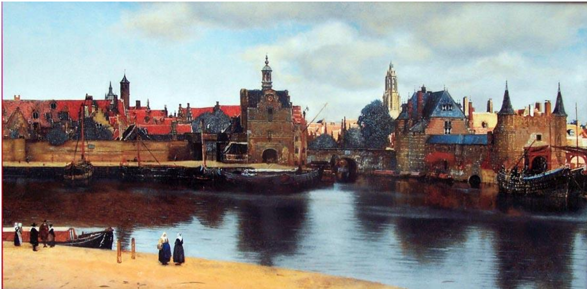
5. ábra J. Vermeer: Delft látképe (1659-1660)