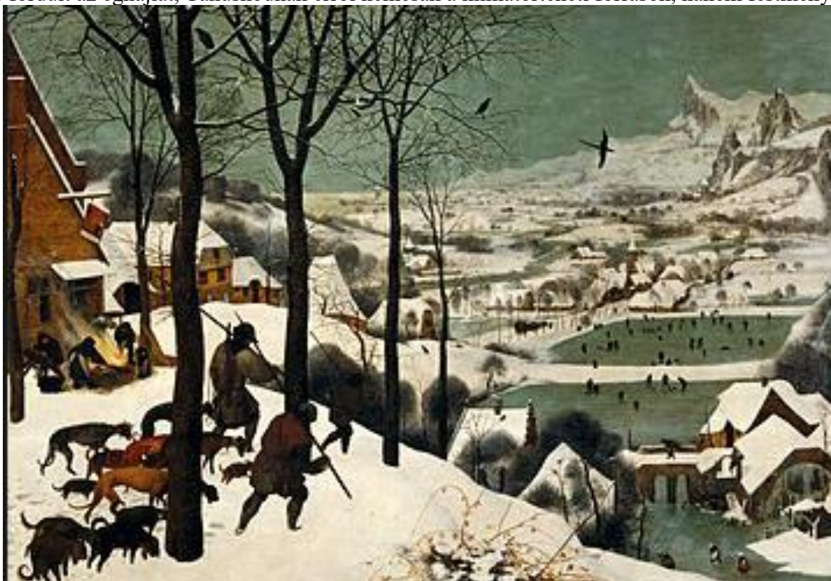
4. ábra id.. P. Bruegel: Vadászok a hóban (1565)

Időbeli közelsége miatt tudományosan feltárt, jól megismert időszokról beszélünk. Kevéssé elemzett ennek társadalmi, gazdasági és térbeni hatása, Ezek bemutatását szolgálhatják azok a képzőművészeti indikátorok, amelyek festményeken mutatják meg a jelzett változásokat. 1550 és 1740 között különösen hidegre fordult az éghajlat, Tanúskodnak erről nemcsak a klímátörténeti források, hanem festmények is.