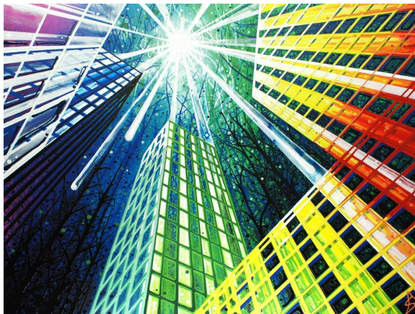
7. ábra Amy Shackleton: New York (2018)

A fenti folyamat elemzését együtt, különféle tudományágak eredményeinek összesítésével végezhetjük.