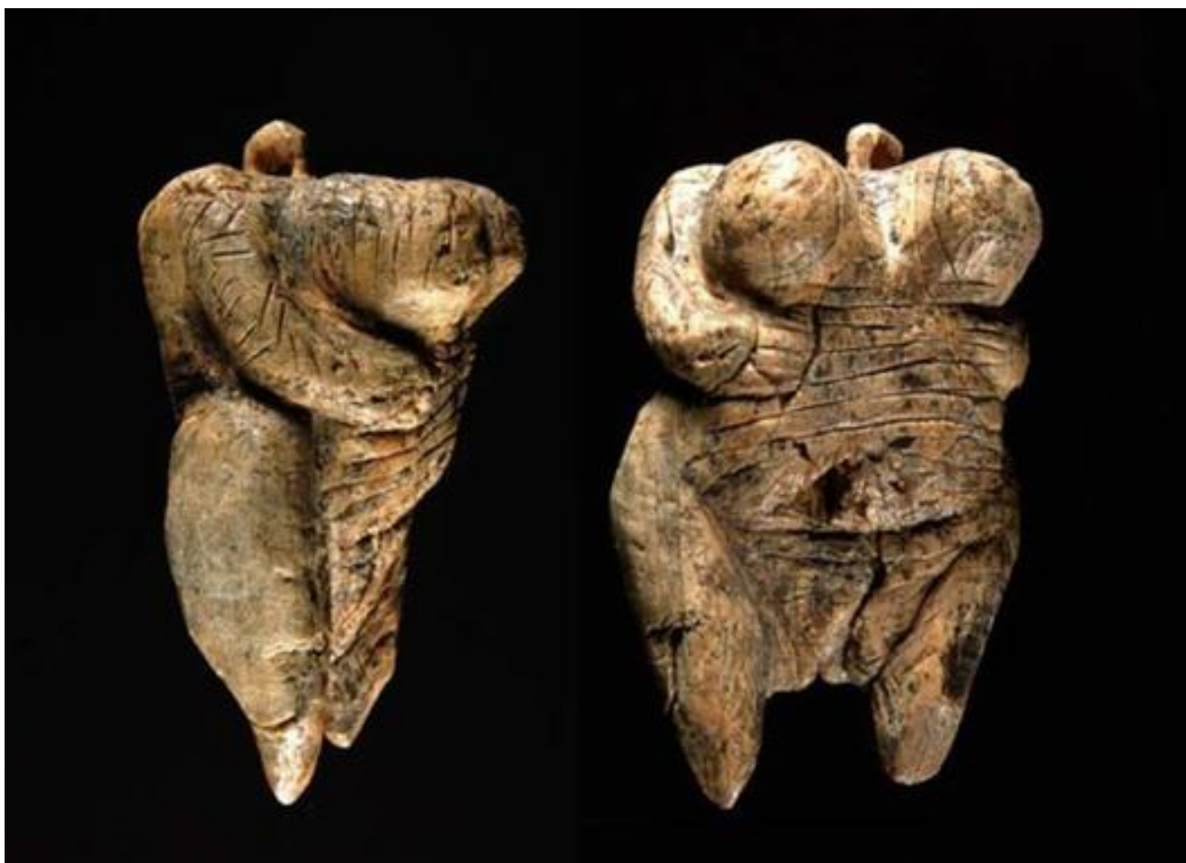
1. ábra Hohler Fels-i vénusz

Mit fejezhet ki számunkra a szobor? Milyen üzenetek vannak elrejtve az értelmező utókornak? A tübingeni Egyetemen próbálták megfejteni ezt a korai üzenetet. A női testet ábrázoló alkotás kiemeli a szexuális jellegeket. Az ekkor élt embereknek is nagyon fontos volt az az evolúciós törvény, miszerint a fajfenntartás alapvető kulcsa utódok létrehozása. A barlangokban élt elődeink nemcsak a fenn maradás nehézségeivel küzdöttek, hanem az éghajlati viszonyokkal is. Az utolsó nagyobb eljegesedés megnehezítette az életviszonyokat.