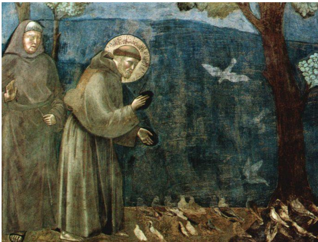
3. ábra Giotto de Bondone. Szent Ferenc prédikál a madaraknak

A várostervező firenzei festő Giotto di Bondone készített elsőként -jelen ismereteink szerint- olyan festményt, ahol kék eget látunk. Korábban díszes, fénylő a valósághoz nem hű alkotások születtek. Természeti jelenségek isteni erővel felruházott szimbólumként jelentek meg az emberi alkotásokon. Az utókor számára ezzel is üzenték emberi mivoltuk határait.