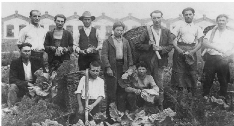
1. kép: Gyermekmunkások egy bolgárkertben

és a 20. sz. elején a legnagyobb számú korcsoport Budapesten 1 a 0 és 19 év közöttieké volt, amelynek aránya több, mint 50% volt (1. kép). Ezen belül is legnagyobb számban a 15-19 évesek szerepelnek a statisztikában: 1900-ban 43,3%, 1910-ben pedig 42,9%. A házas korban lévők (20-39, illetve 40-59 évesek) aránya 1900-ban 37,9% és 7,4%, majd 1910-ben 41% és 6,2% (ПЕЙКОВСКА 2011b). Ezek az adatok azt mutatják, hogy a bolgárkertészek közössége ebben az időszakban nagyon fiatal volt és kevésbé telepedett meg Magyarországon, ezért nagyon alacsony a 6 év alatti gyermekek és 60 év feletti idős emberek aránya (0,8%, illetve 1% körül).