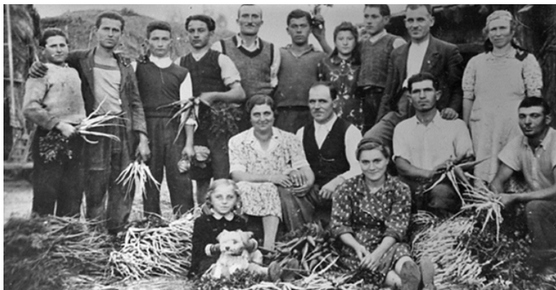
2. kép: Bolgárkertész család és munkásai Magyarországon az 1930-as években

A családok épségét az 1914-ben alapított Magyarországi Bolgárok Egyesülete mellett, az 1925-ben alakult egyházi vegyes tanács is őrizte, amelynek feladata volt ügyelni a bolgár honfitársak családi békéjére, különös tekintettel a válások és család elhagyásának megakadályozására. A tanács elnöki tisztet a követségi lelkész töltötte be, a tagokat pedig a bulgáriai Szent Szinódus hagyta jóvá (ТЮПОБ 2001). Ezek az intézkedések arra utalnak, hogy a hosszú távollétek próbára tették a családok egységét.