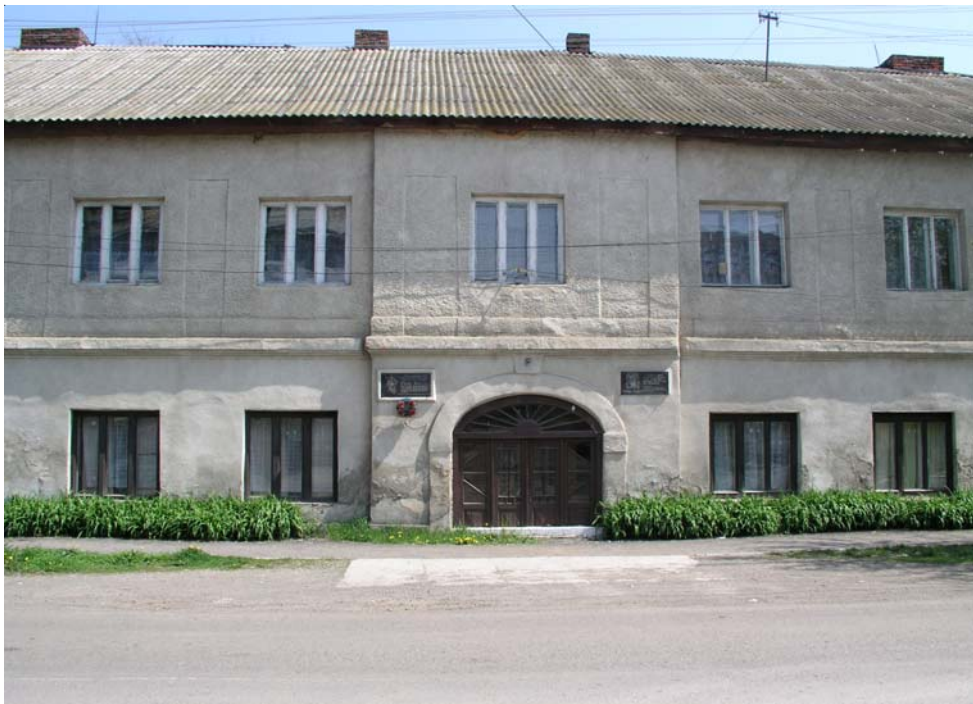
9. kép. A tiszaujlaki sóház épülete Esze Tamás és Móricz Zsigmond emléktábláival