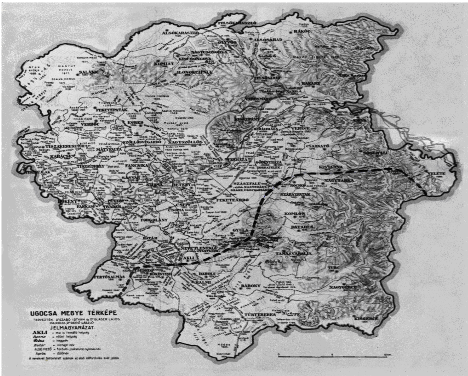
2. térkép. Ugocea vármegye a trianoni határvonallal