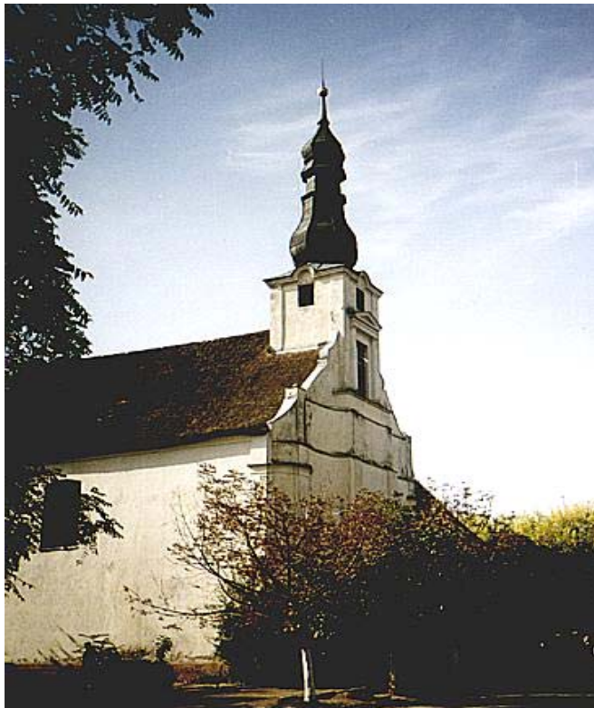
5. kép. A nagyszőlősi római katolikus templom