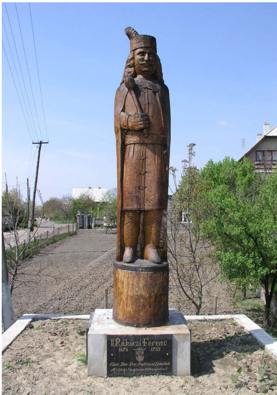
1. kép. A bökényi Rákóczi-szobor