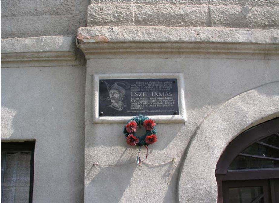
12. kép. Esze Tamás emléktáblája Tiszaújlakon