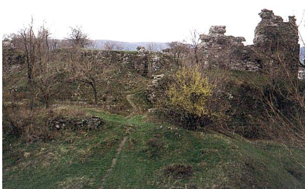
2. kép. A királyházi Nyaláb-vár