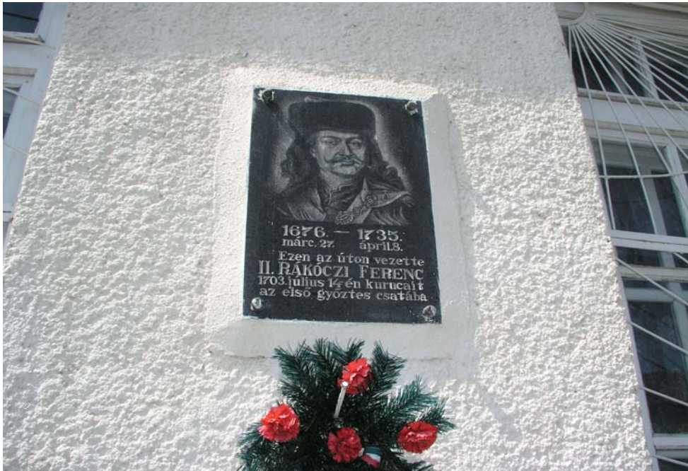
8. kép. A tiszaujlaki Rákóczi-emléktábla