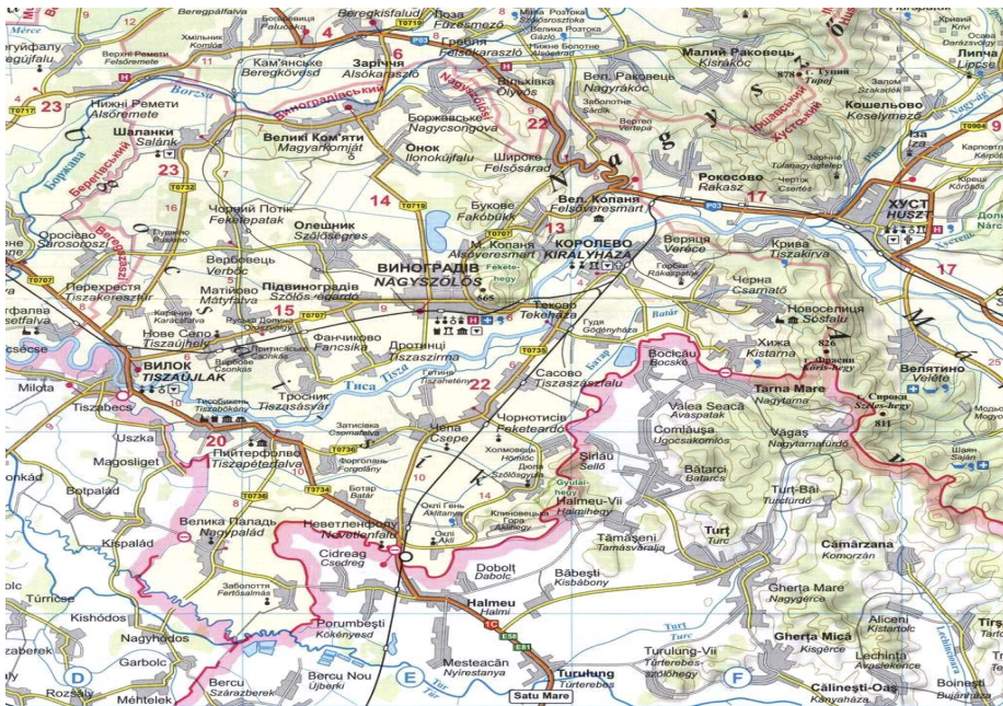
3. térkép. Ugocea vármegye a jelenlegi határok környezetben