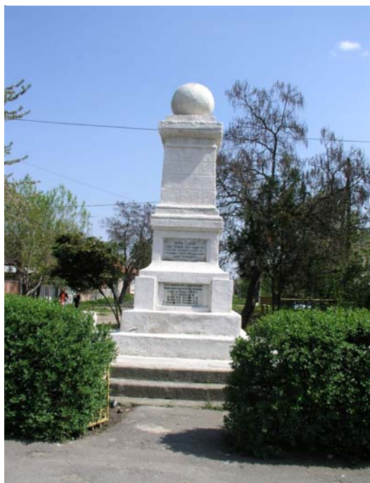
11. kép. Az eredeti turulemlékmű egy része, amit ma szovjet hősi emlékműként láthatunk Tiszaujlak központjában