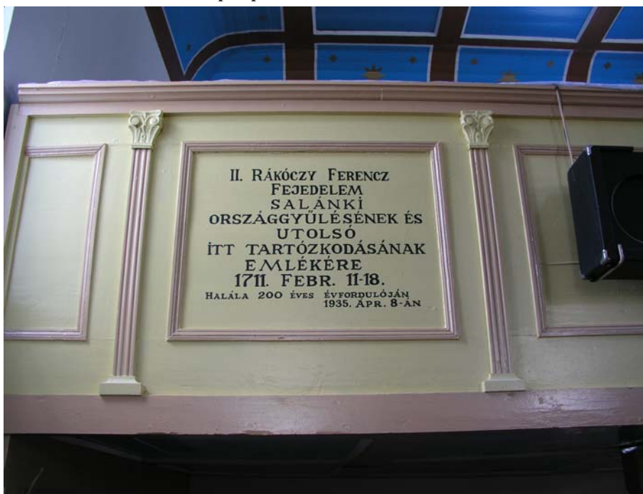
7. kép. A salánki országgyűlés emléktáblája a református templomban