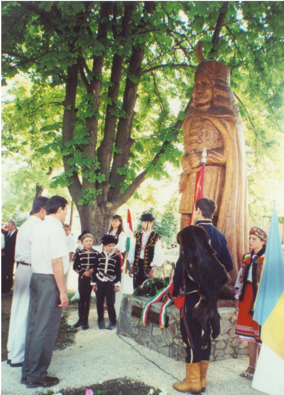
16. kép. A salánki Rákóczi-szobor felavatása