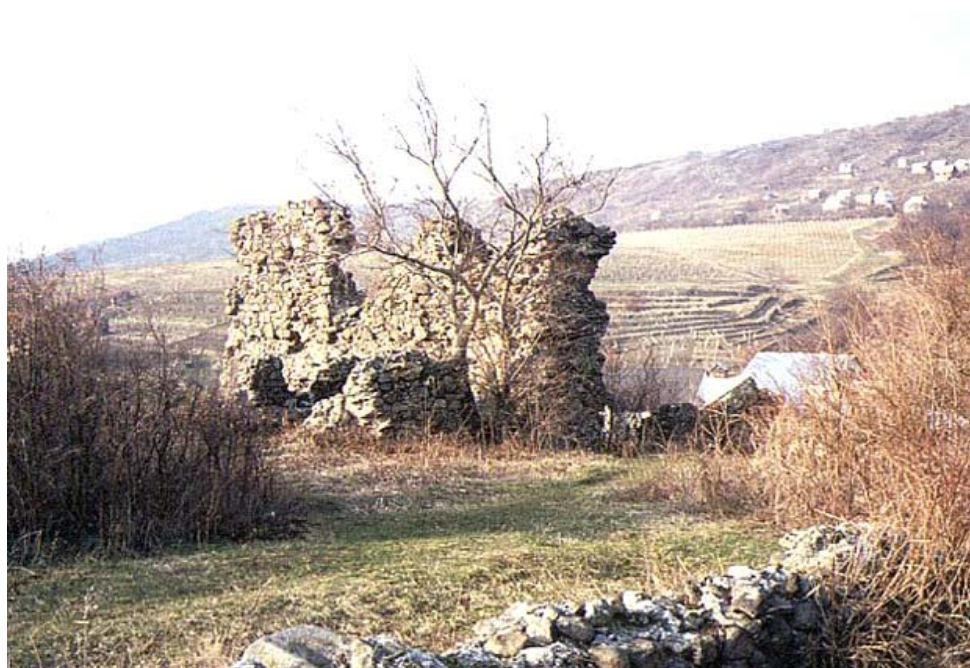
3. kép. A nagyszőlősi Kankó-vár