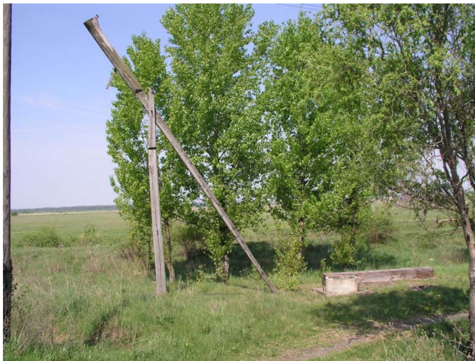
15. kép. Mikes-kút a Hömlöc-hegy alján