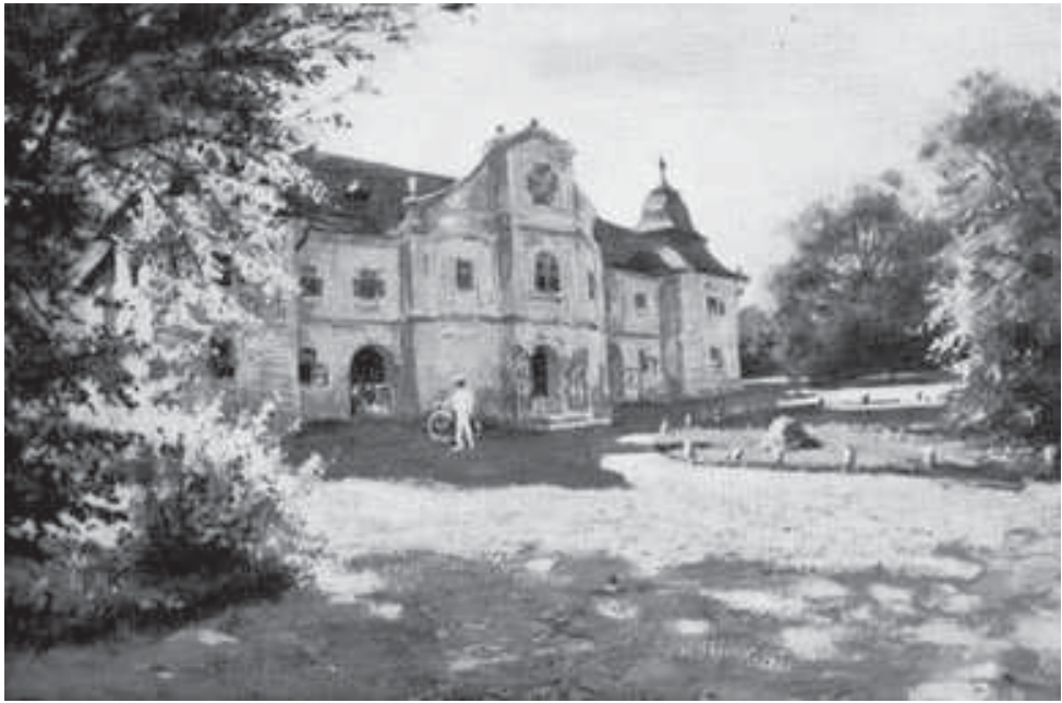
4. kép. A nagyszőlősi Perényi-kastély. Révész Imre akvarellje