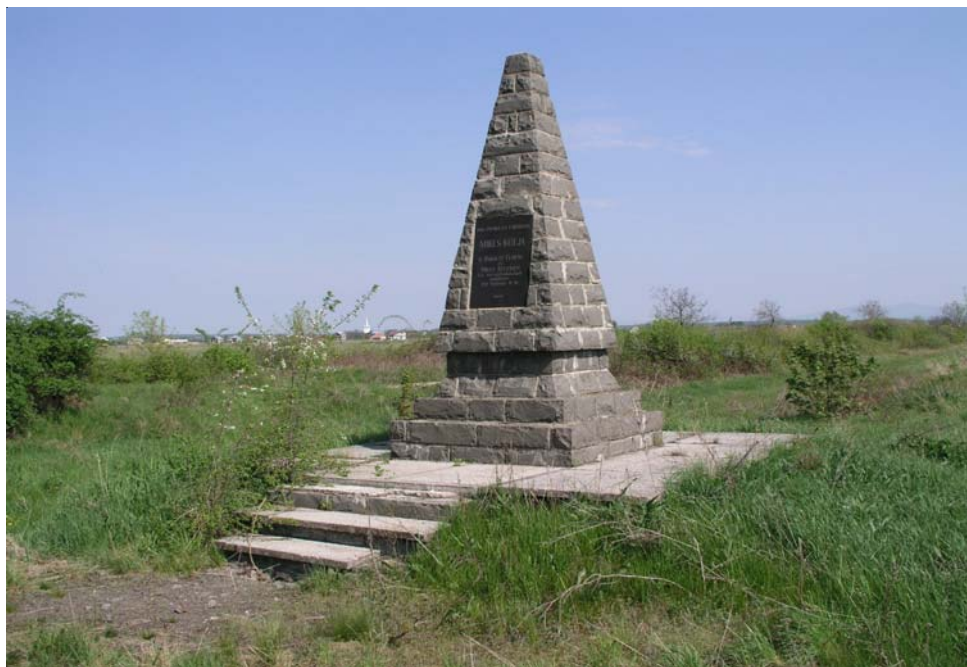
14. kép. Mikes-emlékhely a Hömlöc-hegy lábánál