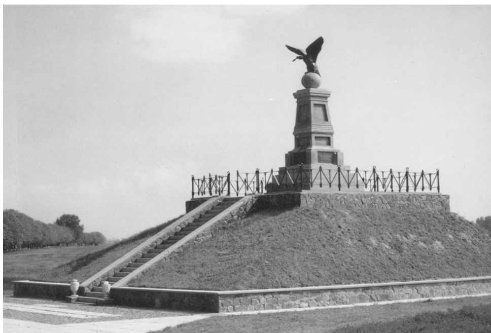
10. kép. A tiszaujlaki turulemlékmű, a Rákóczi-szabadságharc első győztes csatájának színhelyén