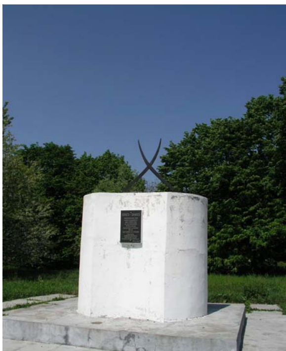
6. kép. A péterfalvai kuruc emlékmű