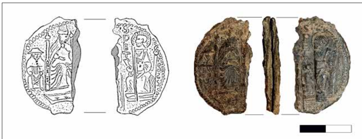
3. kép. Az ólobulla elő- és hátlapja