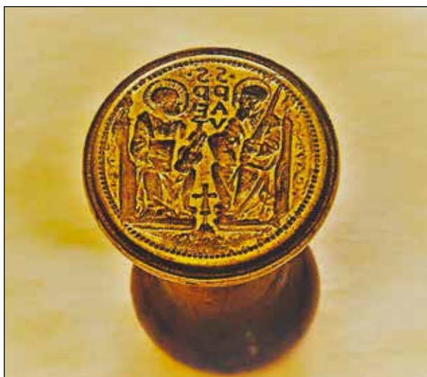
5. kép. A pápai ólombulla eredeti pecsétnyomója

Fig. 4. An intact exemplar of the bulla.