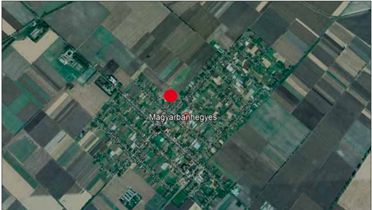
1. kép. A bulla lelőhelye Fig. 1. Findspot of the bulla