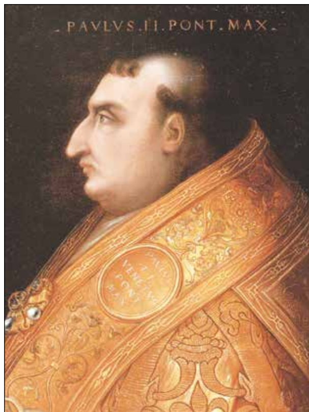
7. kép. II. Pál pápa portréja

II. Pál a bullakép megváltoztatása mellett új pápai tiarát is készíttetett; reprezentációja a pápai udvar pompáját emelte. 27 Egyik pápa sem vere-