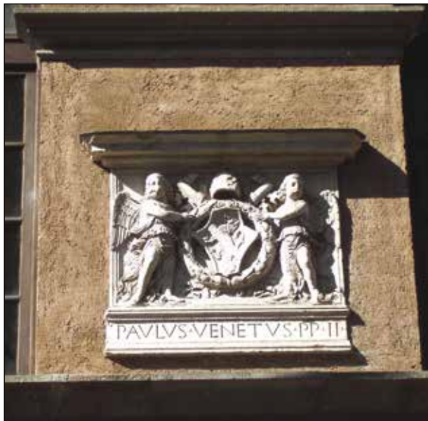
8. kép. II. Pál emléktáblája a Palazzo Venezia épületén