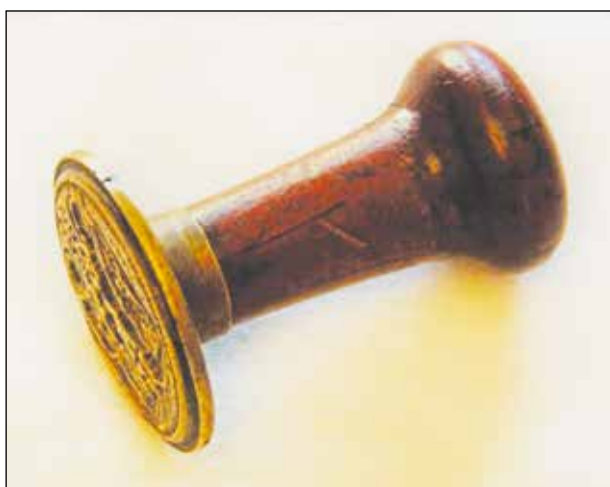
6. kép. A pápai ólombulla eredeti pecsétnyomója

Fig. 5. The original stamp of the papal bulla