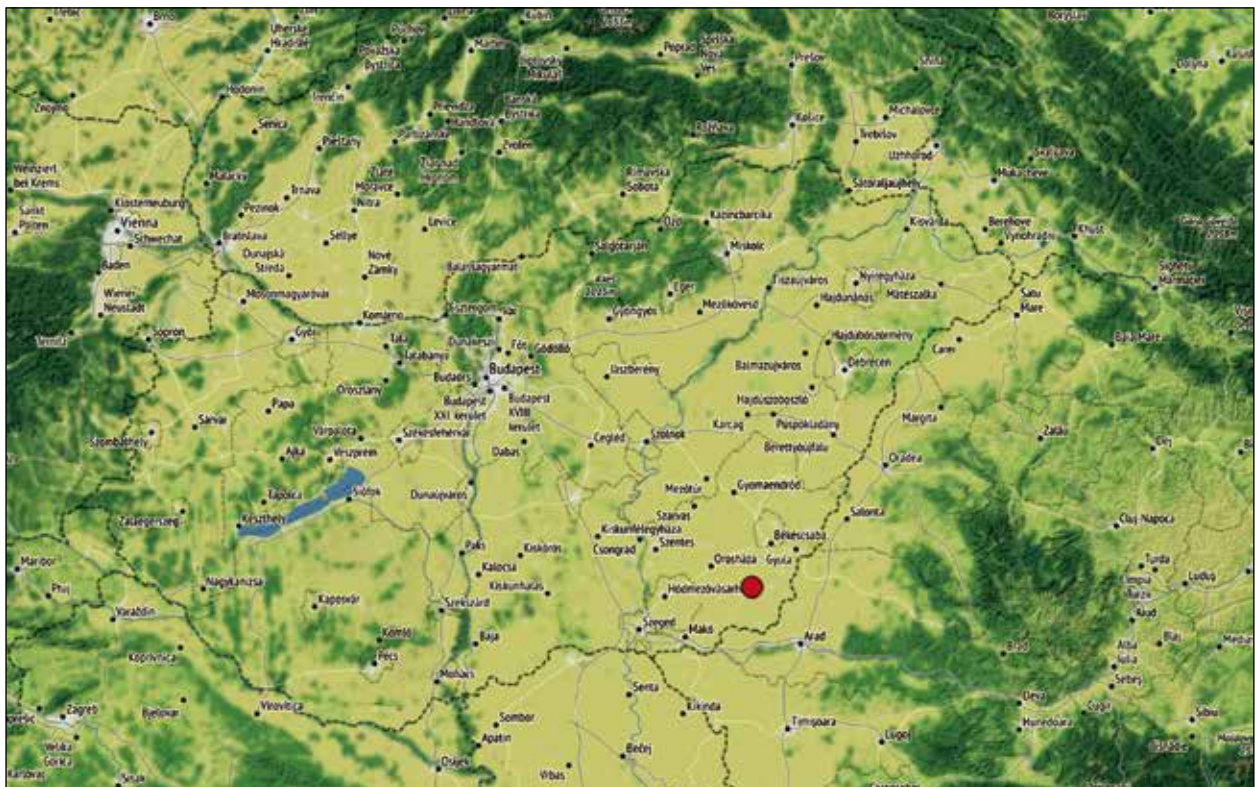
2. kép. A mai Magyarbánhegyes elhelyezkedése. A bulla lelőhelyéve (piros pont) a középkori templom feltételezett helyének közelében