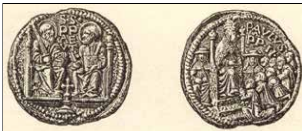
4. kép. A teljes darab.

Fig. 4. An intact exemplar of the bulla.