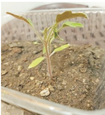
4. kép. Katinka története

Azt hitték, csak fiúk játszhatnak, de titokban én is játszottam. Mikor elmondtuk a barátommal, hogy én voltam Rokker néven, igencsak meglepődtek. Karantén alatt volt időm palántálni. Életem első paradicsompalántája.