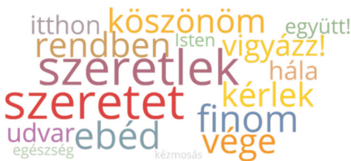
2. ábra. A karantén leggyakrabban használt szavainak ábrázolása