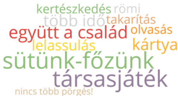
3. ábra. A karanténidőszak pozitívumainak szemléltetése