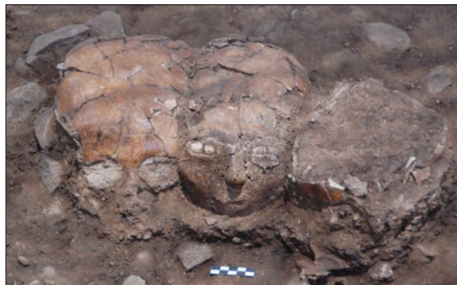
4. kép. „Koponyamaszkolás”, Yiftahel (Israel) (SLON et al. 2014, Fig. 2 nyomán)

A koponyakultusz a felső paleolitikumtól kezdődően nagy területen, hosszú évezredekig létezett. A mezolitikumtól megtalálható a Közel-Keleten (Pre-Pottery Neolithic B), Szíria (Tell Ramad), Izrael (Beisamoun, Kfar Hahores, Nahal Hemar, Yiftahel), Palesztina (Jerikó), Jordánia (Ain Ghazal, Tell Aswad, ) majd a neolitikumtól Anatólia (Koşk Höyük, Çatal Höyük) területén. A testről leválasztott fej eltemetése történhetett önállóan vagy egy másik halott mellé helyezve. Különleges hiedelem kifejezése a koponya maszkolása, azaz „agyagszobrászata” ( modelling skulls, plastered skulls, overmodelled skulls ) (4. kép). Gyakori jelenség, hogy a koponyát vagy bizonyos részeit agyaggal, bitumen-