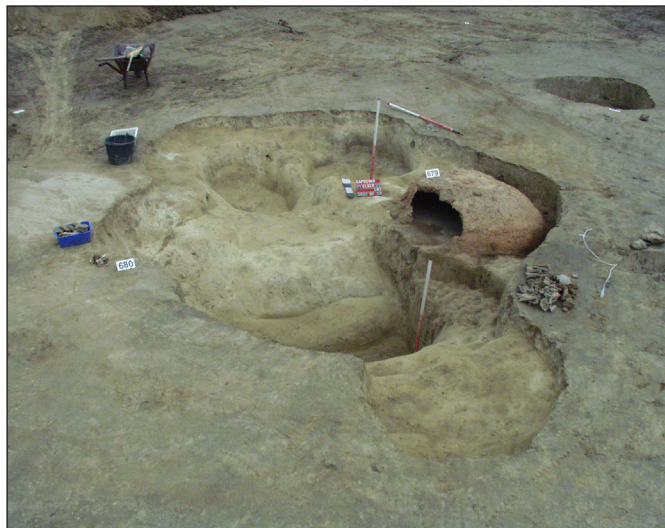
1. kép. Kaposvár 61/29. lh., a 679. sz. kemence feltárás közben

Témánk szempontjából a 679. objektumot emelnénk ki. A teljesen ép boltozatú kemence belsejéből, a platni felett emberi koponyatető került elő (1. kép).