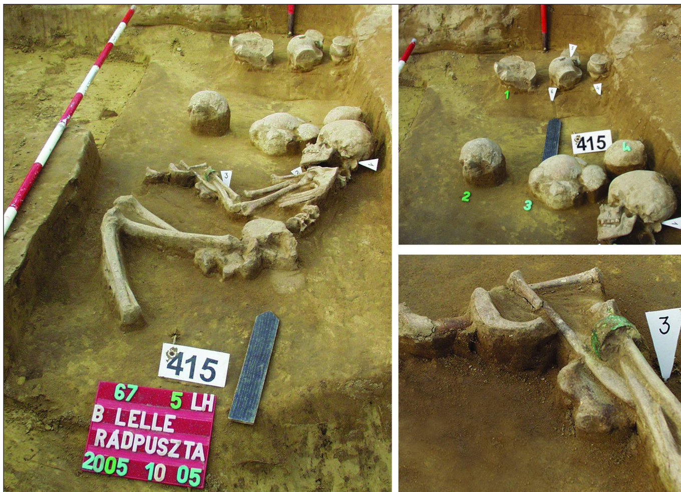
5. kép. Balatonlelle–Rádpusztá 67/5. lh., 415. sírba temetett 8–9 éves fiú, koponyákkal a sírban (zöld számokkal a koponyák, fehérrel a mellékletek jelölve) (BONDÁR & SZÉCSÉNYI-NAGY 2020, Fig. 3.)

van más magyarázat is. A Balatonlelle–Rádpusztá 415. sírban a rítusban felhasznált koponyamaradványok döntő része gyerekeké volt. A sírba két anyától származó gyermekek fejrészeit helyezték el (5. kép). A genetikai vizsgálatokkal kimutatott tény arra utal, hogy az eltemetett 8–9 éves halott gyermek mellé rokonainak koponyamaradványai kerültek, így nemcsak logikailag, hanem természettudományos bizonyítékok ismeretében is cáfolható az őskultusz teória ebben az esetben (BONDÁR 2020; BONDÁR & SZÉCSÉNYI-NAGY 2020).