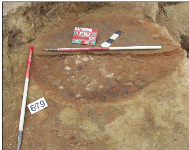
2. kép. Kaposvár 61/29. lh., a kemenceplatni feltáráskor

A kemence ovális alakú, boltozata épségben megmaradt. A föld körülötte át volt égve. Átmérője: 1,4 m, mélysége: 34 cm. Platnija ép, jól átégett, ívelt, közepe felé lejtett. Metszete szerint 2-3 cm vastagon vörösre égett. Alatta összefüggő cserépréteg helyezkedett el (2. kép), jórészt durvított felületű töredékekből, amelyek között néhány pont- és vonaldíszes töredék is látszott. A kemence szája K-ÉK felé nézett, errefelé kissé jobban felemelkedett, és kb. arasznyi sávban nem volt kirakva cseréppel. A kemence belsejében, a platni felett emberi koponyatető, viszonylag sok állatcsont, kevés patics (áglyenyomatos is), kevés őskori, jellegtelen durvított felületű oldaltöredék és díszített badeni kerámia volt. A boltozat elbontása után, a platni Ny-i részén is találtak állatcsontokat.