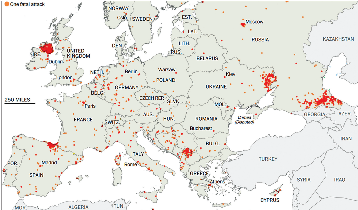
4. ábra. Az európai terrortámadások az elmúlt közel öt évtizedben