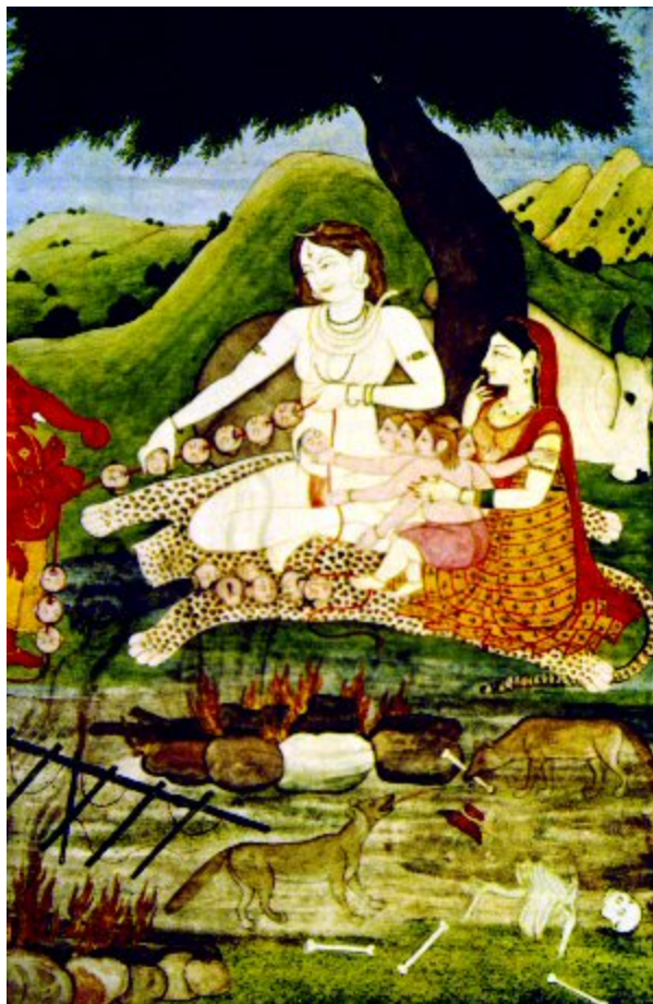
Siva és családja. Kangra festmény, 1790

Az indiai mitológiában Siva nevei közül az egyik a Kapalin, amelynek jelentése: „koponyákkal díszített”. A legenda szerint az univerzum elpusztulásakor Siva egyedül marad a hamuvá vált világban, és egy koponyafüzért visel, amely szimbolizálja a világ vég nélküli fejlődését és folyamatos pusztulását, jelenti az élet és a halál elválaszthatatlanságát 2 . Egyes kutatók értelmezésében (például J. Le Roy Davidson) az indiai erotikus szobrászat eredete legalább részben visszavezethető a Kapalika Tantrikus szekta működésére.