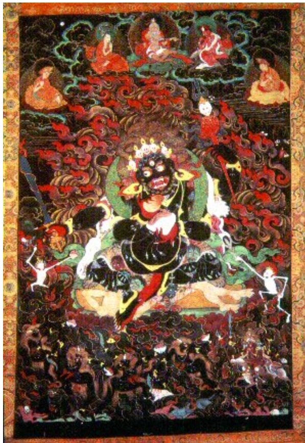
Mahakala. XIX. századi tibeti festmény

Egy XIX. századi tibeti festményen Mahakala, a tudomány védelmezője egy vérrel telt koponyatetőt tart. Az életkerek tartó istenség is koponyakorónával ékesített. Mahakala ijesztő külseje ellenére a tudomány védelmezője. Koronáját és háromvillás szigonyát koponyák díszítik.