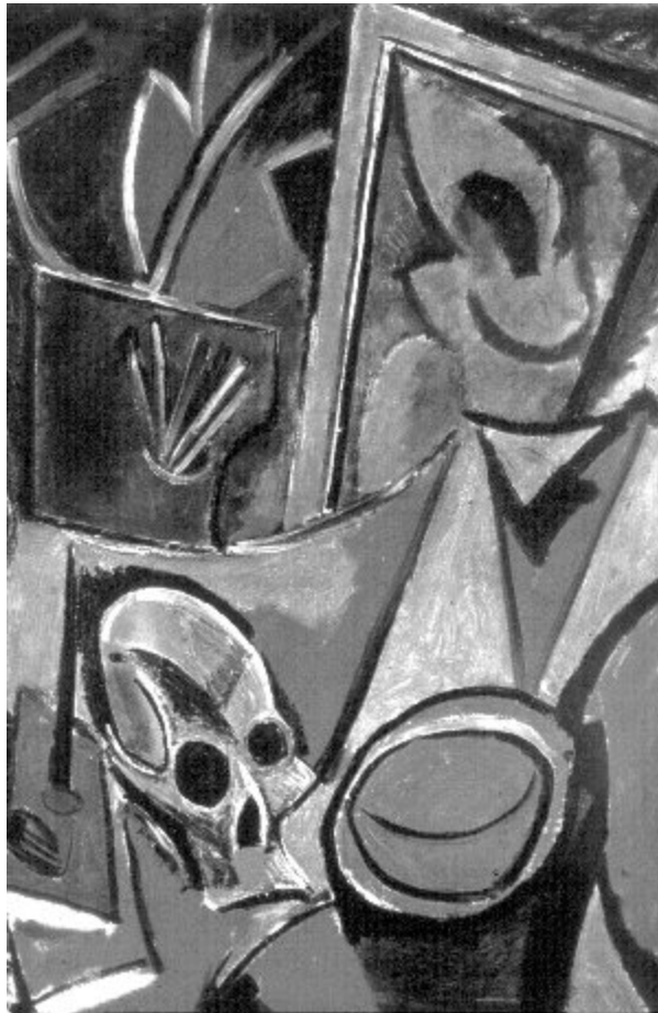
Pablo Picasso: Kompozíció koponyával. 1907

A XX. század számos művészt is foglalkoztatta az elmúlás és az idő gondolata. A századforduló szecessziós osztrák művésze Gustav Klimt (1862–1918) a terhes asszony és a koponya ábrázolásával az új életet megjelenítő remény és a halál együttes létezéséről akar meggyőzni. Pablo Picasso (1881–1973) a múlandóság és a hiúság allegóriáját tárja elénk a Kompozíció koponyával című képén. A halálfej körül együtt van jelen a paletta, a művészet; a könyvek, a tudomány; a pipa, az élet örömei és a tükör mint a hiúság jelképe. Egy-egy tárgy között ott van a halált jelképező koponya is, hiszen minden út oda vezet.