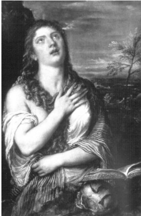
Vecellio Tiziano: Bűnbánó Mária Magdolna. 1560–1565

sanyarúsága, amely csak a meditációval biztosított magas szintű lelki élettel és a külvilág kizárásából fakadó nyugalommal kompenzálható; a vezeklés, az ima és az elmélkedés eredményezheti az isteni kegyelemben való részesülést. A földi hívságokról való lemondást is jelenti a koponya, főleg remeték és vezeklők életmódjához kapcsolódóan; a félelemmentes halálvárás és az őszinte, teljes bűnbánat lelki tisztaságot biztosít, amely után bátran várható a halál.