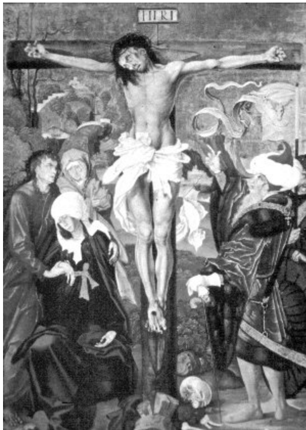
M. S. mester: Crucifixion. A selmecebányai Mária-templom oltárának panelja. 1506

Krisztus keresztre feszítése nagyon fontos témája a középkor művészetének. Ezzel kapcsolatban sokszor kerül valamilyen módon ábrázolásra a koponya. De ellentétben a korábban említett koponyaábrázolásokkal, ezeken a képeken a halálfej nem képezi a téma fontos részét. Egyáltalán nem látszik jelentősnek, hogy a kereszt tövében van-e egy koponya vagy sem, sőt, néha több koponyát is felfedezhetünk. Például Mester: Crucifixion című 1506-ban készült képén a kereszt tövében egyetlen koponya látható.