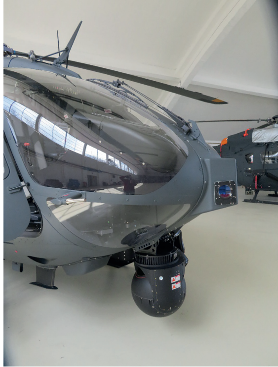
4. ábra Az EOS egy H145M helikopteren, hordhelyzetben [6]

Az alkalmazható fegyverek típusa – amely lehet csupán ballisztikus és/vagy irányítható fegyver – attól függ, hogy a megrendelő milyen fegyveropcióval és milyen szintű HForce-képességsomaggal rendelte meg a H145M helikoptert. A különböző fegyverkonténerek lehetővé teszik géppuskák, gépágyúk és különböző rakéták alkalmazását a helikopter repülési irányában a hossz tengely mentén. A fegyverzet rögzítésére a többcélú pilonok (MPP) 22 (lásd 5. ábra), valamint a függesztményrögzítő rendszer (SRU) szolgál. Az SRU többfajta, közepes tömegű fegyver függesztésére is alkalmas, köszönhetően a NATO-szabványú 14"-es (355,6 mm-es) függesztőszemeknek. Az SRU, köszönhetően az egyszerűen használható mechanikus kezelőszerveinek, lehetővé teszi a konténerek gyors függesztését, beállítását és repülés utáni lefüggesztését. A konténerek vészhelyzet esetén egyidejűleg is leoldhatók, köszönhetően a vészoldó berendezésnek, amely független a HForce-rendszertől. A konténerek véletlen tüzelés és oldás elleni földi biztosítására az SRU-n speciális biztosító tuskék (földi biztosítók) szolgálnak. A különböző konténerekhez saját oldható kábel tartozik, amely duplex kommunikációt biztosít a berendezés és a konténer között, ilyen lehet például az újratöltésre, a sorozathosszra, a tűzparancsra stb. vonatkozó jelek, a HForce-rendszer irányába pedig a konténer állapotáról például tűzkésztség, meghibásodás stb. Minden konténer rendelkezik saját