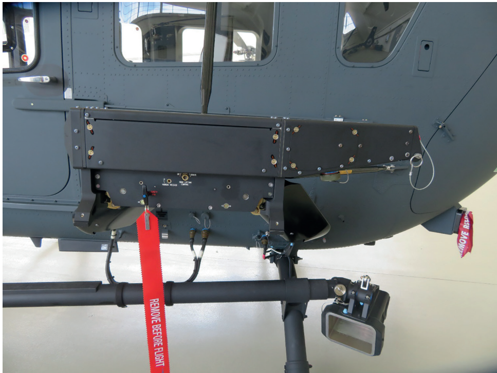
5. ábra A H145M helikopter függesztő rendszere (SRU) [6]

biztosító rendszerrel is, amely lehetővé teszi azok biztonságos földi kiszolgálását is (töltés/ürítés/fesztelenítés/akadályelhárítás stb.) [4]. A HForce-rendszer lehetővé teszi a szabvány tüzérfegyverek, 12,7 mm-es géppuska és/vagy 20 mm-es gépágyú, 70 mm-es irányítható-, és nem irányítható rakéták alkalmazását blokkokból, valamint irányítható páncéltörő rakéták (Rafael Spike ER) alkalmazását is. Köszönhetően a HForce-rendszer többcélú és moduláris felépítésének, nem szabvány nyugati/NATO-fegyvereket is alkalmazhatnak, mint ami meg is történt a szerb haderő számára leszállított H145M helikopterek 23 esetében. A HForce-rendszer szoftveres és hardveres továbbfejlesztésének köszönhetően fejlett hadművelleti rendszerek (Link16 adatátviteli és L3 Downlink videóátjátszó) is integrálhatók a helikopter fedélzetére, ezáltal kiemelkedő képességű légi vezetés-irányítási és felderítő (C4ISR 24 ) rendszerré is válhat [4], [8].