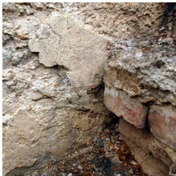
14. Kváderes falfestés maradványa a visegrádi királyi palota délnyugati épületének udvari 15. homlokzatán, egy Zsigmond-kori ajtó befalazásán

kori ajtó befalazásán, az udvarról az emeletre felvezető lépcső alatt, egy viszonylag védett helyen fennmaradt egy kisebb vakolatfolt maradt meg egy vízszintes kvádervonal töredékével. A vakolat elé jól láthatóan utólag épült a lépcső. Egy másik, nagyobb folt egy vízszintes kvádervonallal a lépcsőtől északra lévő, Mátyás-kori támpillér északi oldalán, a támpillérnek a lábazat feletti falazatára ráfordulva maradt meg. Ezekben a részeken a kváderfestés a meszelt felületre hegyes eszközzel bekarcolt vonallal, és rózsaszínes árnyalatú vörös festékkel készült.