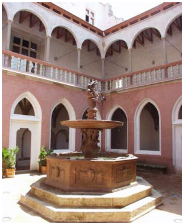
25. A visegrádi királyi palota díszudvara a rekonstruált Mátyás-kori színezéssel

ből faragott loggiaoszlopokon sem. Tehát itt a loggia meghatározó szerkezeti vonalait a rózsaszín festés és a kövek természetes rózsaszínje emelhette ki a folyosó fehér háttéréből, illetve a fehér kőből kifaragott baluszterbábok sorából. A loggia padlóját zöld, fehér és sárga mázas, rombusz alakú padlótéglákkal burkolták. 29