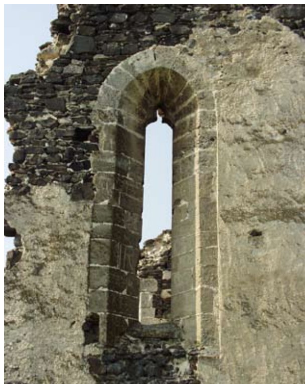
2. A taliándörögdi XIV. századi plébánia-templom sekrestyeablaka

A vakolt fal és a faragott-kő tagozatok eltérő színéből, textúrájából eredő esztétikai értékeket lehetőség szerint igyekeztek kihasználni. Szerencsésen fennmaradt Magyarországon is néhány középkori vakolt homlokzatrészlet, ahol ennek a módszerei jól tanulmányozhatóak.