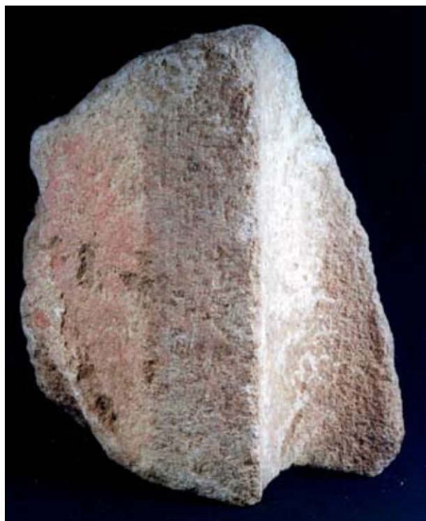
23. A visegrádi királyi palota díszudvarának egyik kerengőablak-töredéke vörös-fehér festésmaradványokkal

rózsaszínűek voltak, illetve a színhatáshoz itt is hozzájárult a tetők vörös cserépfedése. A színek mégis elsősorban a homlokzat fő díszét jelentő zárterkély címerdekorációját emelték ki. Az erélyt fedő vörös kúpcserepek között előkerült néhány sík mázas és mázatlan cserép is. Ezek talán a nagy erkély fiókerkélyt díszíthették. Ezen a fiókerkélyen kapott helyet Mátyás és Beatrix nagy címere illetve feltehetően a királyi pár szobra is, így ez jelentette a homlokzat legfontosabb részét. 26