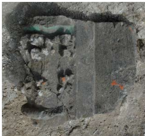
7. Háromnegyed oszlopfő zöld festéssel a visegrádi királyi palota Zsigmond-kori nyolcszögletű díszkútjának emeleti szintjéről

tő. 13 A csiszolt vörösmárvány természetes színével és az andezittufát utánzó festéssel kialakított kőszínű kutakon tehát az élénk mesterséges színek tehát arra szolgáltak, hogy a szobrászi díszítést kiemeljék.