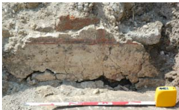
12. Kváderes falfestés maradványa a visegrádi királyi palota déli kerítésfalához csatlakozó épületen (2005)

színű, de durvább felületű vakolaton. E visszafogottabb díszítés azonban ebben a periódusban csak belső térben: egy kapualjban igazolható. Gazdagabb színezés csak a kutakon mutatható ki, ám ott is elsődlegesen a kőszínű kifestés volt a cél, gazdagabb színeket csak az ornamentális és figurális részletek kaptak.