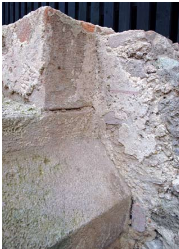
15. Kváderes falfestés maradványa a visegrádi királyi palota délnyugati épületének udvari homlokzatán, egy Mátyás-kori támpilléren és a csatlakozó falszakaszon

cm-es kváderosztás, illetve körülötte egy széles fehér ecsetnyom. 19