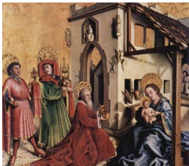
5. Konrád Witz: Királyok imádása, Genf, Musée d'Art et d'Histoire

mindazok az építészeti mintaképek, amelyek alapvetően befolyásolták a korszak közép-európai építetőit és építészeit alapvetően más jellegűek voltak. Európa nagy építészeti központjaiban (Franciaországban, a Rajna vidéken, Itáliában, de Észak-Európában, Angliában vagy a Pireneusi félszigeten is) a faragottkő (kváder-, vagy kőburkolatos), illetve a nyers és mázas téglá homlokzatok voltak meghatározóak. Mivel ezeket Közép-Európában másolni csak ritkán tudták, nem maradt más megoldás, mint az utánzás. Az utánzás legpraktikusabb eszköze pedig a festés volt.