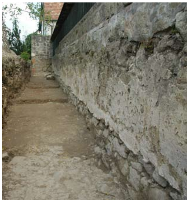
17. Kváderes vakolatdíszítés maradványa a visegrádi királyi palota nyugati homlokzatának déli szakaszán

jéből fennmaradt indaornamentikával díszített töredéket erőteljes zöld festés fedi. Szintén az egyik ablakvimperegéből származhat egy hollós Hunyadi címer töredék, ahol a holló fekete festése maradt fenn. A mérművek, a nyíláskeretek és a párkányokat díszítő ornamentika viszont a falfelületekhez hasonlóan kívül is fehérre meszeltek voltak. A színek tehát jól érzékelhetők az erkély legfontosabb, heraldikai elemeinek kellő kiemelését szolgálták az alapvetően fehér homlokzatból.