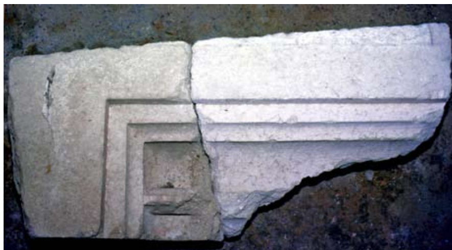
21. Ablakszárkő a visegrádi királyi palotából

kon is megfigyelhető a nyoma, 24 sőt a délkeleti palotaépület egyik lehullott sarokarmírozáskváderén is fennmaradt a rózsaszín meszelés.