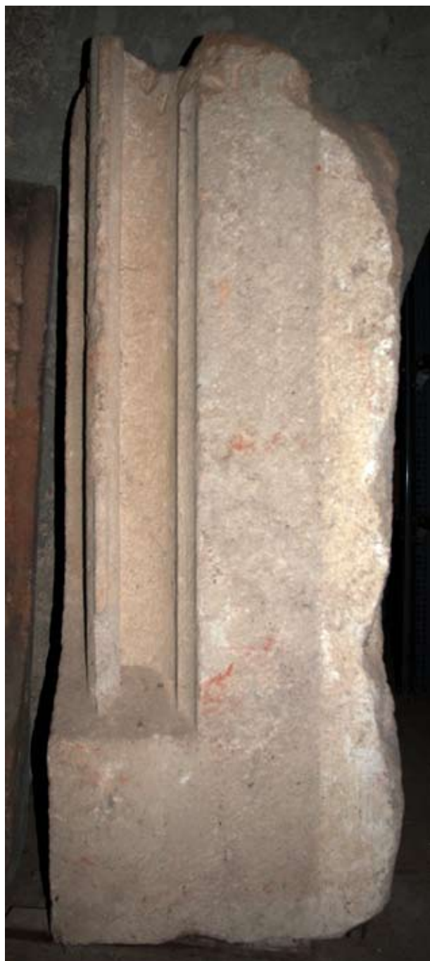
20. Ablakszárkő a visegrádi királyi palota nyugati homlokzatának déli szakaszáról

ta régi leletanyagából is ismert. 20 Az erkély északi oldalán egy másik profiltípusba tartozó ablak-szemöldökhöz is előkerült. E kövön is az előbb említettekhez hasonló festés figyelhető meg, de itt a profilt kísérő rózsaszín sávot a kőre ráfutó vakolat szélébe bemélyített, és feketével