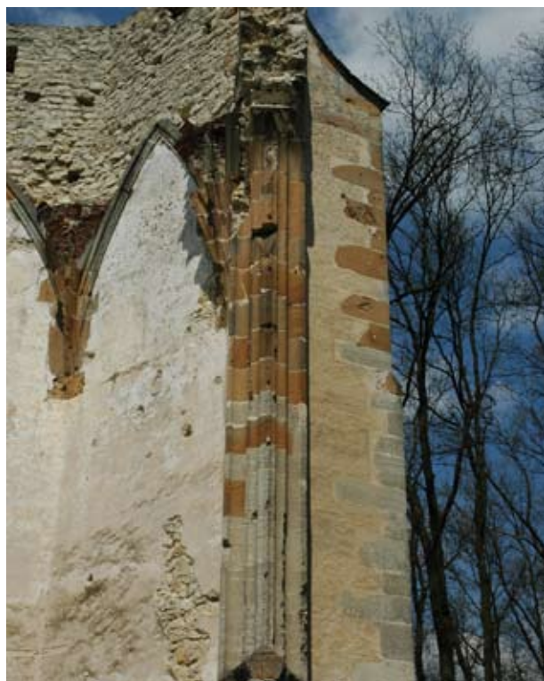
3. A nagyvázsonyi pálos kolostor szentélytámpillére

lyos belső széleit, az ablakkereteknél viszont a keretkövek szabálytalan falban ülő széleire ráfut és egy határozott, a keretprofil szélével párhuzamos vonalban záródik, mintegy keretelve a nyílást. Ahol a keretkő kisebb és nem ért ki a vakolatkeretig, ott a köveknél és a vakolatnál is világosabb, fehér fugázóanyaggal egészítették ki, akár csak a faragott kövek kisebb csorbulásait. Itt nem maradt semmi nyoma annak, hogy a faragottkő tagozatokat festéssel vagy meszeléssel látták volna el, de ez nem zárható ki. Nagyvázsonyban hasonló, de nem teljesen azonos módon kezelték a tagozatokat. Itt, ahol a sarokkváderek falban ülő felének végei szabálytalanok voltak, ott azokat a falétől eltérő színű vakolattal szabályos formára kiegészítették. Ugyanígy jártak el az ablakkereteknél is, azzal a különbséggel, hogy itt – akár csak Taljándörögdon – a keretprofil szélét követő párhuzamos vonallal zárták le a vakolatot. A faragott kövek kiegészítései a vakolatnál világosabb színű, maguknak a kvádereknek narancssárga illetve szürke színétől élesen elütő fugázóanyagot használtak. Ugyanezzel a világos fugázóanyaggal tömték el itt a kváderek kőemelő-olló fészkeit is. Mindez arra vall, hogy a