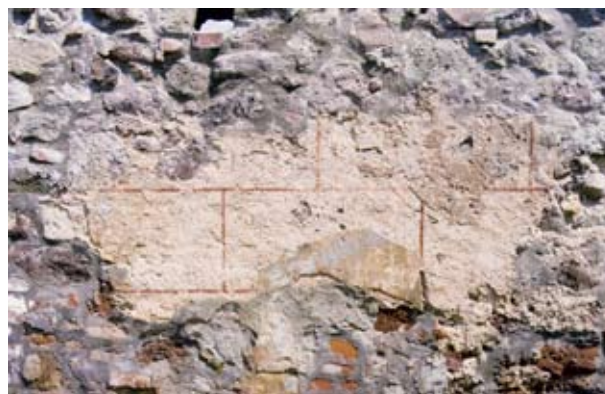
11. Kváderes falfestés maradványa a visegrádi királyi palota déli kerítésfalán (1999)

amin ez a kváderezett vakolat elhelyezkedett nagyszámú, másodlagosan felhasznált gótikus kőfaragványt tartalmaz, így keltezése egyelőre meglehetősen bizonytalan.