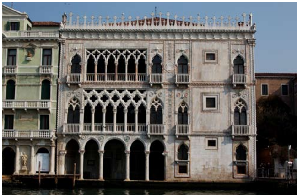
8. A velencei Ca' d'Oro palota homlokzata

lyezkednek el, szintén aranyozni kell elől. És azt kívánom, hogy alatta legyen finom ultramarin kék, kis arany csillagokkal. (...)