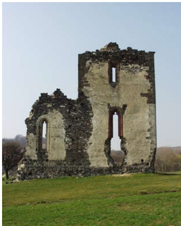
1. A taliándörögdi XIV. századi plébánia-templom szentélye

Közép-Európa, és benne Magyarország középkori építészetének karakterét több természeti és gazdasági természetű körülmény befolyásolta. E régió kevés jól megmunkálható és egyben fagyálló kőanyaggal rendelkezik. A térség viszonylag csekély mértékű középkori városiasodása miatt kevés és ezért drága volt a kőfaragó szakember is. Másrészt e területek éghajlata következtében a téli időszakban igen sokszor fagypont körül ingadozik a hőmérséklet, ami szüntelen – évente akár több száz – fagyási-olvasási periódusváltással jár. Ennek következményeként pedig az a falakba szivárgó víz folyamatosan megfagy és kiolvad, az ezzel járó térfogatváltozása pedig erőteljesen rombolja a fal építőanyagait. E problémák leküzdésére egyetlen megoldás kínálkozott: a vakolt törtkő, vagy téglafalazatok és a festett faragott-kő tagozatok alkalmazása. A vakolat, illetve a festégréteg egyrészt megvédte az épülethomlokzatokat a víz beszívódásától, így a fagyáskároktól, másrészt elfedte az építőanyagok, és a kivitelezés gyenge minőségéből adódó esztétikai problémákat.