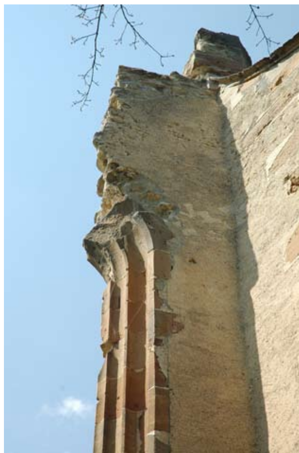
4. A nagyvázsonyi pálos kolostor szentélyablaka

A vakolt homlokzatok azonban a maguk egyszerűségével és színtelenségével nem elégtették ki az igényesebb megrendelőket. Hiszen