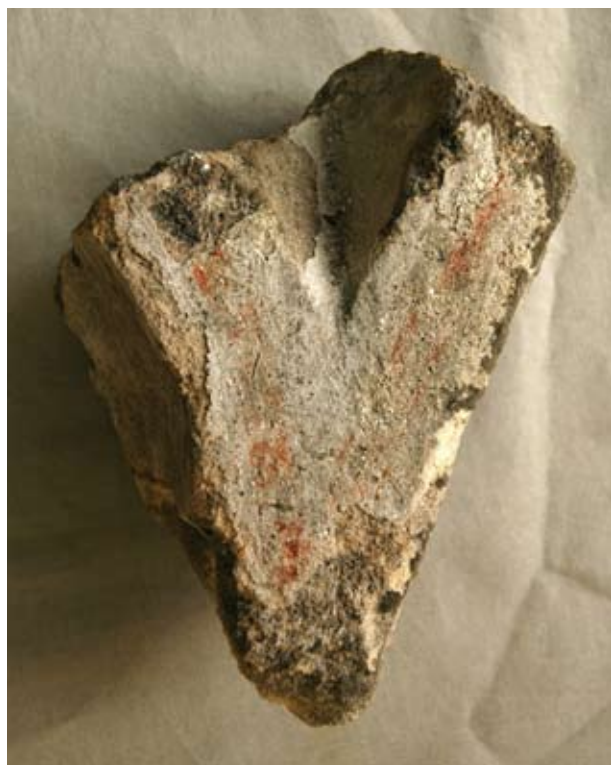
10. Ablakmérmű töredéke festett dísszel a visegrádi palotakápolnából

A 2005-ös ásatás során, ettől néhány méterre nyugatra egy olyan, XIV. századi leletanyaggal keltezett épületet találtunk, amely dél felől csatlakozott ehhez a kerítésfalhoz. Ennek a falnak a keleti külső homlokzatán, a fal fennmaradt alsó részén szintén előkerült a festett vakolat. Ehhez a falhoz később, a Mátyás- vagy a Jagelló-korban kelet felé egy újabb épületrész emeltek, így az említett festett vakolatot eltarták, ami ilyen módon meglehetősen ép felületekkel került elő a befalazás alól. Itt megfigyelhető, a fehérre meszelt vakolatba bekarcolt kváderosztást a járószint felett 15 cm-el indították. A kvádervonalakat egy hegyes szerszámmal a még nedves vakolatba karcolták be, majd olyan vörös festékekkel húzták ki, amely kiszáradva rózsaszínes árnyalatot vesz fel.