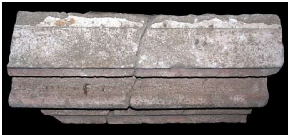
22. Lépcsős ablak szemöldökkő töredéke a visegrádi királyi palota nyugati homlokzatának a zárterkély melletti szakaszáról

és csak a szükséges mértékben egészítették ki. Ez a dekoráció egy fehér alapon bekarcolással és vörös festéssel megjelenített nagyméretű kváderosztást jelentett, amely ugyanilyen vöröses-rózsaszín festésű sarokarmírozással, párkányokkal és nyíláskeretekkel társult. A nyíláskereteket ugyanakkor egy festett fehér keret is körülvette. Ezt a rózsaszín-fehér összhangot egészítette ki a palota cserépteteinek vörös színe, amit a már lerakott cserepek helyszíni vö-