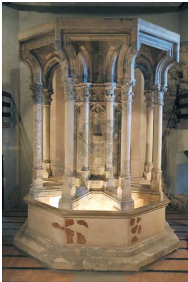
6. A visegrádi királyi palota Zsigmond-kori nyolcszögű díszkútja

élénkzöld háttérrel 10 és cinóberpiros levelekkel voltak díszítve, a nyolcszögű kút oroslánfejes vízköpőjén a sörényen piros festés, a szemeken festett fekete pupilla maradt meg. 11 Kérdéses, hogy a „piros festés” nem aranyozás alapozásául szolgált-e ezekben az esetekben. 12 A falikút baldachinfedlapjának címerét keretelő profil homorlatát sötétkék, pálcatajgát világoskék, lemeztagját pedig piros festés volt megfigyelhe-