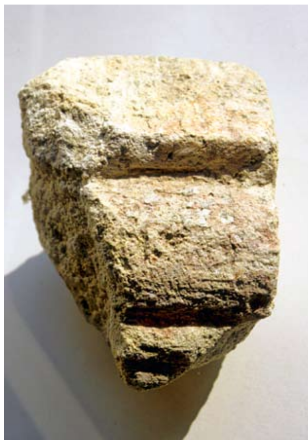
24. A visegrádi királyi palota díszudvarának balusztrádkorlátja vörös festésmaradványokkal

golt kerettöredékei közül többön maradtak festésnyomok, az egyikén jól megkülönböztethető a profil élszedését és homorlatát fedő fehér, és a külső falsíkot díszítő rózsaszín festés. 27 Tehát itt a vakolt külső homlokzatok negatívjaként a rózsaszín falsíkból fehérén emelkedtek ki a nyílászervek. A kerengő feletti szintet nyitott, oszlopos, balusztrádos reneszánsz loggia alkotta. Ennek színösszetétele viszont a földszint fordítottja volt. A balusztrád egy párkánytöredékén fennmaradt a rózsaszínes vörös festés, 28 a fehér keménymészkből faragott baluszterbábok, és az oszlopok alatt elhelyezkedő vörösmárvány törpepillérek viszont festetlenek voltak. Szintén nem maradt semmilyen festésnyom a rózsaszínű hárshegyi homokkőből, és sárga durva mészkő-