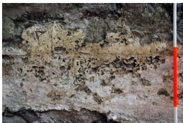
18. Kváderes vakolatdíszítés maradványa a visegrádi királyi palota nyugati homlokzatának déli szakaszán

jéből fennmaradt indaornamentikával díszített töredéket erőteljes zöld festés fedi. Szintén az egyik ablakvimperegéből származhat egy hollós Hunyadi címer töredék, ahol a holló fekete festése maradt fenn. A mérművek, a nyíláskeretek és a párkányokat díszítő ornamentika viszont a falfelületekhez hasonlóan kívül is fehérre meszeltek voltak. A színek tehát jól érzékelhetők az erkély legfontosabb, heraldikai elemeinek kellő kiemelését szolgálták az alapvetően fehér homlokzatból.