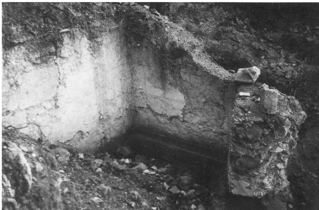
9. A visegrádi királyi palota kápolnájának külső falfestése az 1935-ös feltáráskor

A Zsigmond-kori visegrádi palotának csak a kútjai voltak teljesen faragottkő-szerkezetek. A falazatok törtkőből készültek, csak a sarokarmírozásokhoz és a nyíláskeretekhez használtak faragott köveket. Sajnos ezen, jobbra andezittufából készült faragványok felülete annyira lepusztult, hogy eredeti festésük ma már nem állapítható meg. A törtkő falakon azonban néhol fennmaradtak eredeti vakolatok.