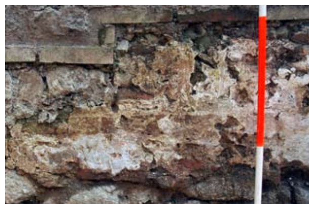
19. Megégett felületű kváderes vakolatdíszítés maradványa a visegrádi királyi palota nyugati homlokzatának déli szakaszán

1989-ben a homlokzat északi felét díszítő címeres zárterkély feltárása során, az erkélytől délre egy fent említett teljesen azonos profilú és festésű ablakkeret szemöldökkő töredékét találtuk meg. Egy azonos profilú és hasonló festésű – de ez esetben csak 9 cm széles rózsaszín sávval kerettel – a ablak-szárkő, közelebből ismeretlen lelőhelyen, a palo-