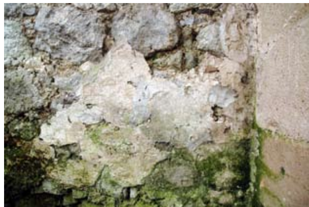
16. Kváderes vakolatdíszítés maradványa a visegrádi királyi palota nyugati homlokzatán, a Mátyás-kori zárterkély mellett

A homlokzat fő díszje az a gazdag mérműszobor- és címerdekorációval borított zárterkély volt, amely a kaputoronytól északra eső falszakasz közepén helyezkedett el. Az erkély 1989-es feltárása során előkerült in situ lábazati részekben és az igen nagy számú kötődéken jelentős festésmaradványok figyelhetőek meg. A teljes egészében faragottkő szerkezetű építmény földszintje különböző (szürkétől a vörösig változó) színű hárshegyi homokkőből, emelete sárgásfehér durvamészkőből készült. A külső és a belső falfelületeket azonban mindenhol egységes fehér meszelés fedte. A belsőben ez az egységes fehér meszelés kiterjedt a boltzati csomópontokat és a konzolokat díszítő ornamentikára, szobrokra és címerekre is. A külső azonban ennél színesebb volt. A főpárkányt díszítő, és az ablakzónában, baldachinok alatt álló angyalok által tartott címereken alapozás nélkül a kőre festett színes heraldikus festés nyomai maradtak meg. Az egyik emeleti ablak számárhátíves vimpergájának ívmeze-