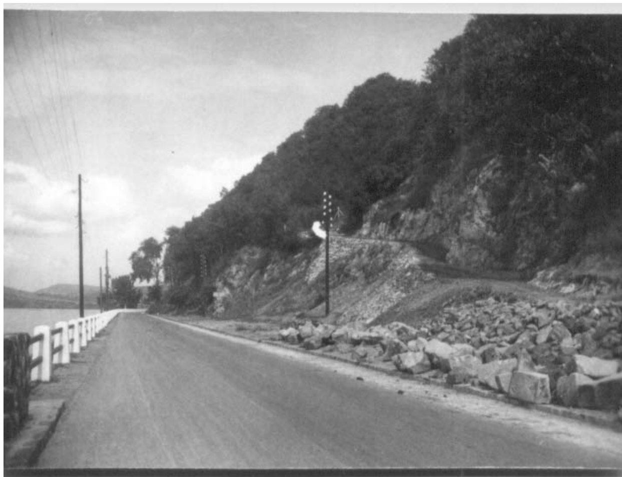
9. kép A Salamon-toronyhoz vezető turistaút építése 1938. szeptember

sök emlékművét, méltatta IV. Béla, Nagy Lajos és Mátyás uralkodói nagyságát, végül megemlékezett arról a hősiességről, amelyet Visegrád szülöttei a világháborúban az ő vezérlete alatt tanúsítottak.