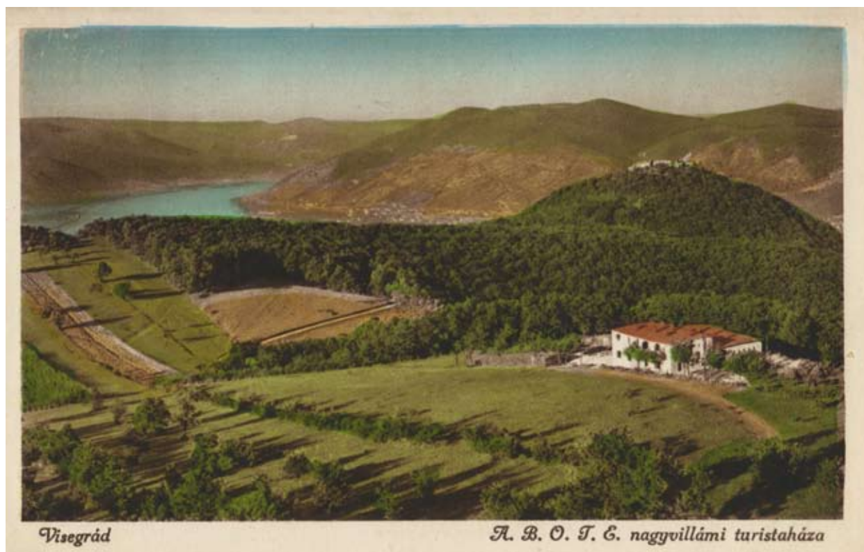
3. kép A nagyvillámi turistaház, 1930-as évek

ti Orvosok Turista Egyesületének turistaházát avathatta fel. 4 (3. kép)