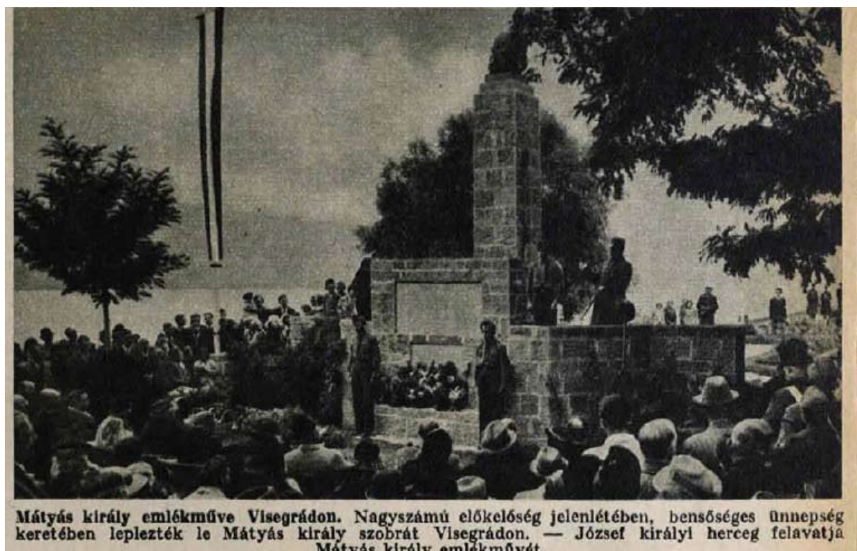
8. kép A Mátyás szobor és emlékmű felavatása, 1939. október 11.

letékes tényezők tudtával és megbízásából arra kérlek, kegyeskedjél a Vár restaurált részeit és a három nagy király emlékét a Salamontorony udvarán (autóval elérhető) tartandó ünnepi beszéddel felavatni.