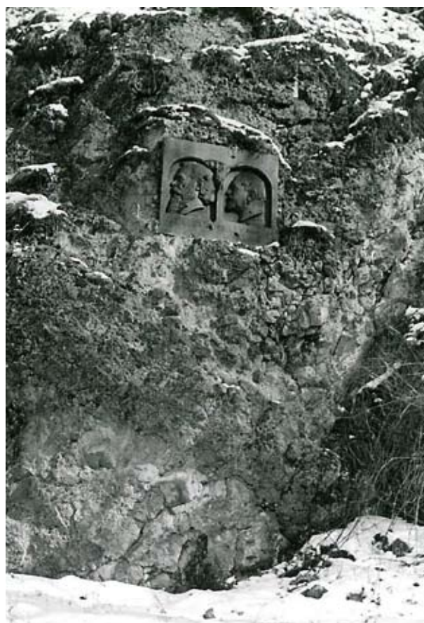
12. kép Schulek Frigyes és János domborműve a Schulek út elején, 1940.