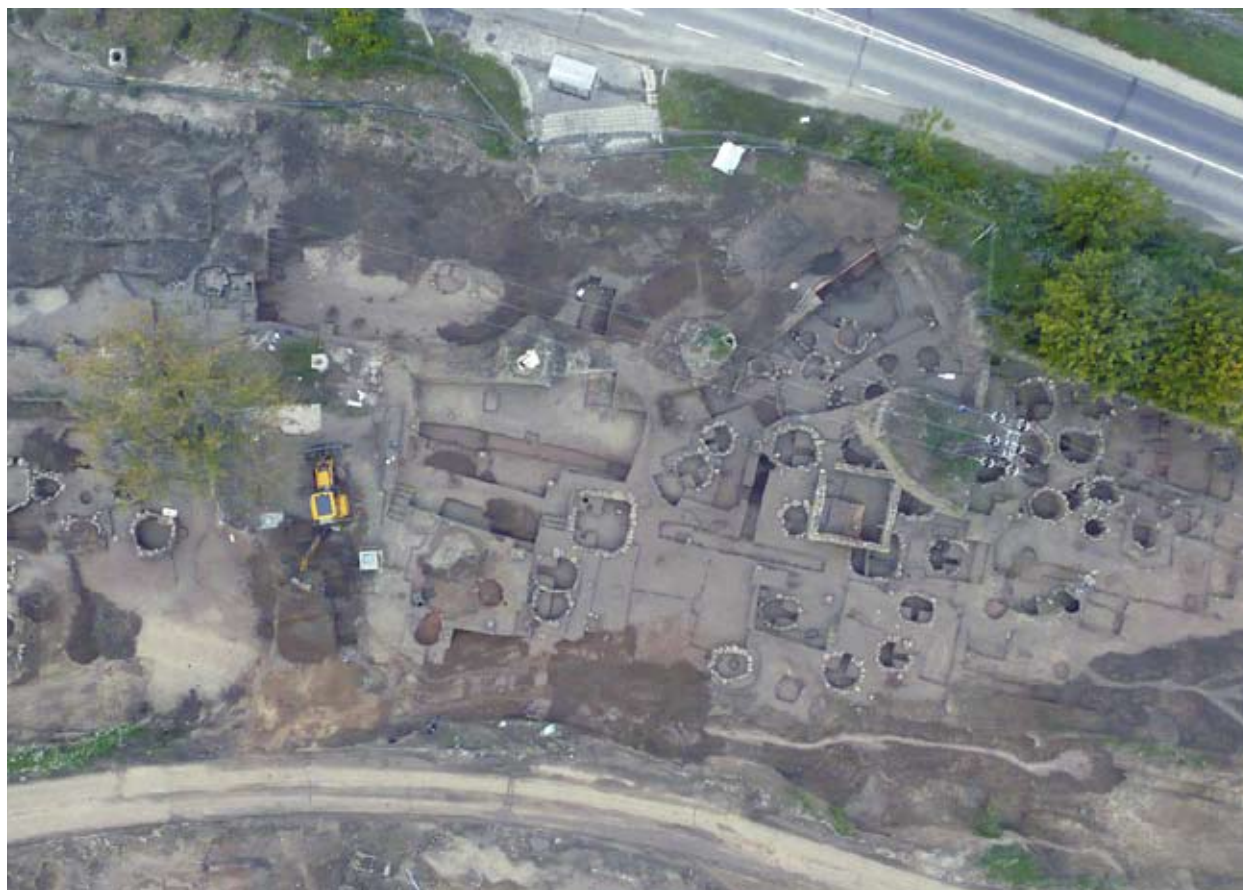
A 2008-as évi ásatási terület részlete (Civertan Bt.)

rendelkező kemencék. A terepviszonyokat követve az objektumok 4 szinten helyezkedtek el. Egymáshoz viszonyított távolságuk szabálytalan: van ahol 4-5 méter, máshol akár a 30 métert is eléri. 5 Öt szuperpozíciót találtunk: két esetben egy korábbi platnit vágtak el az új kemence hamusgödrének kialakításakor (53-54, 42. obj.), a többi esetben a korábbi kemence hamuzójába építették az új sütőfelületet, ezért ezek alapozása mélyebbre került (3-12, 48-49, 139-141. obj.).