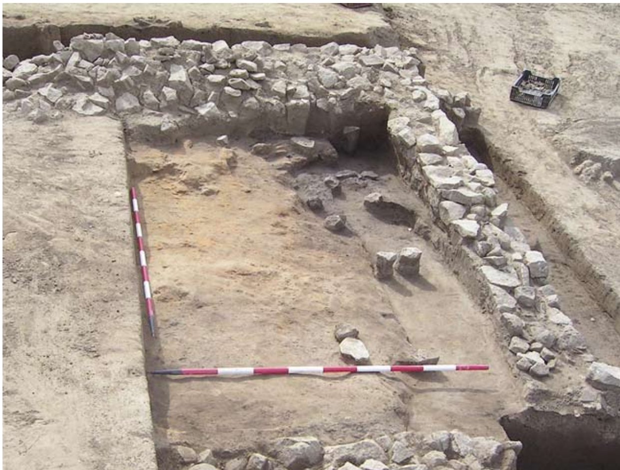
92. objektum bontásának kezdete

A kemencéken kívül a lelőhelyen egy négyszögletes, 530x560 cm-es kőalapozású építmény is napvilágra került (92. obj.). Alapfalai kb. 50 cm szélesek, 3-5 kőszori magasságig megmaradt, agyagba rakott kövekből állnak (6.