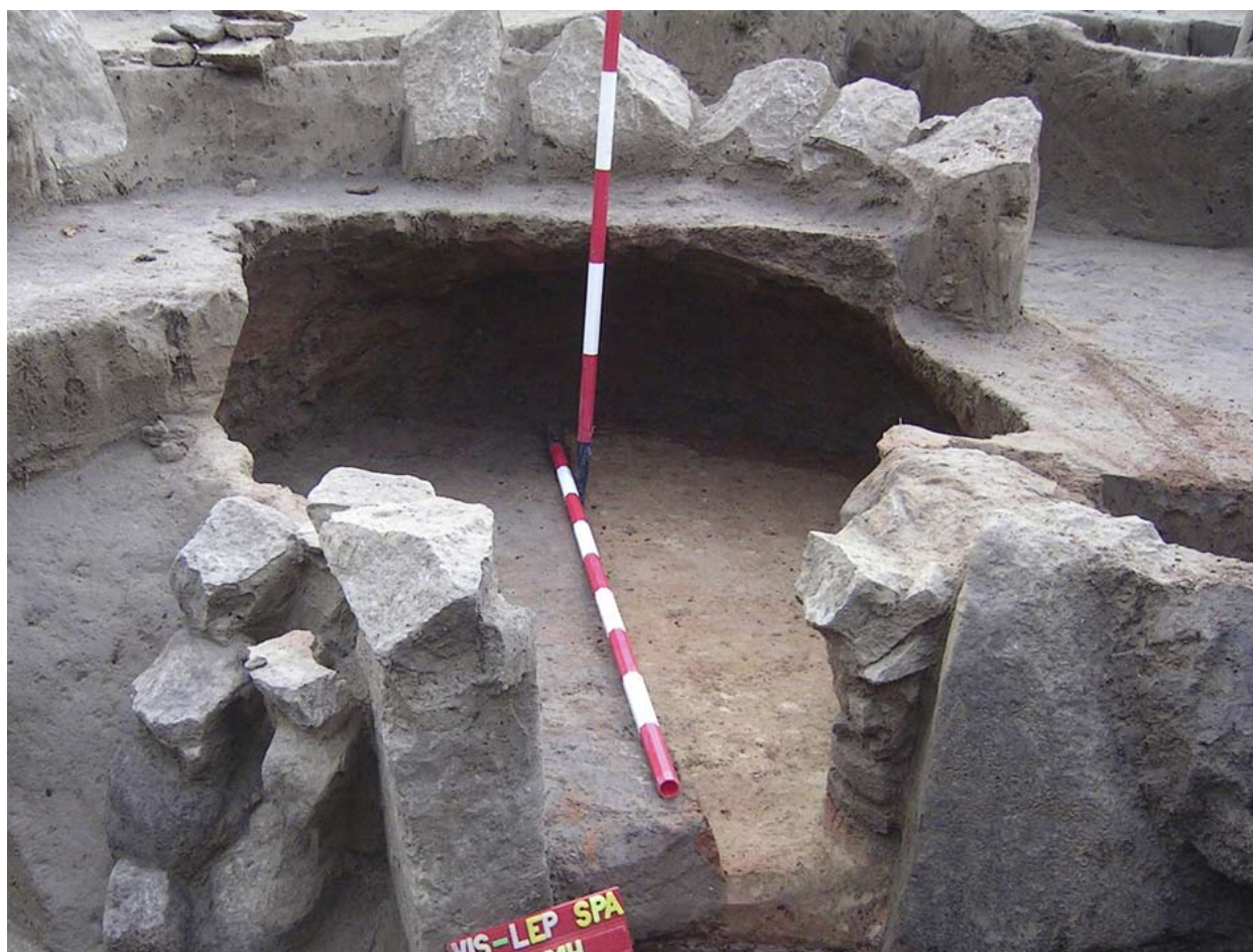
Őskori sír bolygatásával kialakított kemence

139. objektum szintén igen nagyméretű volt, platnijának alapozása két rétegből állt: alul függőlegesen, felette vízszintesen rakott kerámiatöredékekből alakították ki.