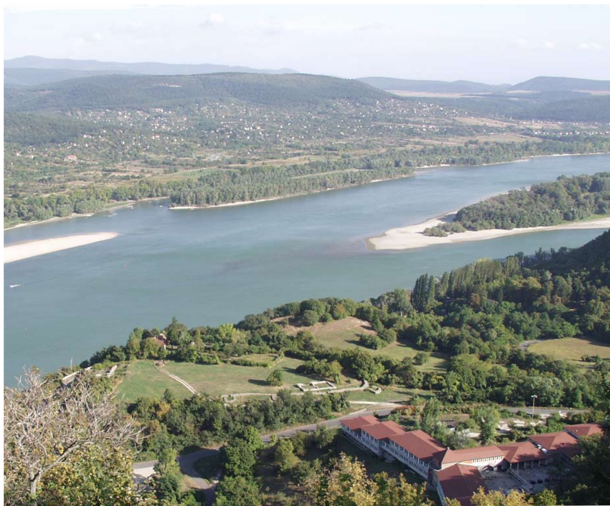
A Sibrik domb és a Várkert látképe

Visegrád első említése Szent István király 1009-es, a veszprémi püspökség számára kiadott adománylevelében található mint a visegrádi vár ispánsága (comitatus Vyssegradiensis civitatis). 1 A Visegrád vármegye ispáni székhelyéül szolgáló sibriki erősség a főesperesi templommal, valamint a Várkertben levő váralji szolgáltató faluval és az 1055 körül alapított ortodox Szent András monostorral egészült ki. Visegrád államalapításkori ispáni központjának kutatását tudományos jelentősége mellett azon adottsága is indokolja, hogy jelenlegi ismereteink szerint a Szent András monostor kivételével 1241 után nem számolhatunk a történeti együttes továbbélésével, s területén a későbbi korokban sem történt beépítés, tehát a 11-13.