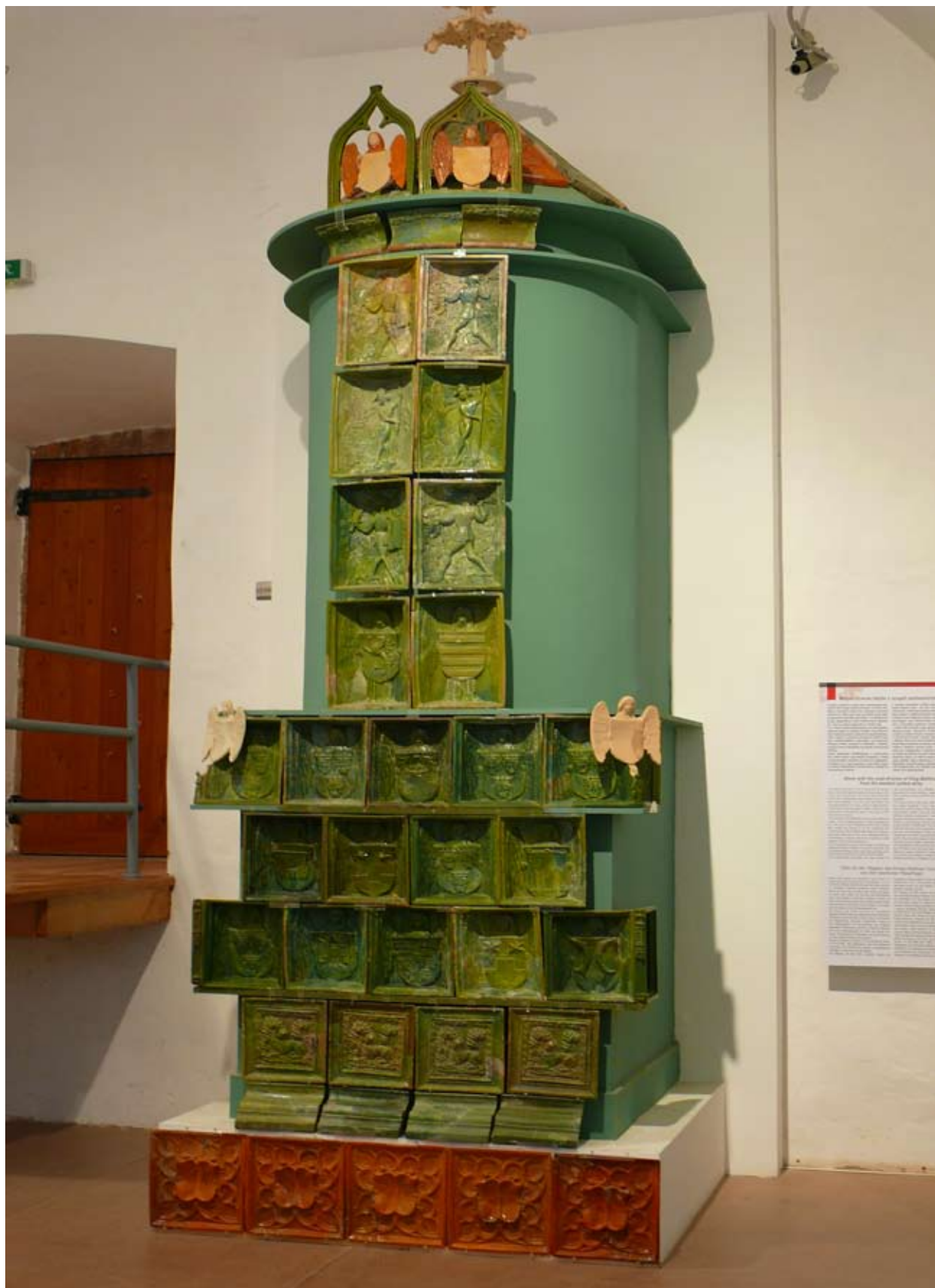
A visegrádi Királyi Palota állandó kiállításán bemutatott Mátyás-kori kályha rekonstrukció a restaurált kályhacsempékkel.