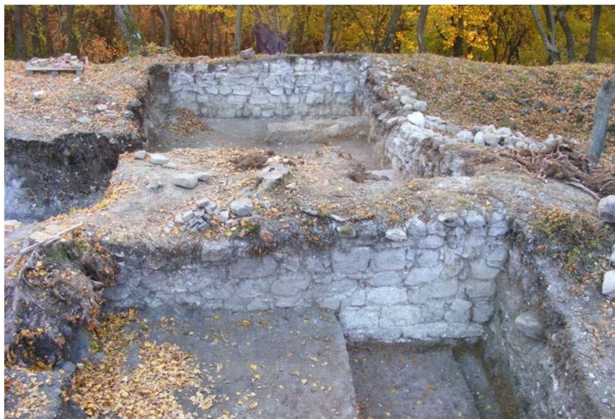
Gazdasági épület maradványai