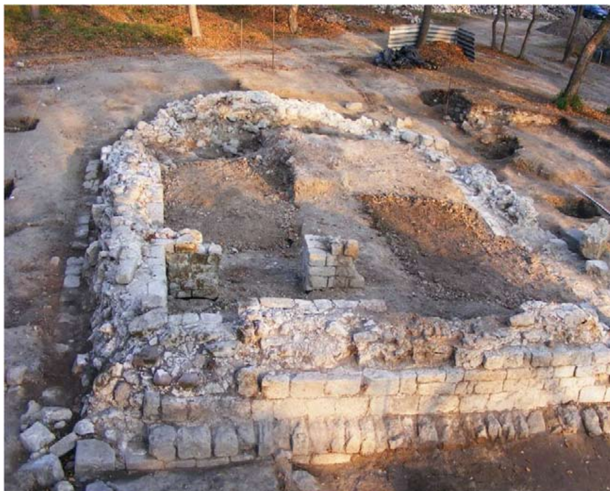
A templom maradványai

A lelőhely, és a 19. században még világosan felismerhető romok régóta ismertek a középkori kutatás számára, de azonosításával és funkciójával kapcsolatban eltérő elképzelések fogalmazódtak meg. Felmerült, hogy ciszterci kolostorhely, pálos kolostor vagy falusi plébánia templom állt ezen a helyen. Ezeket az egymásnak ellentmondó elképzeléseket a II. világháború előtt folytatott, jórészt szakszerűtlen ásatások sem tudták bizonyítani. 2005-ben azonosítottuk a lelőhelyet a középkori Kovácsi falu templomával és a körülötte később felépült nagyméretű üveggyártó műhelyt, amely a pilisi ciszterci apátság egyik ipari központja volt.