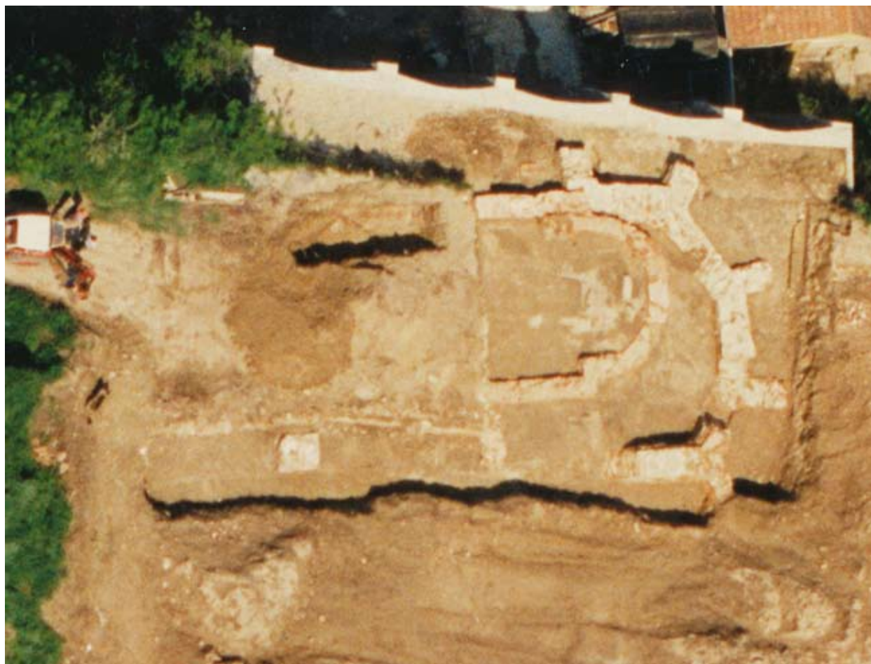
Légifotó a feltárásról