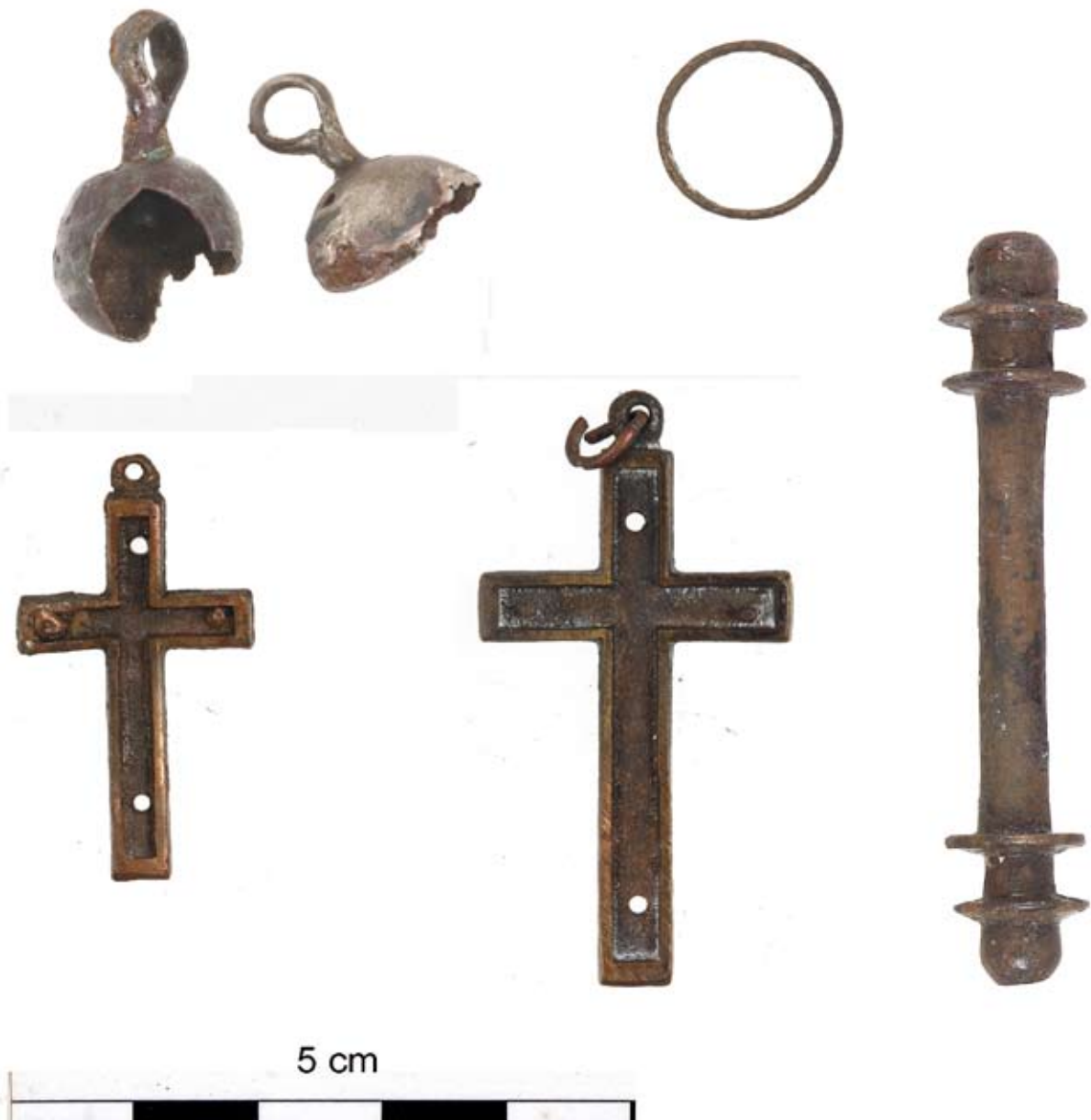
Késő középkori és újkori leletek: fülesgomb, gyűrű, feszületek és pálca formájú övkapocs

az I. Ferdinánd dénárjával datált 1. sír, a kisgyermek koporsójára ugyanis vaslakatot helyeztek. A 3. sír déli fele közvetlenül a korai templomhajó északi fala alatt helyezkedik el, tehát már a román kori templom előtt is temetkeztek erre a helyre. A 38 db szórvány érem és a viseleti tárgyak főként a 14-16. századra utalnak (pántgyűrű, fülesgombok), de akad köztük korábbra (pl. I. László-dénár; fejesgyűrű), illetve későbbre (réz keresztek) keltezhető is. A templom helyén és körülötte lévő temető folya-