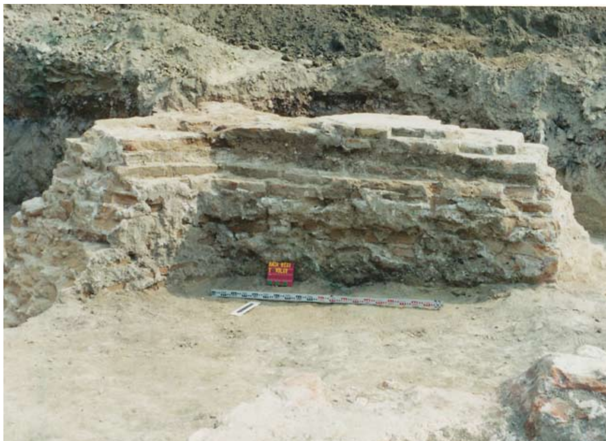
A polygonális szentély DK-i része a felmenő fal csonkjával

valamint tudva, hogy a falu a 11. század végén alapított bátai apátság birtokközpontja volt és hogy helyén már építése előtt is temetkeztek, nem tartjuk lehetetlennek a 11-12. század fordulója körüli keletkezését sem.