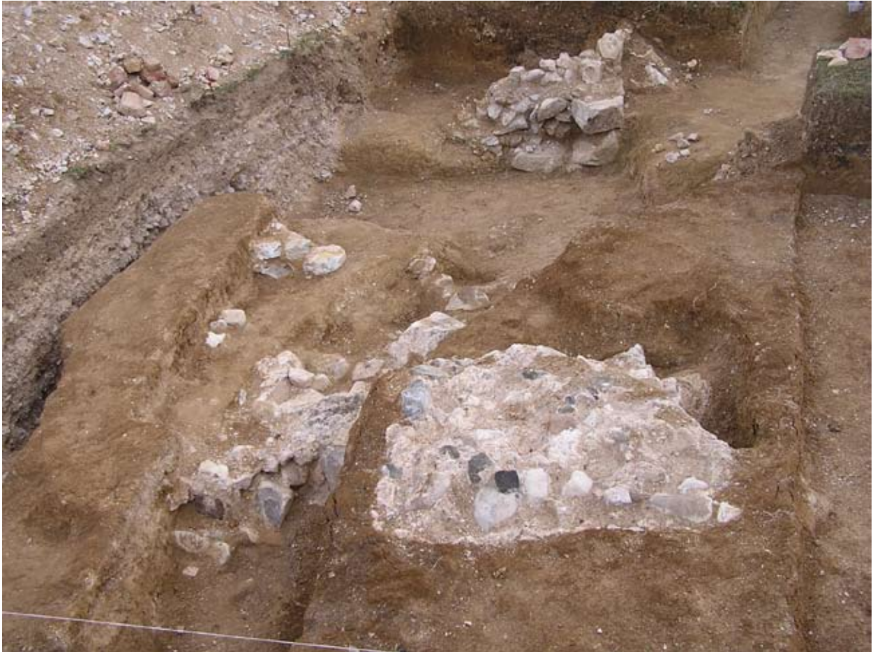
Szentély íve északon, köpenyfal, pillér

2013-ban ismét Boruzs Katalin régész vezetésével folyt az ásati tevékenység Koromszón. Ekkor a déli irányban a kolostorszárny lehatárolására törekedtünk. DK-i térségben a kolostor helyiségeiből való szemetet hordták ki, itt nagy mennyiségű, főként 13-14. századi kerámiatöredék és állatsont került a felszínre egy gödörből. Erről nem zárható ki, hogy eredetileg talán védelmi funkcióval bíró árok részlete volt. A 2003-as ezt átszelő régi kutatóárok metszetében még így mutatkozott. Amúgy ezt a körítő árkot egy 1960-as évekbéli légi fotó is jól