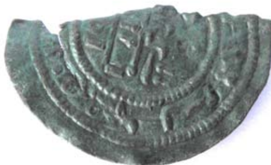
III. Béla rézpénz

2009 őszén a templom fő hajójában újabb temetkezésekre találtunk. A részben bolygatott sírokból bronz pitykegomb, párizsi kapocs és női párta bronz rugójának a maradványai kerültek elő, amelyek a késő-középkort idézik fel. A templomtól délre több helyiséget használtak a szerzetesek. Egy nagyobb méretű görgeteg patakövekből és igen homogén, erős mészharcossal készült traktust tártunk fel, amelynek 2-3 kősorig megmaradt alapozását viszonylag kis mértékben érintette az újkori kőkitermelés. Ebben a térségben, de már a falon kívül III. Béla rézpénzének töredéke került elő szórványként, ami már egy korábbi építési periódust sejtetett. Amúgy a leletanyag főként 13-14. századi házi kerámiából állt. Kiemelendő a kolostorszárny helyiségének délkeleti sarkában talált, szájjal lefelé fordított ép, későközépkori fazék. Ez az agyagba volt fúródva, a kibontását követően apró madárcsontokat találtunk benne. A bronztárgyak többsége a bolygatott sírokból, mint vi-