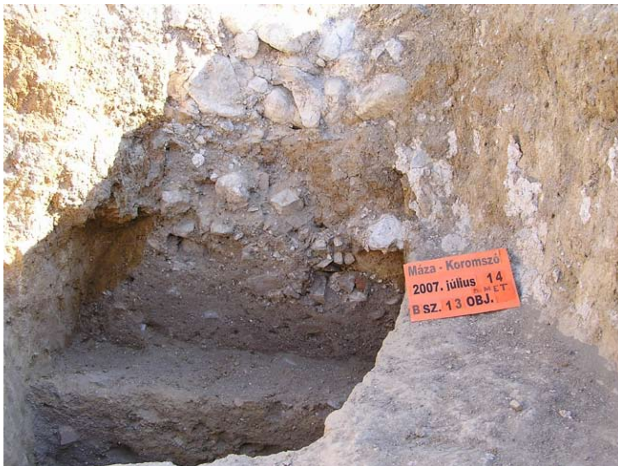
A pince agyagíve lassan kezd kibontakozni

déli részleteit sajnos kitermelték. Délkeleten egy hatalmas folt látható a képen, amelynek a pontos funkciója egyelőre máig sem tisztázódott, úgy tűnik, hogy a közelmúlt régészeti kutatásaival sem érintettük még azt. A kolostor templomának nyugati oldalán sokkal markánsabb jelenségek mutatkoztak a radarképen. Itt az előcsarnokot, kaput talán egy tornyot véltünk felfedezni rajta, továbbá gótikus támpilléreket az északi oldalon, délebbre pedig az összeköttetés is jelentkezett a kolostorszárnyal.