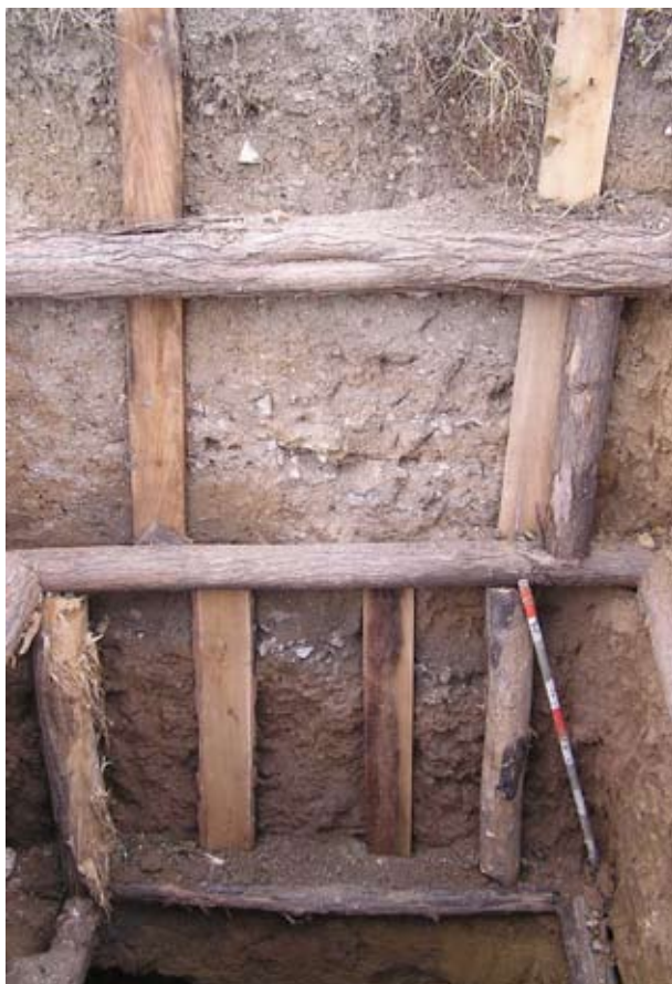
A pincefeltárás megindul

seleti kiegészítők kerültek elő: pártatöredékek, övcsat, gomb.