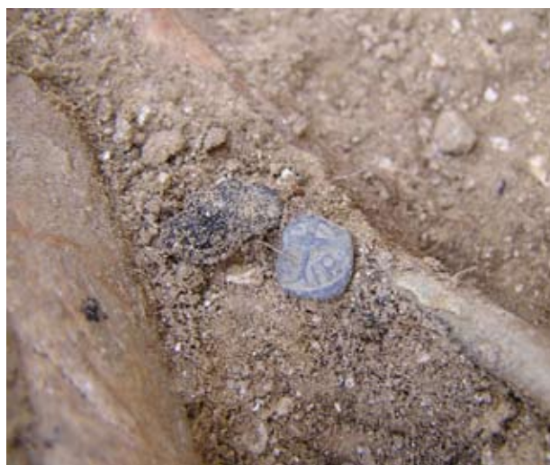
Zsigmond király érem egy sírban

dénára került elő. Később részben ide vájták bele a már 2007-ben feltárt téglával elválasztott sírokat. Az általam alapozási szinten gyűjtött habarcsminták vizsgálata, összevetése alapján kijelenthető, hogy ezek a falszakaszok egy periódusban készültek: egy építmény, vélhetően az udvarház részei voltak. Szintén egy korai periódushoz tartozott az a rövid falszakasz is, ami a rézsűs pincelejáró melletti területen, csupán