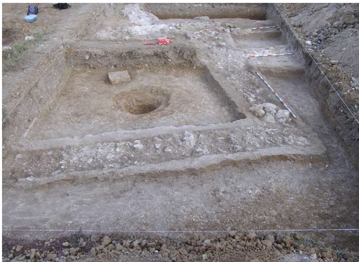
Újabb helységek kerülnek elő a kolostorszárnyban