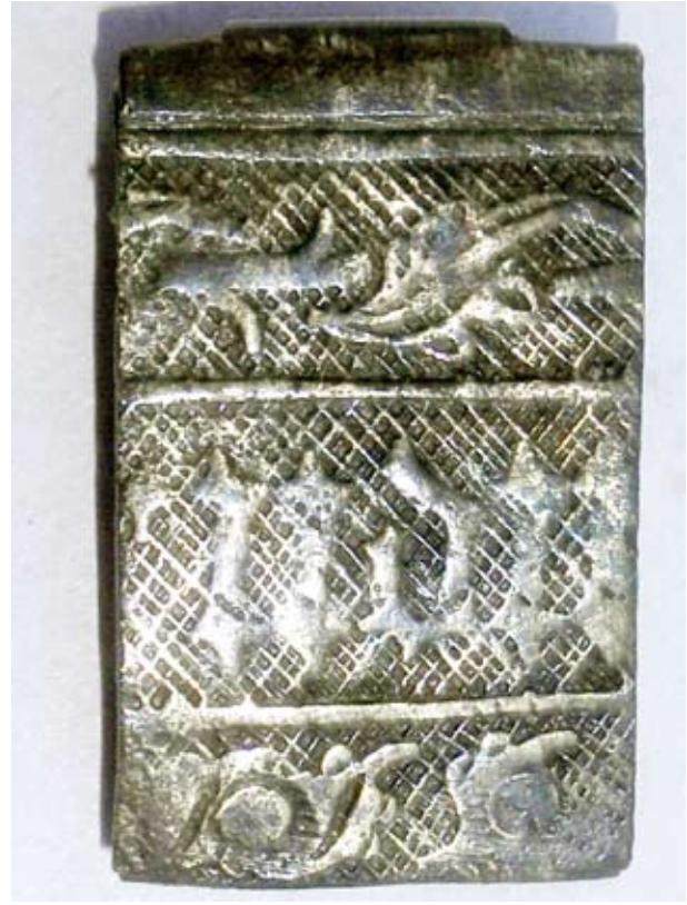
Kódex kötéstábla veret

pince, mely egyenest és úgy vízszintesen hatolt be.”