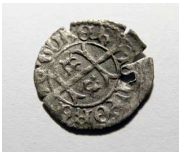
Interregnum, 1444-46 érem átfúrva a kolostor területéről szórvány