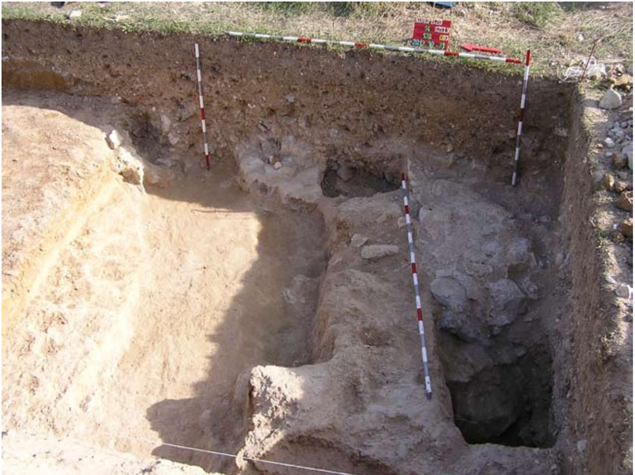
A szentély íve délen