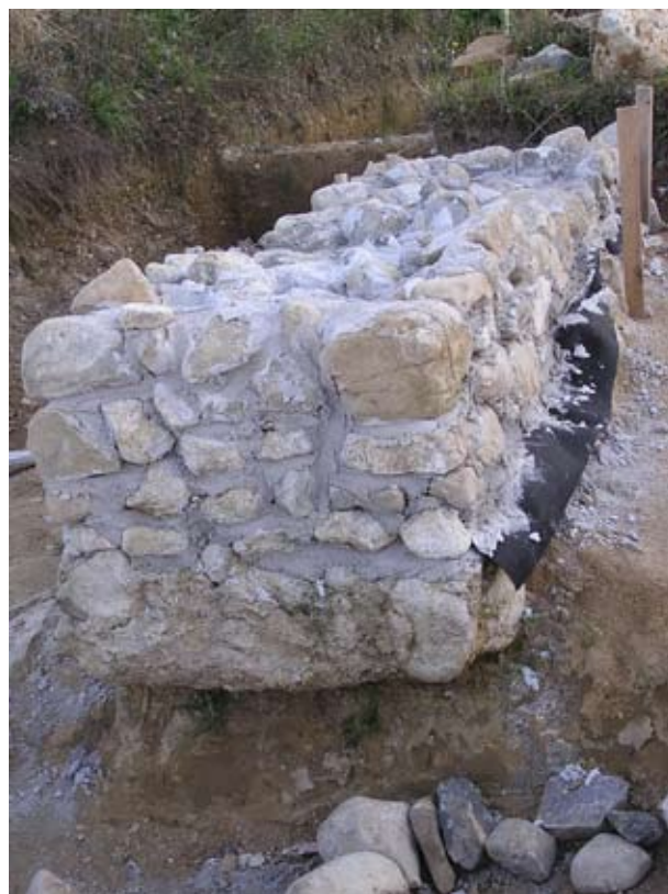
A kolostor egy helységének felfalazása

A templom nyugati főfalától keletre, azzal párhuzamosan futó, nagyjából azonos alapozási szinten lévő korábbi periódusok falmaradványai is mutatkoztak. A főfaltól kb. 2 m-re egy 60-80 cm széles habarcssáv jelentkezett az alján kisebb riolitufa darabokkal. Ettől kb. 6 m-re nyugatra 85-90 cm széles szintén riolitufás falszakasz volt, alapárkának alján egy habarcsröghöz tapadva III. Béla /1172-96/ ezüst