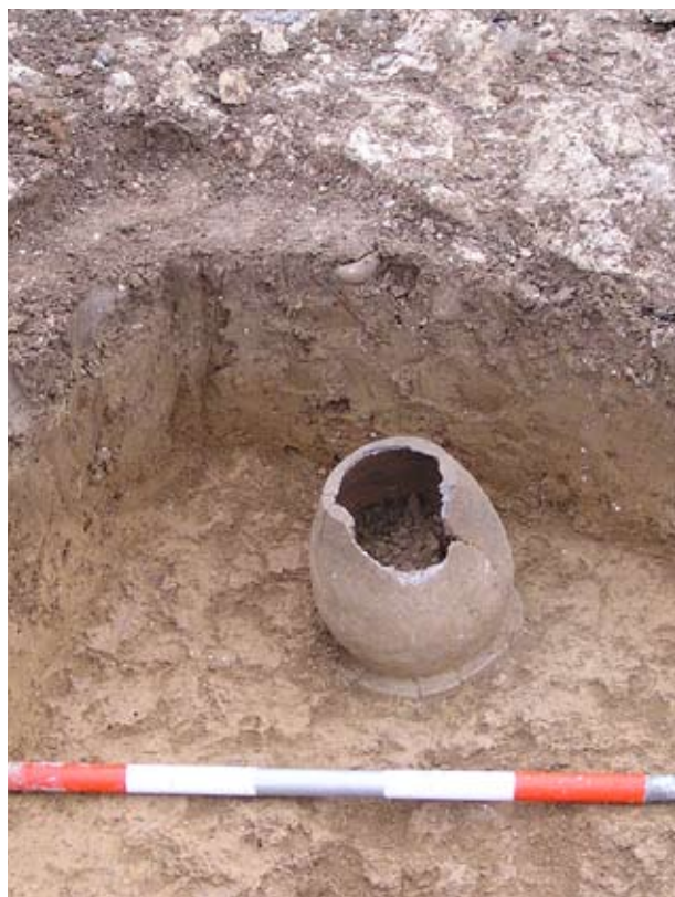
A szájjal lefelé fordított fazék

torony kiépítése valóban megtörtént, akkor el is dőlt a kolostor rendi hovatartozásának a kérdése, ugyanis a ciszterciák építészete nem jellemző a nyugati torony. Szóval a kutatás jelen állása szerint valószínűbbnek tűnik az, hogy Koromszóra bencések érkeztek a 13. század közepén. A templom déli mellékhajójában téglával elválasztott, részben bolygatott, melléklet nélküli sírokat találtunk két rétegben.