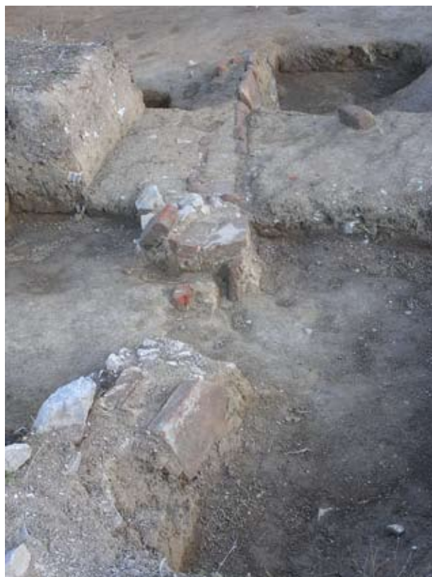
A vízvezető, állított helyzetű téglával kirakott csatorna

habarcsfoltokban őrződött meg. A feltárt terület DNy-i sarkában, a templom és kolostor falain kívül, 10 különböző méretű és kialakítású cölöplyuk mutatkozott, amelyek szintén a kolostort megelőző periódushoz tartozhattak. Amint az a 50-60 cm szélességű ÉK-DNy-i irányú falszakasz is, amely talán egy fa felmenő falú építmény, vélhetően az udvarház alapozásául szolgált egykor.