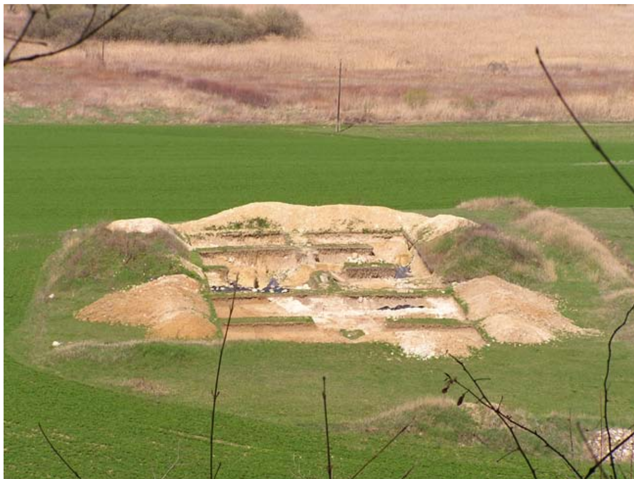
Koromszó látkép a Szarka-hegyről, 2010 ápr.

átlagéletkort kizárt, hogy a leírás az 1240-es évek második felénél korábbi legyen. Testvérei voltak Albert fia Sup és Mihály, akik nevei más szintén hiteles oklevelekből bukkannak fel 1244-1275 között. Összegezve az eddigi fejtegetésünket az oklevél határjáró részét valamilyen 1250 körül vetették először pergamenre. Ez azért fontos, mivel benne említik meg: „a koromszói nemesek monostorának földjeit”, mint amely Máza területével akkoriban szomszédos volt. A szerzetesház tehát nem sokkal a tatárjárás után már állott.