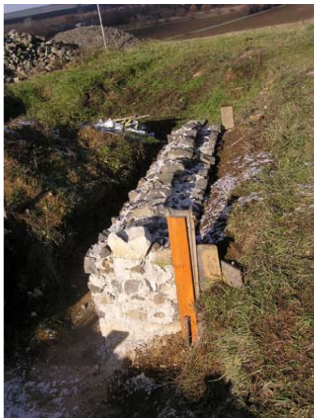
Az udvarház egyik falmaradványa felfalazva