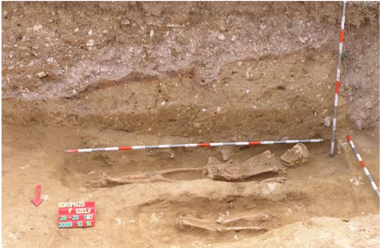
Átégett agyagréteg cölöplyukkal