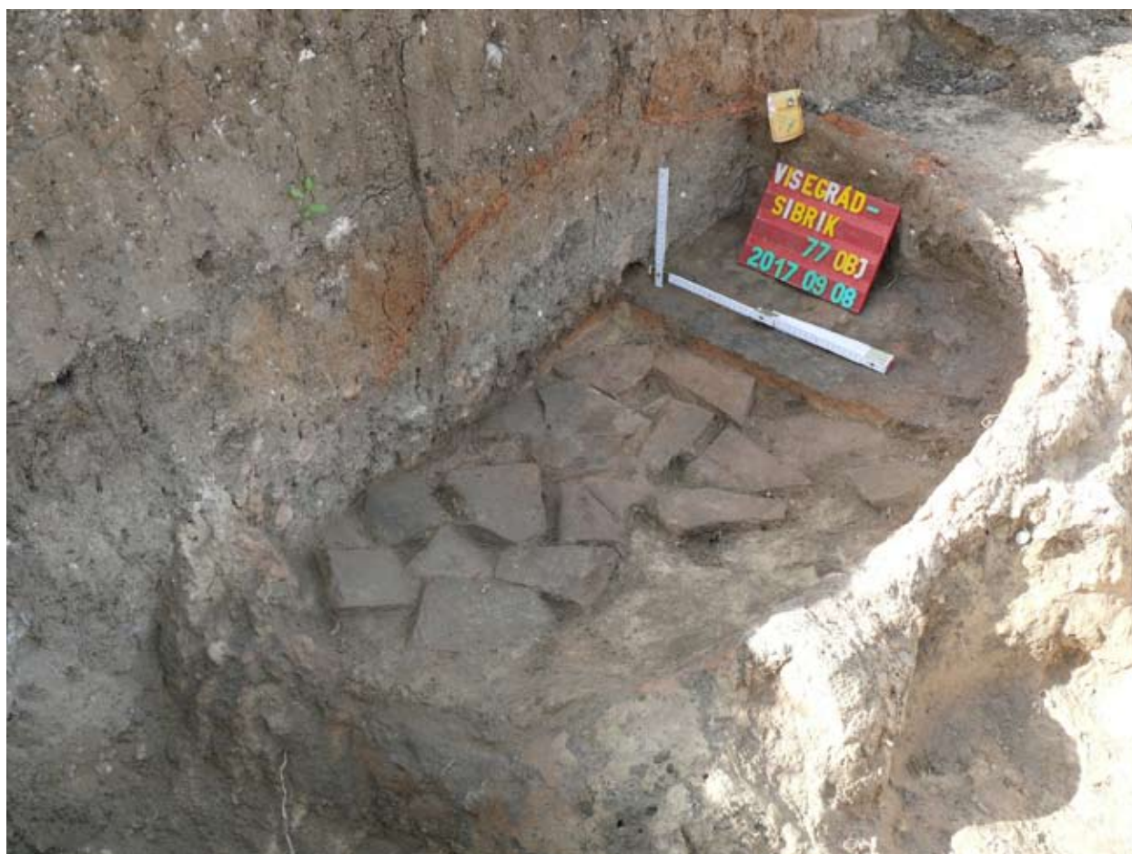
8. kép: Római téglatöredékekkel kirakott kemenceplatni.

nagy tárológödör betöltéséből besimított díszű, narancssárga bevonatos és kézzel formált edény töredékei is. Az ötvöskemence leletegyüttese mellett a telepobjektumok betöltéséből a (kora) középkori házikerámia és fémleletek, egy, a