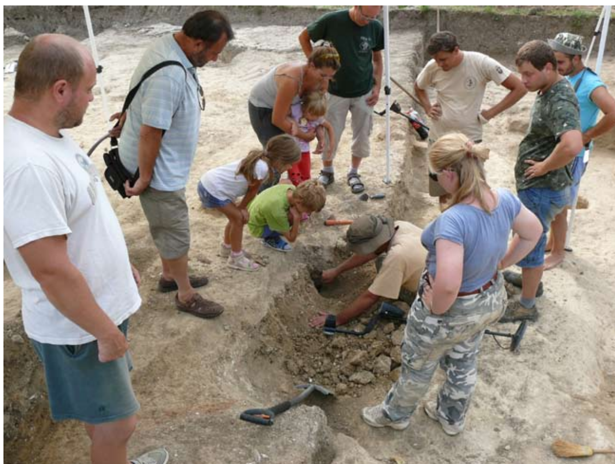
14. kép: Életkép az ásatásról.