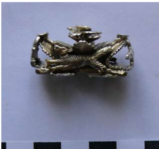
13. kép: 16. századi mente kapocs töredéke.