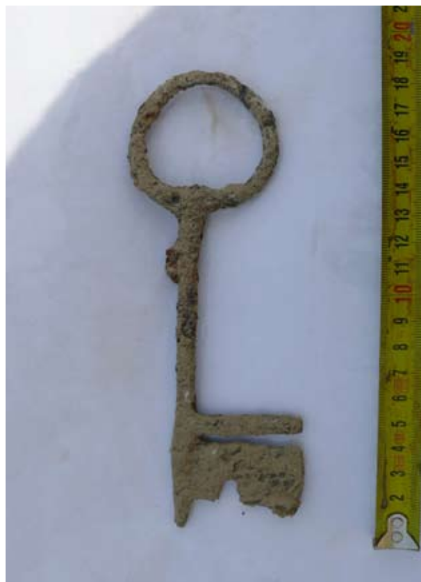
7. kép: Vaskulcs a 65. objektumból.

A felső mintegy 60 cm-es rétegben a korábbi évekhez hasonlóan teljesen kevert leletanyag volt: római kortól egészen a hódoltság koráig datálható. Bár római kori objektum idén nem került napvilágra, a kevert rétegből és a középkori gödrök, házak betöltéséből egyaránt kerültek elő 4. századi római bronzok, az egyik