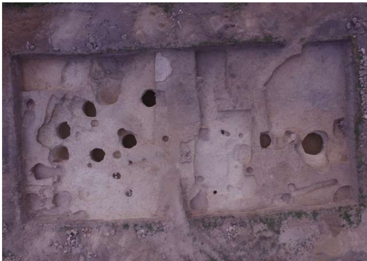
2. kép: Visegrád, Sibrik-domb. Drónfotó a 2017-ben feltárt területről.

ben végzett geofizikai felmérés. 3 A korábbi ásatások és a 2010-es felmérés magnetogramja alapján, 2013-ban végzett hitelesítő ásatás, majd az azt követő tervásatások során (2014, 2015) bebizonyosodott, hogy az erődítmény belterülete még rengeteg érdekességet rejt magában, ami a lelőhely periodizációjáról alkotott képünket nagymértékben szélesítheti. 4 Az egy objektumból előkerülő római kori mázas, besimított díszű és kézzel formált edénytöredékek a késő római kor anyagi kultúrájának sokszínűségét mutatják. A kerámia- és fémanyagban egyaránt megfigyelhető 8-9. századi jelenlét (elsősorban házi kerámia, bronz sarkantyú, kisszíjvégek, ékszerek) arra utal, hogy már az