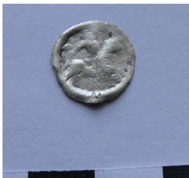
10. kép: III. Béla kori brakteáta.