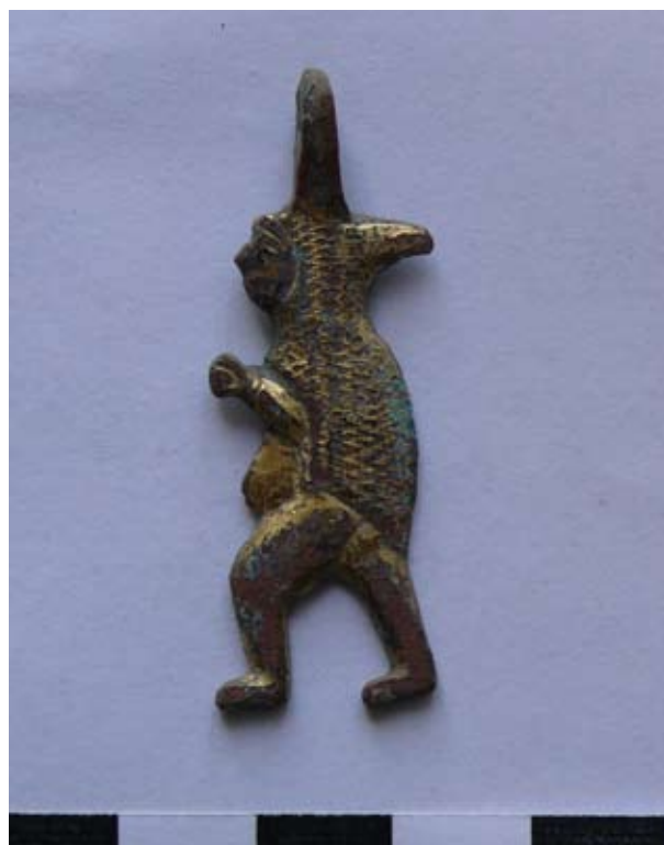
12. kép: 14. századi aranyozott bronz függő.