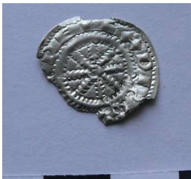
9. kép: I. (Szent) László denárja.

kora Árpád-kori telepek vonatkozásában egyedülálló 10. századi arany solidus (II. Nikephoros Phokas, terminus post quem 969) és Árpád-kori ezüstpénzek: I. (Szent) László denárja (1077-1095), III. Béla kori brakteáták (1172-1196) utalnak a későbbi periódusokra (9-10. kép). Az