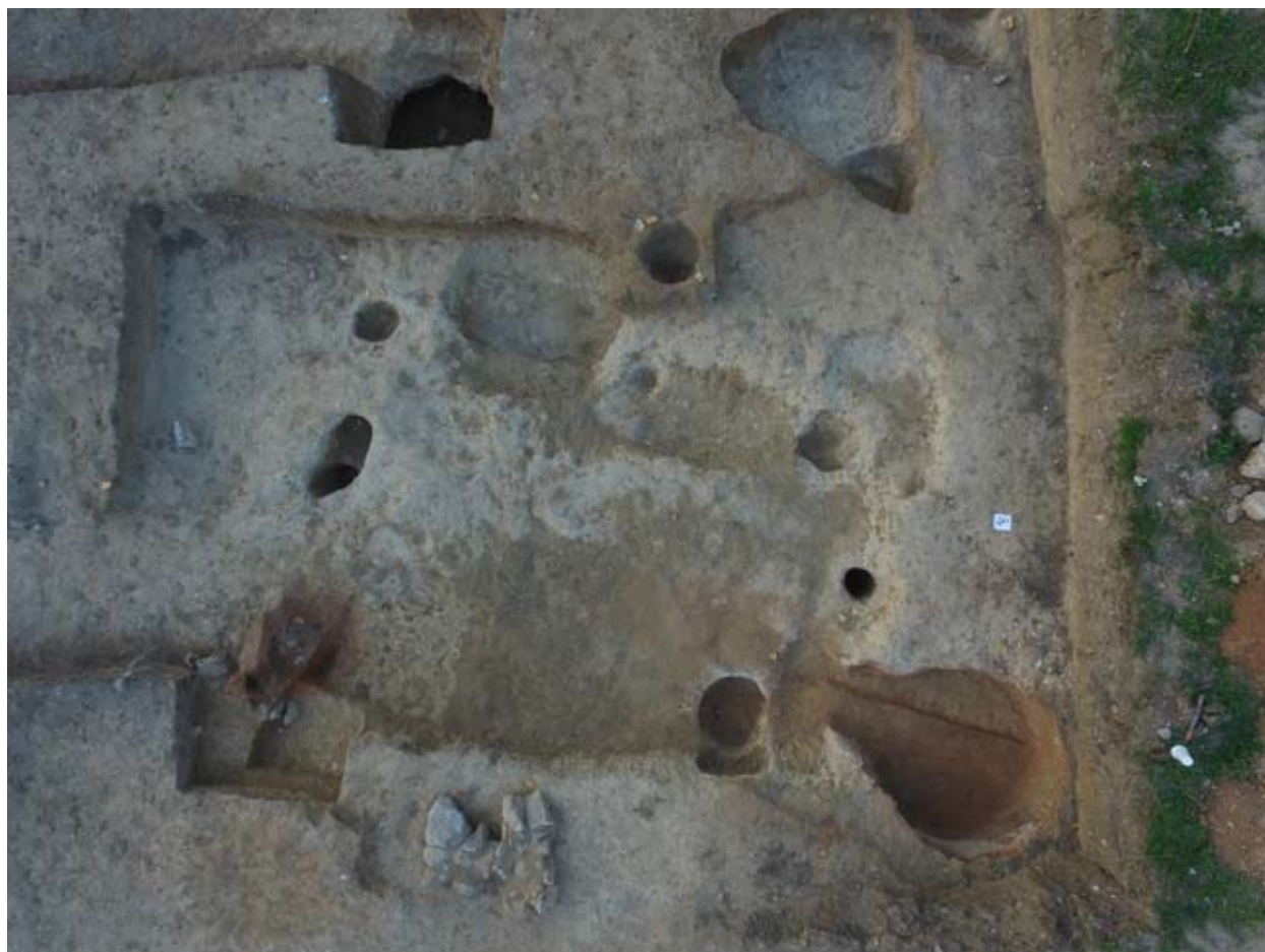
6. kép: 65. objektum drónfotója.

lyek és 1 m átmérőjűek, a nagyobbak 1.5-2 m mélyek és kb. 2 m átmérőjűek, általában méhkas alakúak voltak. A kisebbekből (93., 103., 104., 106., 108. objektum) kevés leletanyag került elő, míg a mélyek (80., 89., 94., 117. objektum) betöltéséből nagyobb mennyiségű állatcsont (egy teljes váz, egy teljes agancs a koponya töredékével stb.), kerámia és téglatöredékek, kövek láttak napvilágot. Emellett szabálytalan alakú gödröket (66., 88., 115., 120. objektum) és egy hosszúkás, sekély személgödröt (113. objektum) figyeltünk meg.