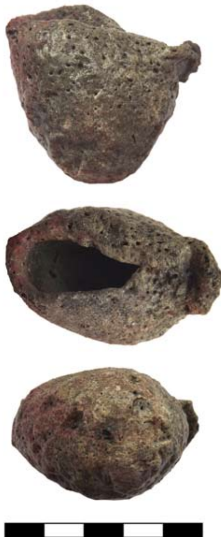
4. kép: 8-9. századi öntőtégely az ötvöskemence betöltéséből.

A mikrorégió lokális hatalmi központjának lakóit vélhetően helyben dolgozó vándor ötvösök láthatták el nemesfém-ből készült ékszerekkel, kistárgyakkal. A legújabb kutatás során előkerült ugyanis egy kivételesen szerencsés lelet, a kora középkori népességhez köthető ötvöskemence (131. szelvény/79. objektum). Az objektum valószínűsíthető keltezését az a szerencsés körülmény adja, hogy egyrészt a betöltéséből előkerült leletanyag nem kevert, másrészt a kerámiatöredékek többsége másodlagosan erősen megégett, vitrifikálódott, illetve felületükön salaknyomok észlelhetők, mely közvetlenül a kemence használatához köthető, azaz egykorú. Az összesen 160x70 cm nagyságú, körte alakú, felülről nyitott kürtös kemencével és kis munkagödörrel rendelkező objektum, s a benne talált jellegzetes öntőtégelyek (4. kép) , nyersanyag-hulladékok és beolvasztásra szánt római fémtárgyak egyedülálló leletgyűjtésnek számítanak, s amellyel, hogy segítségünkre van a lelőhely minél pontosabb megértésében, a kora középkori technológiatörténet megismeréséhez is fontos adatokkal szolgál. A félig kibontott, a