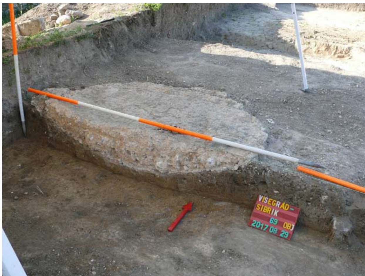
5. kép: Habarcskeverő hely átvágása.

A házak közötti kisebb-nagyobb középkori gödrök korszakolását részint a leletanyag, részint szuperpozíciós helyzetük határozta meg. A kisebb tárológödrök vagy vermek kb. 1 m mé-