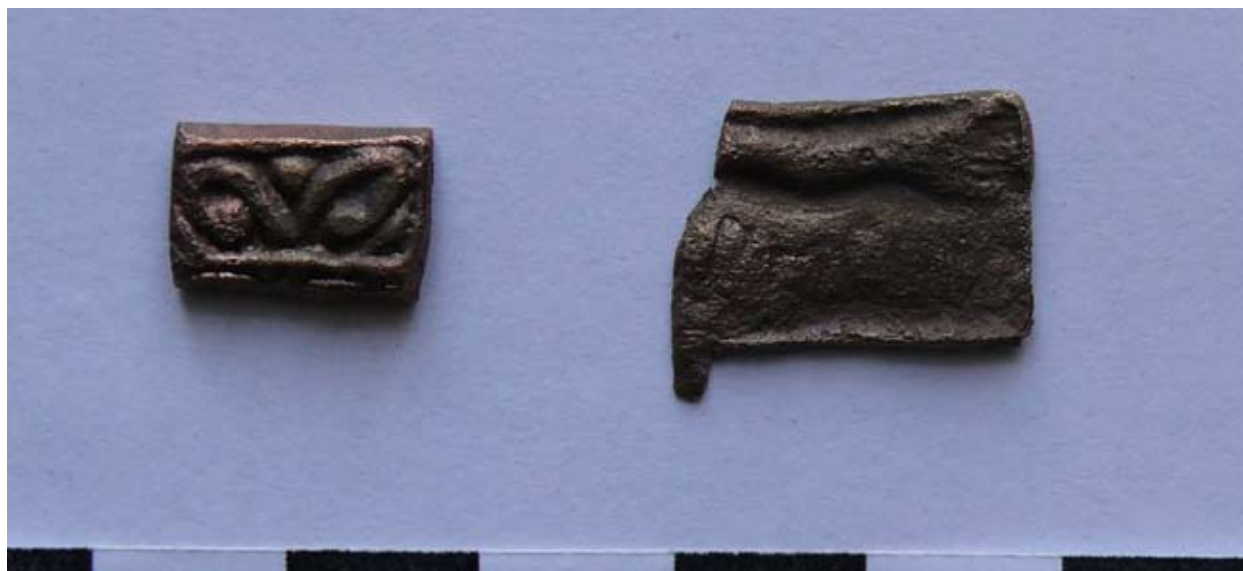
11. kép: Növényi ornamentikával díszített kora középkori szíjvégtördék és 11. századi mellkereszt szárának töredéke a felső kevert rétegből.

építési törmelékben kisebb-nagyobb kövek és habarcsrögök mellett tegula és imbrex töredékekkel találkozhattunk nagy számban. Néhány ujjbehúzásos és állatnyomos mellett említést érdemel a TERENTIVS VP DVX bélyegtöredékes, ami a 370-es évek építkezéseire utal. A fémkereső módszer folyamatos használatának köszönhetően számos ólomdarab (olvadék, öntvény, plomba, puskagolyók), bronztárgy (növényi díszes veret, hagymafejes és aláhajtott lábú fibula, mellkereszt szára, bányászt mintázó aranyozott függő, lemezdarabok), kb. 150 római kisbronz (I. Constantinustól Valensig), 3 középkori ezüst és egy 10. századi solidus került elő (11-13. kép). Emellett a római, kora középkori és Árpád-kori élet kerámia használati tárgyai érdemelnek említést. A vasból készült leletek nagy része szög vagy kés töredéke volt. Későbbi természettudományos vizsgálatra az olvasztókemence kürtőjéből és munkagödöréből faszén- és földmintát tettünk el.