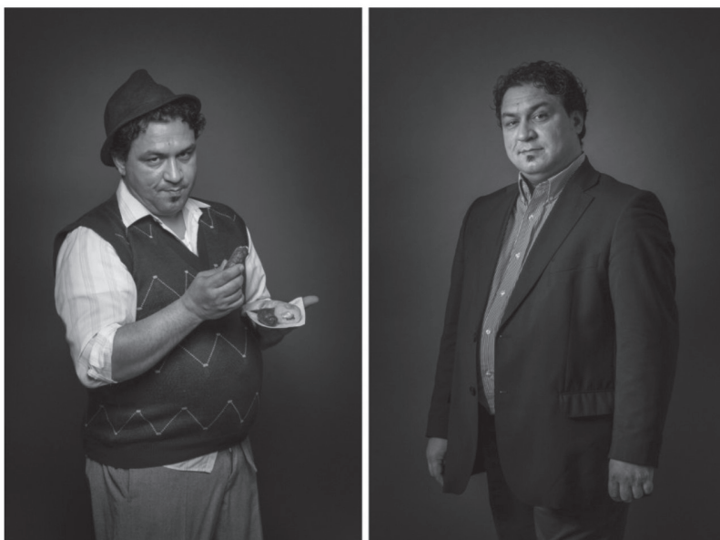
“A disznót vágó, barbár cigány” – Dr. Marius Taba

4. ábra. Fotóportré-sorozat roma személyekről: mint önmaguk és mint egy sztereotípiát megtestesítői („Roma test I. – Nincs ártatlan kép” című kiállítás a Gallery8-ban, készítette: Déri Miklós)