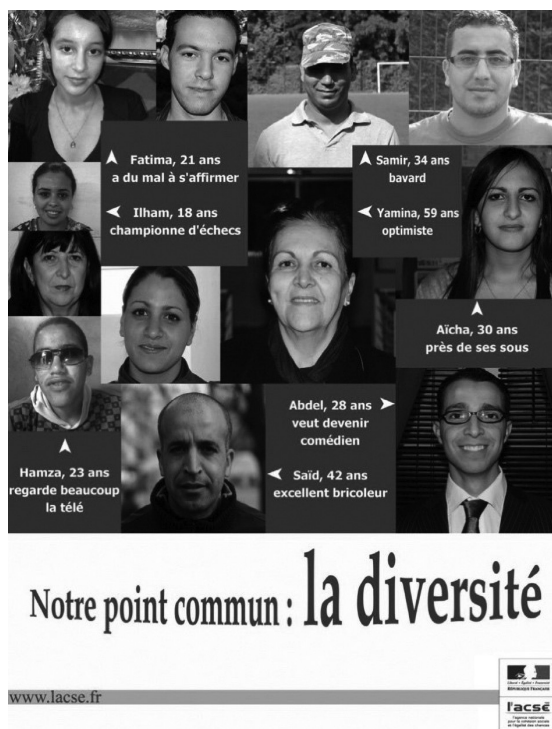
3. ábra. „Közös pontunk: a sokféleség”. Az arabok észlelt variabilitásának növelését megcélzó franciaországi plakátintervenció (Er-Rafiy és Brauer, 2013, 843. oldal, 1. ábra)

A résztvevők nagyobb mértékben fejezték ki azt a szándékukat, hogy önkénteskednének vagy petíciót írnának alá az arabokkal szembeni diszkrimináció csökkentéséért.