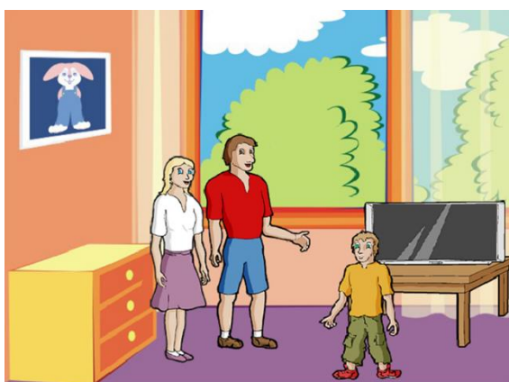
3. ábra: „Élménybeszámoló” Lapoda Mesében szerkesztve (saját ábra)