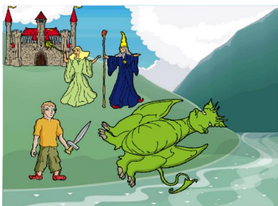
2. ábra: „Az én mesém” Lapoda Mesében szerkesztve (saját ábra)