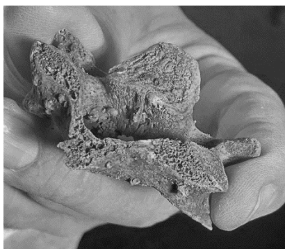
6. ábra: A gerincevelőt hátulról átszelő vágás nyoma nyakcsigolyán.

Fig. 6: Peri mortem cut wound on a cervical vertebrae. The cut hacked across the cervical spinal cord from behind