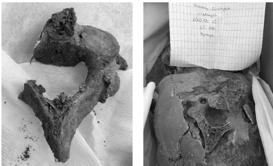
8. ábra: Kétszer hátulról átvágott második nyakcsigolya (fotó: Pálfi György).

meg. A feltárás első heteiben a tömegsírnak olyan részein dolgoztunk, ahol a kiemelt csontvázak között aránylag több volt az ifjú korú áldozat maradványa. Ez megerősítette a K. Zoffmann Zsuzsanna „Az 1526-os mohácsi csata 1976-ban feltárt tömegsírainak embertani vizsgálata” című tanulmányában megfogalmazott feltételezést: bizonyos elsöre is látható fejsérülések, és aránylag jelentős számú fiatal (hátrahagyott apródok, szolgálók?) alapján az itt elföldeltek nagyobb valószínűséggel a törökök által lekaszaboló „magyar szekértábor” áldozatai lehetnek. Papp László már 1960-ban felvetette a „tábor-teóriát” – a csatára utaló régészeti leletek (fegyver-, páncéltöredékek, lövedékek, patkók stb.) hiánya miatt (Papp 1960, K. Zoffmann 1982). Létezik azonban egy harmadik, korábban háttérbe szorult opció is: a csata utáni tömeges kivégzés, amelynek emlékét mind a magyar, mind a török források megőrizték (Papp 1962). Mind Brodarics krónikájában (Brodarics 1983), mind a török nyelvű korabeli leírásokban egyértelmű utalás van arra, hogy Szulejmán szultán nem engedélyezte a hadifoglyok megtartását, és a csata harmadnapján (1526. augusztus 31-én) tartott győzelmi díván alkalmával kétezer körüli hadifoglyot kivégeztetett.