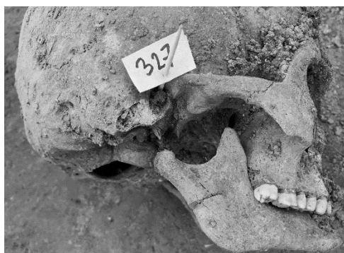
7. ábra: A nyaki gerinc hátulról történő átvágásáról árulkodó vágásnyom állcsonton.

Fig. 6: Peri mortem cut wound on a cervical vertebrae. The cut hacked across the cervical spinal cord from behind