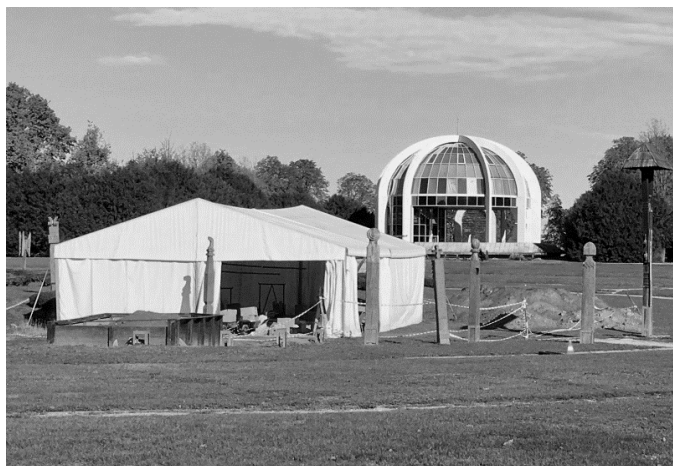
1. ábra: A Mohácsi Nemzeti Történelmi Emlékhely és a III. sz. tömegsír-feltárás helyszíne (fotó: Pálfi György).

a Magyar Természettudományi Múzeum Embertani Tára azonban humán erőforrás problémák miatt nem tudott antropológust biztosítani a terepantropológiai munkálatokhoz. Az Ásatási Bizottság képviselője a helyzet megmentésére hívta a szegedi Embertani Tanszékot, mint a jelenleg legtöbb antropológussal rendelkező és terepi antropológiai munkákban is kompetens hazai egységet. A Janus Pannonius Múzeum akkori vezetője – nem ismerve a feladat tényleges dimenzióit – egy antropológust kért várhatóan egy hónap időtartamra ... A munka idejét és hosszát nyilvánvalóan alábecsülték, mint ahogy később (pl. 2021 nyarán) mi magunk is ebbe a hibába estünk. Magyarországon ilyen volumenű és típusú tömegsír régészeti és antropológiai feltárására és az embertani anyag teljeskörű, szakszerű felszedésére a mai napig nem volt példa.