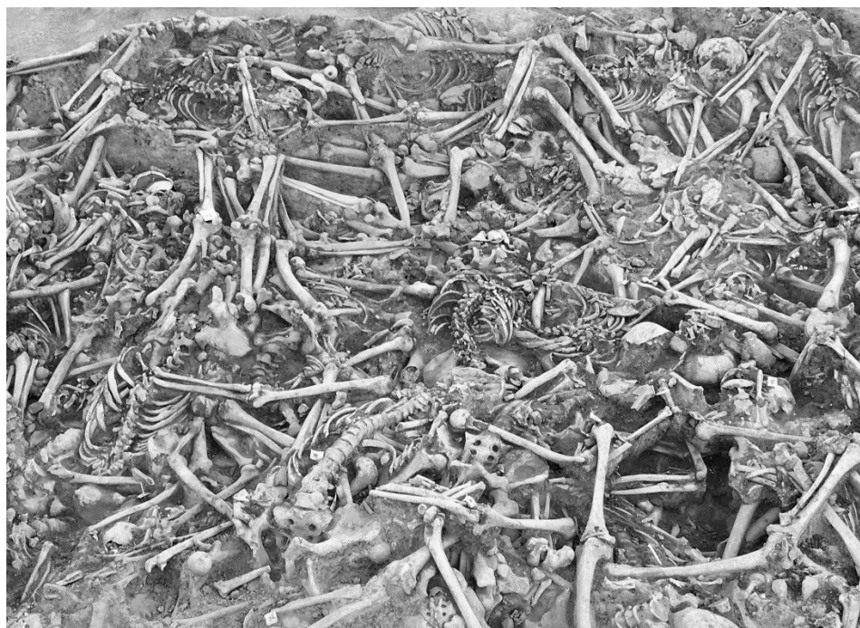
3. ábra: A mohácsi 3. sz. tömegsír csontvázai a 2020-as feltárás elején. Fig. 3: Skeletons of the Mass Grave No 3 at the beginning of the excavation.