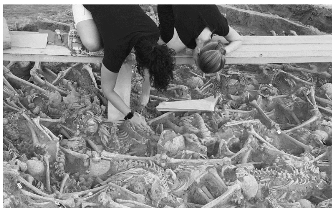
2. ábra: Az SZTE Embertani Tanszék doktoranduszai a feltárás első napján.

Fig. 1: The National Historical Memorial Park of Mohács and the localization of the Mass Grave No 3 excavation.