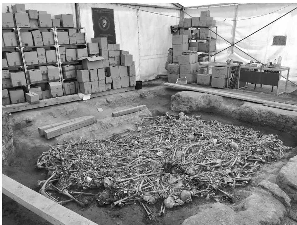
10. ábra: A mintegy 75–80%-ban feltárt III. sz. tömegsír a feltárási második szakasza végén

Előzetes terveink alapján – amennyiben a nyári időszakra a gödörben maradt 150 körüli csontváz fajlagos feltárási időigénye megközelítően megegyezett volna a 2020 őszi első fázis feltárási idejével, a csata 495. születésnapját már üres tömegsír-gödörnél köszöntöttük volna. Itt azonban mi is alábecsültük a feladat nehézségét, komplexitását: az alsó rétegek nagyon töredékes, nagyon kevert anyagon és extrém sok megkezdett vázzal dolgozó feltárása során 1–1 váz teljes feltárása a felső rétegek csontváz-felszedési idejének sokszorosát, akár 5–6-szorosát igényelte. 2021. augusztus 29. után további 5 héttel tudtuk meghosszabbítani a 2021-es második feltárási ciklust (heti átlag 5 antropológussal). 2021. október elsejére, a második szakaszban a 2020 őszihez képest több mint kétszeres munkaidő-ráfordítással, és a két fázisban immár több mint ötezer antropológus munkaidőráfordítással tudtuk elérni, hogy a 2021-es téliésítés az eredeti csontváz tömeg csak mintegy 20–25 százalékát találja a III. tömegsír gödrének alján (10. ábra). A néhány tucat megkezdetlen csontvázat és legalább 50–70 megkezdett vázat tartalmazó alsó 20–25% feltáráshoz és dokumentálásához előzetes becsléseink szerint várhatóan 2,5–3 hónapra lesz szükség 2022-ben.