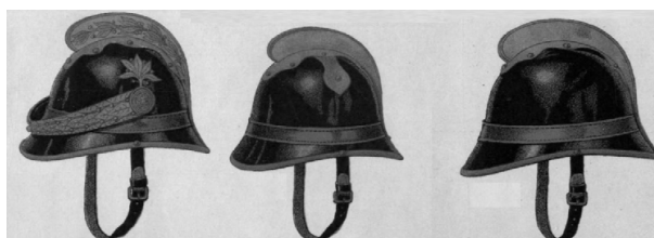
parancsnoki szakasz-parancsnoki / tisztviselői alparancsnoki