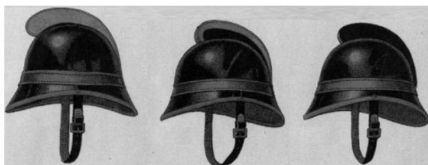
legénységi rajvezetői / őrvezetői őrparancsnoki

Forrás ! A Magyar Országos Tűzoltó Szövetség által a magyarországi tűzoltó-testületek számára megállapított szervezeti, egyenruházati, rangjelzési és felszerelési szabályzat. Budapest, 1898, Magyar Országos Tűzoltó Szövetség. 27 p.