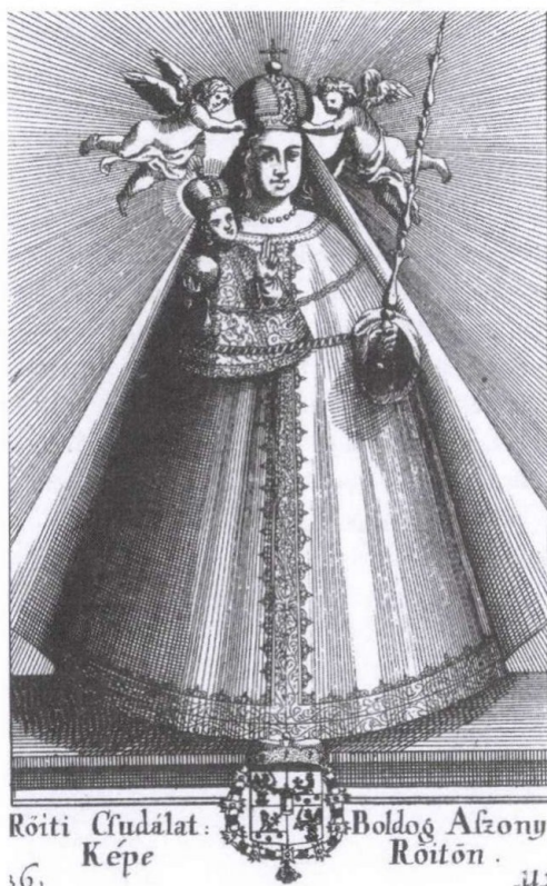
5. kép: Matthias Greischer: A röjti Boldogasszony (Esterházy Pál: Az egész világon lévő csudálatos boldogságos szűz képeinek rövideden föltett eredeti. Nagyszombat 1690. Nr. 36.)

A kegyképen, ahogy szokásos, Mária fejét egy fémkorona díszíti. Ugyancsak Esterházy Pál adományozta a Boldogasszony „státua”-t, jobb karján az áldást osztó Kisjézussal, a fából faragott kegyszobor ma is a déli és északi templomcsarnokok közös falán lévő mélyedésben áll (5. kép). 49