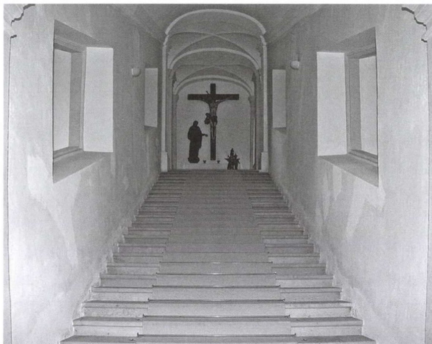
3. kép: A Szent lépcső a fraknói szervita kolostorban

A herceg a kolostort és annak vezetését Ádám fiának szánta (4. kép), ezt a végrendeletében is megfogalmazta: