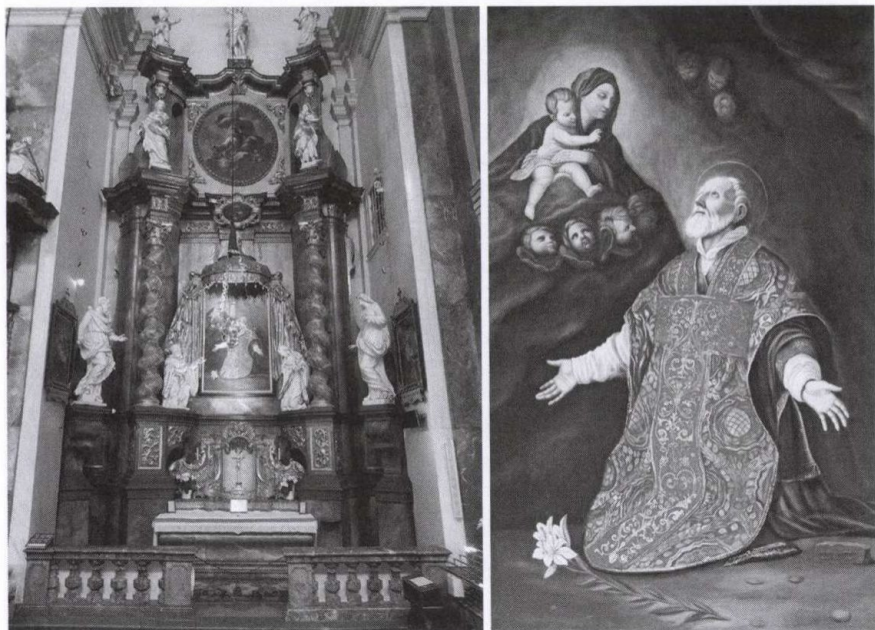
6. kép: A bécsi St. Rochus und Sebastian templom Néri Szent Fülöp oltára

A pestis miatt a családjáért, városáért és népeiért aggódó császár által teremtett térben hangsúlyosan van jelen az Esterházy Pál alapította oltár, amely harmonikusan kapcsolja össze a Habsburgok Mária-tiszteletét és pestis elleni küzdelmét a sajátjával. A hercegnek más mecénási tevékenysége is kötődött Bécshez: a Mariahilf-templomnak és a főoltárának szintén ő volt a mecénása. 52