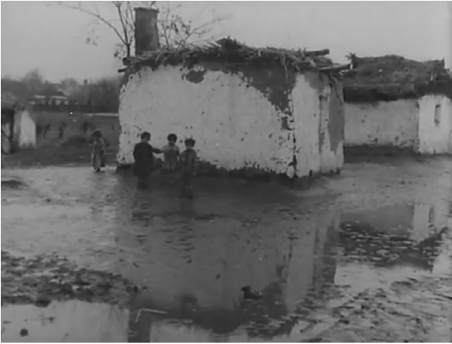
Abb. 6. Screenshot aus Die Zigeuner .