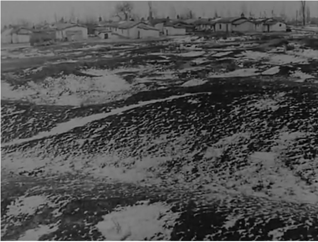
Abb. 5. Screenshot aus Die Zigeuner .

heute – unsichtbar auf den Genozid an den Roma verweist. Langsam erscheint eine Roma-Siedlung ( Abb. 5 ), während jemand im Hintergrund ein Lied auf Romanes mit ungarischen Untertiteln zu singen beginnt: