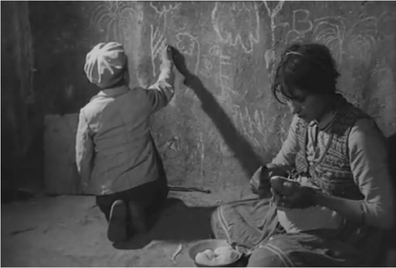
Abb. 1. Screenshot aus Die Zigeuner . Regisseur: Sándor Sára, 1960.

sehen. Diese Titel sollten nicht nur die Aufmerksamkeit des Zuschauers erregen, sondern harmonisierten auch mit den Slogans des offiziellen Diskurses. Die im Film gezeigten sozialdokumentarischen Fotografien lassen hingegen darauf schließen, dass sich die Situation der Roma im sozialistischen Ungarn im Grunde genommen nicht verbessert hatte. Der Film sucht so einen Ausgleich zwischen der Anpassung an den zeitgenössischen politischen Diskurs und der Fokussierung auf die prekäre Lage der Roma. Am Ende gerät diese Balance jedoch aus dem Gleichgewicht: Die Schlusszene ( Abb. 1 ) zeigt eine Frau, die Kartoffeln schält, und einen Jungen, der mit Kreide Buchstaben an die Hauswand zeichnet. In dieser Szene stehen eindeutig die Armut, die soziale Distanz und hoffnungslose Zukunft der Abgebildeten im Vordergrund. Damit positioniert der Film die Roma als passive Opfer – entgegen ihrer Darstellung in der staatskommunistischen Propaganda.