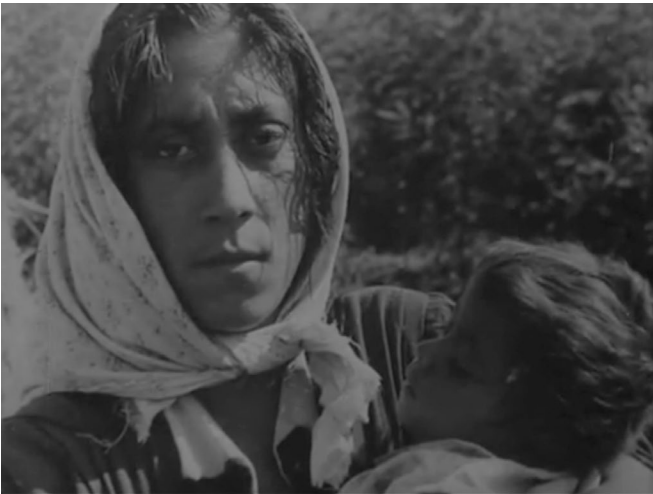
Abb. 3. Screenshot aus Die Zigeuner .