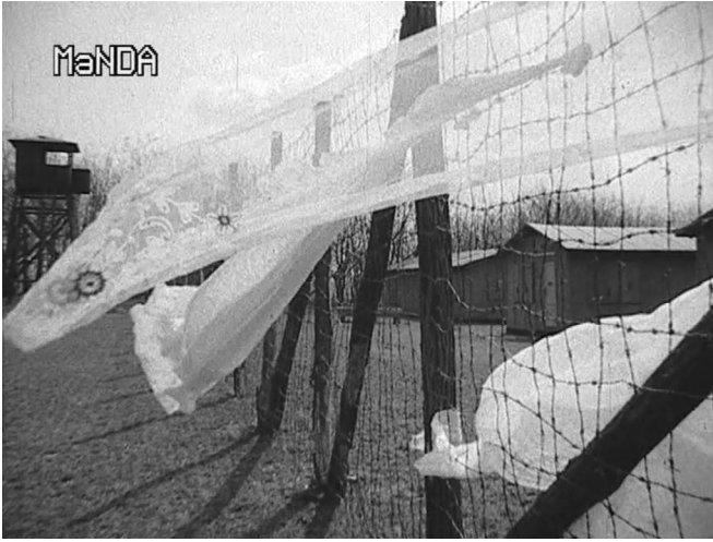
Abb. 8. Screenshot aus Vergessene Tote .

noch eine Steigerung erfährt. Plötzlich befindet sich der Betrachter auf einer Wiese, ein Stacheldrahtzaun wird eingeblendet ( Abb. 8 ), und der Erzähler beginnt, das „Optisch-Unbewusste“, das bei Sára noch stumm geblieben war, mit der Erfahrung der Zeit und damit der Geschichte zu verbinden.