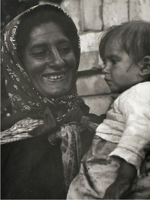
Abb. 2. Kata Kálmán: Zigeunermutter II, 1937.