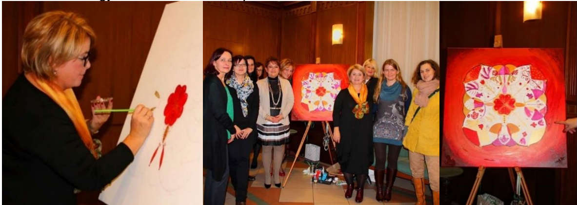
4. kép: A közös festés folyamata és eredménye [21]

A Bács-Kiskun Megyei Kereskedelmi és Iparkamarában közös festés: 2015 - Adventi Teadélután.