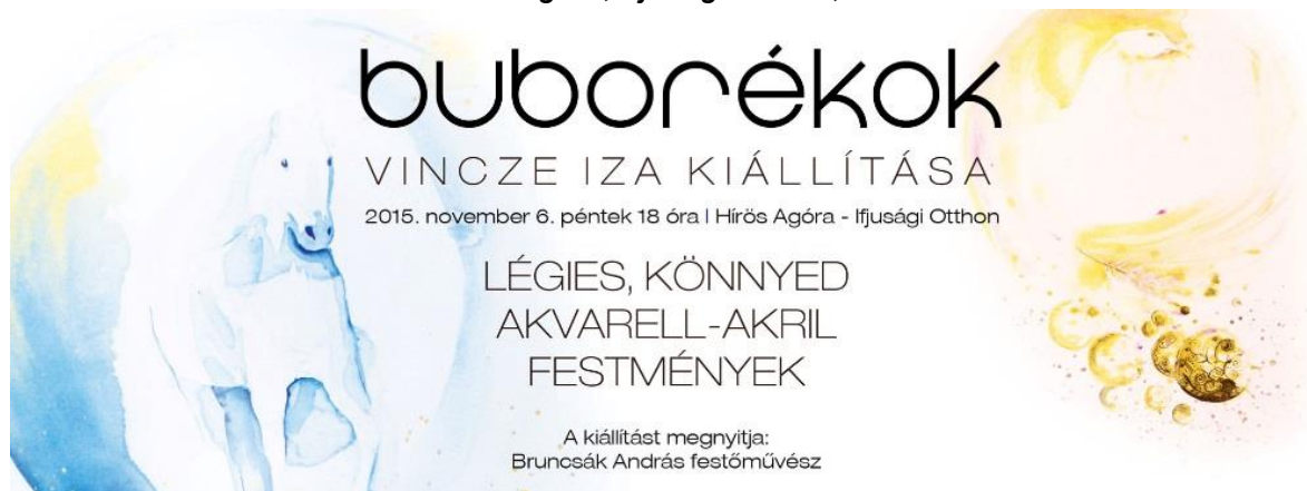
11. kép: Kiállítás online reklám [30]

2015 Buborékok – kiállítás – Hírös Agóra, Ifjúsági Otthon, Kecskemét