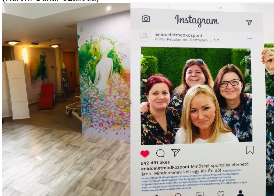
14. kép(-sorozat): Énidő Életmódközpont belső enteriőr és a megnyitó hangulatképe [33]