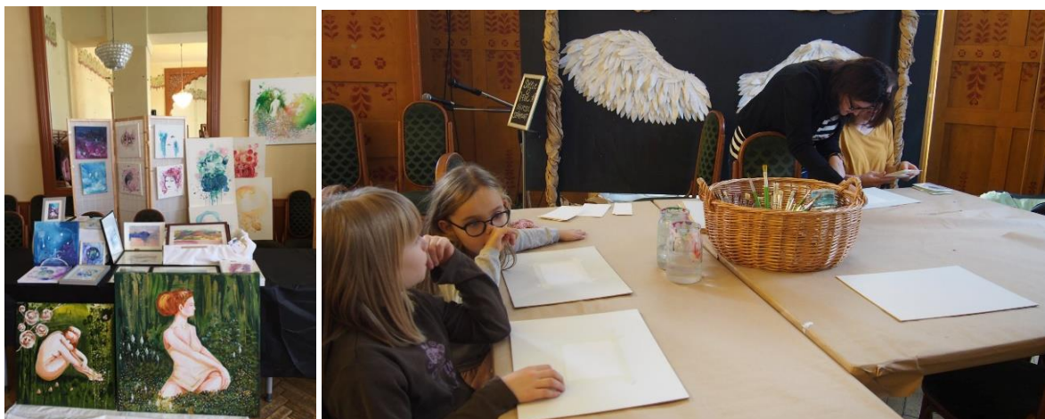
15. kép(-sorozat): Eseményfotók az „Artplacc” karácsonyi vásárról [34]

A.) 2018-tól: a Hírös Agóra Ifjúsági Otthonban, „Artplacc” karácsonyi vásár és karácsonyi képeslapfestő workshop gyerekekkel