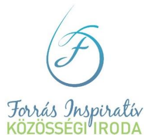
5. kép: Logó [23]