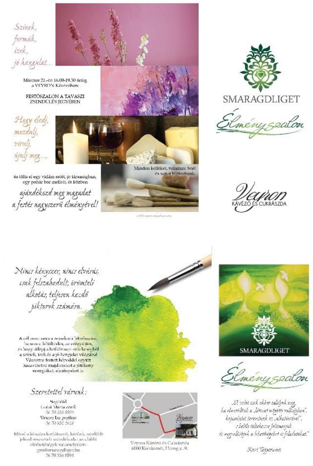
17. kép(-sorozat): Smaragdliget Élményszalon reklám [37]