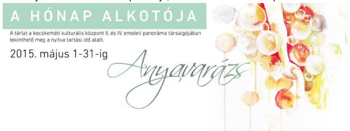
12. kép: Kiállítás online reklám [31]

2015 Anyavarázs tárlat – A hónap alkotója, Kecskeméti Kulturális Központ