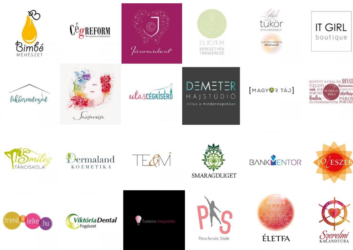
6. kép: Logók kecskeméti vállalkozásoknak [24]

Dentál (fogorvos), Tudatos Megoldás (Pénzügyi tanácsadó), PAS (edzőterem), Életfa (magyar gyökerű programok szervezése), Szerelmi Kalandtúra Kecskemét.