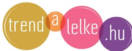
2. kép: Trendalelke logó [18]

A Trendalelke mottója: „Kecskeméti nőnek lenni jó! Praktikus, letesztelt infók, a legjobb programok, elismert helyi szakértők, kecskeméti nők, akikre büszkék lehetünk.”