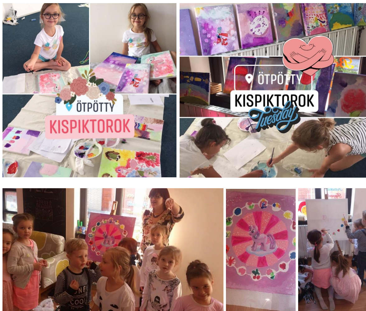
16. kép(-sorozat): Festőtábor és ArtParty [36]