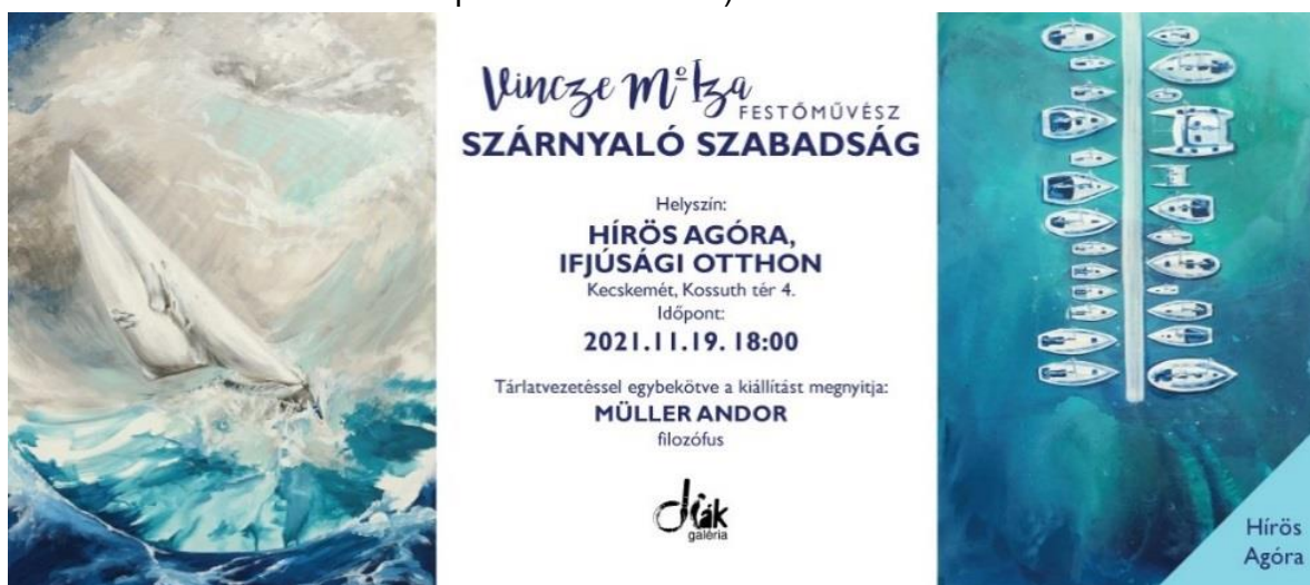
9. kép: Kiállítás online reklám [28]

2021. decemberében az Ifjúsági Otthonban: Szárnyaló Szabadság címmel (a tihanyi kiállítás 2 sorozatának és fő képének bemutatása)