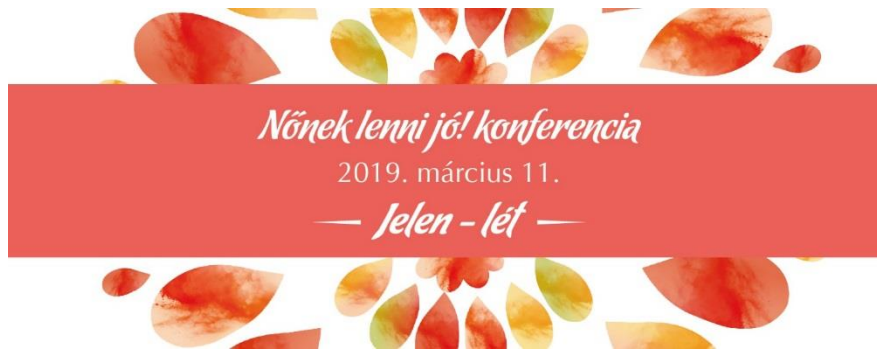
3. kép: Nőnek lenni jó! - konferencia online reklám [20]

A Bács-Kiskun Megyei Kereskedelmi és Iparkamarában közös festés: 2015 - Adventi Teadélután.