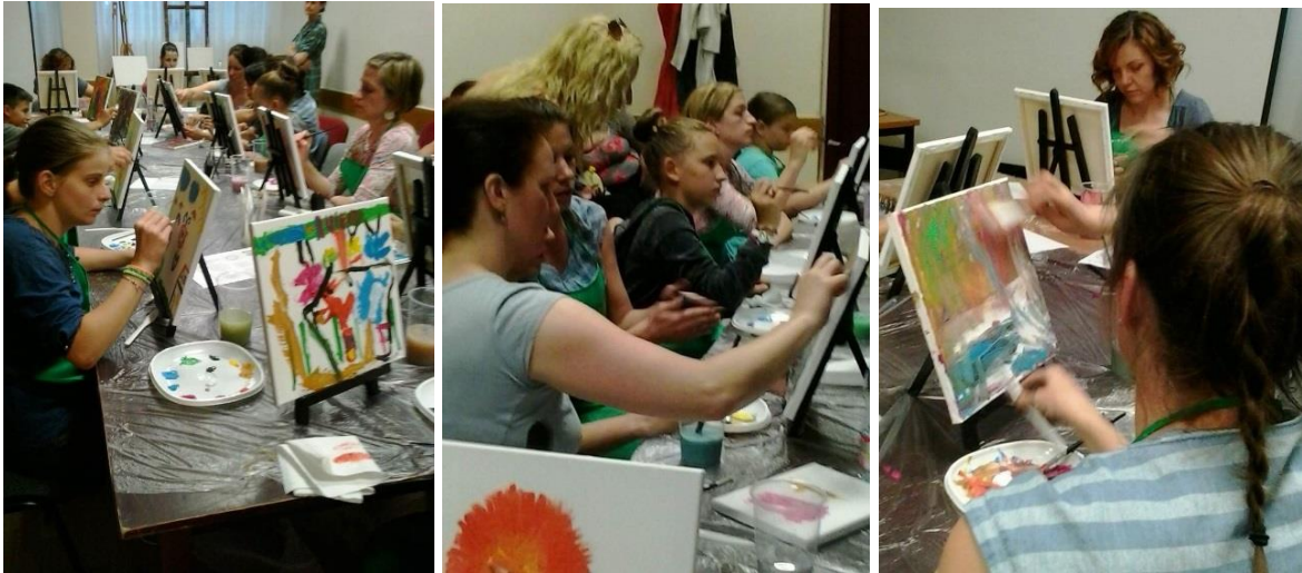
18. kép(-sorozat): Múzeumok Éjszakája eseményfotók [38]