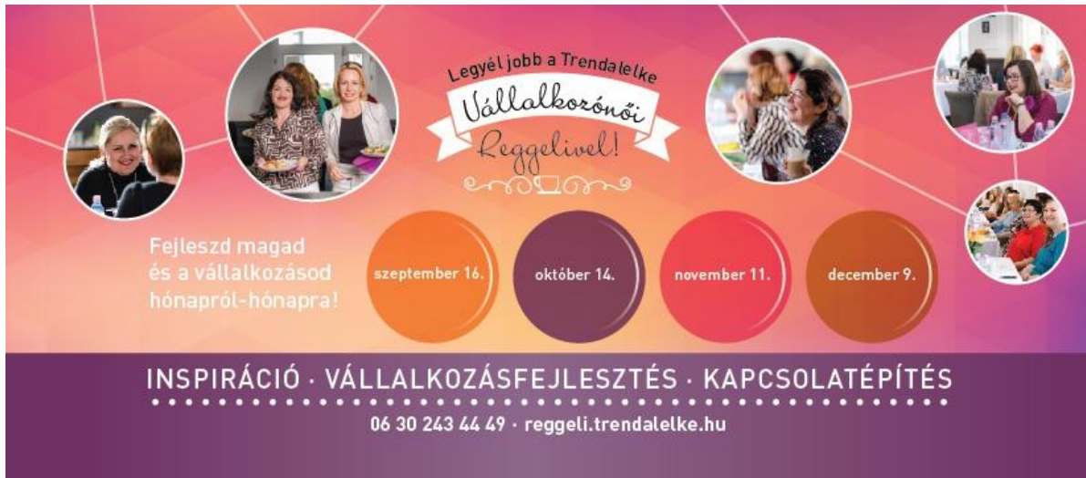
1. kép: Trendalelke Vállalkozónői Reggeli online reklám [17]