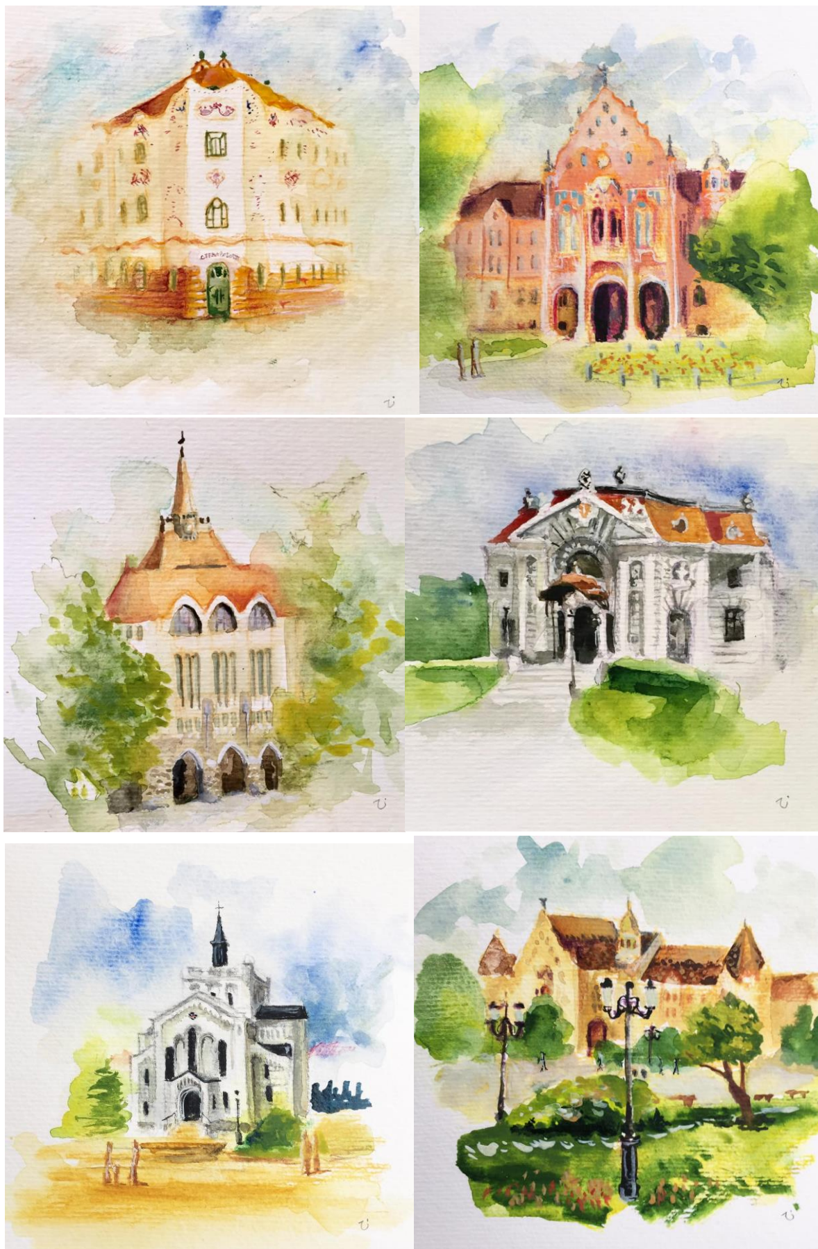
8. kép(-sorozat): Miniatúrák kecskeméti nevezetességekről [27]