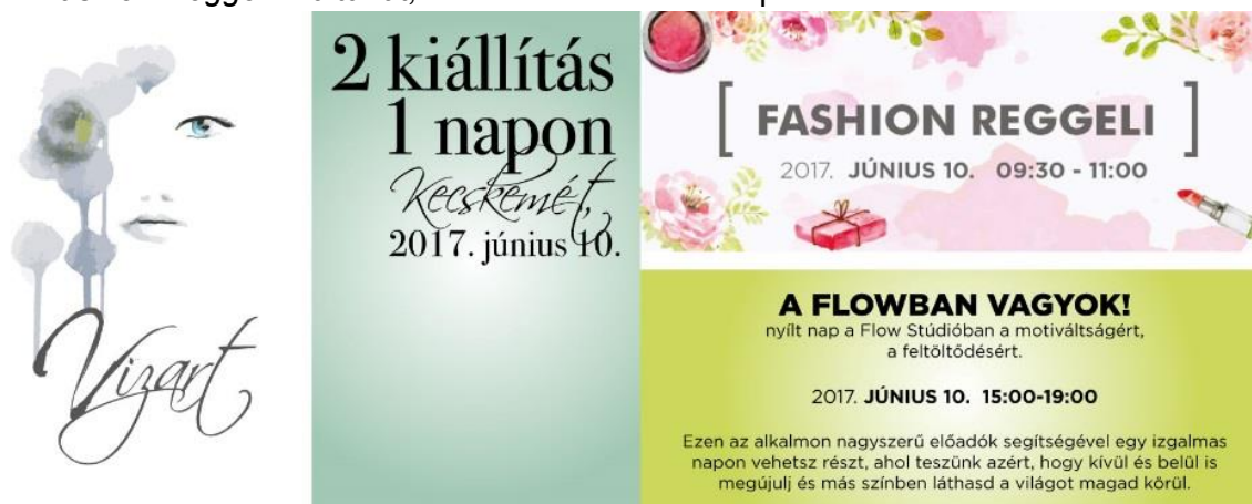
10. kép: Kiállítás online reklám [29]

2017 Fashion Reggeli 2.0 tárlat , Kecskemét Malom Központ