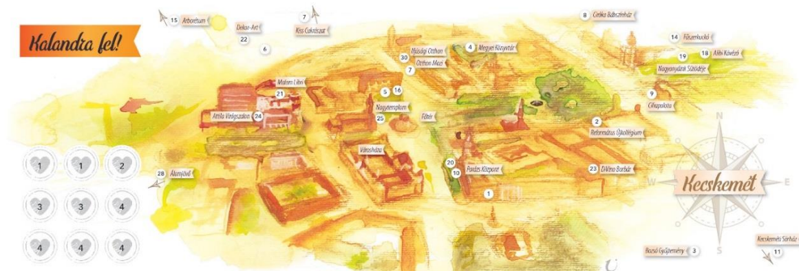
7. kép: Szerelmi Kalandtúra Kecskemét látkép-térképe [26]