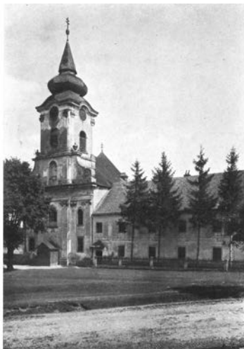
Abb. 325. Stotzing, Servitenkirche und Kloster (S. 299).