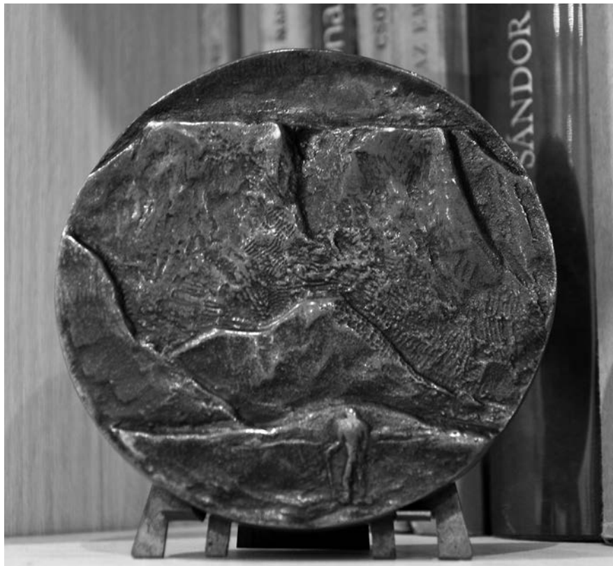
5. Ferenczy Béni alkotása Wilde Richardról, hátlap © Kahler Ilona Márta

A hátlapján egy vándorlegény van, ahogy indul a hegyekből a nagyvilágba, nagyon szép megfogalmazás a vándor művésziparosok akkori működéséről, akiknek be kellett járniuk Európát, hogy mesterek legyenek, mint az én dédapám is tette, Stadler Sámuel. Ez az érem benne is van minden komolyabb Ferenczy Béni katalógusban. A mai napig megvan nálam, egy csodálatosan barna patinázott érem. A kisplasztikáit is végignéztük és gyönyörködtem bennük, különleges dolog volt.