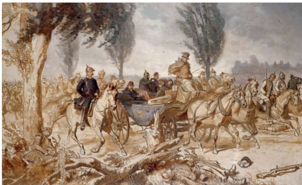
9. ábra: Wilhelm Camphausen: Bismarck és III. Napóleon a sedáni csata után (1874) Figure 9. Wilhelm Camphausen – Bismarck and Napoleon III after the Battle of Sedan, 1874.

Forrás: galerix.org 15 Source: galerix.org 16