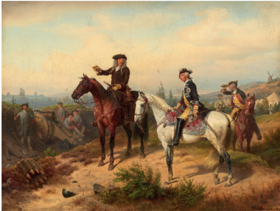
8. ábra: Wilhelm Camphausen: II. Frigyes a frontvonal megfigyelése közben (1864) Figure 8. Wilhelm Camphausen – Friedrich William II of Prussia observing the frontline, 1864

Az 1850-es évek végén és az 1860-as években művészetének indíttatása megváltozott. Már nem csupán a történetiség fogta meg, hanem a német egység gondolata is. Egyre inkább magáévá tette azt a gondolatot, hogy a német területek csak akkor lehetnek hatékonyak, erősek és ellenállóak, hogyha tovább folytatják a porosz utat . A militarizmus, a szigorú fegyelem és a kötelességtudat egyre fontosabb értékekké váltak számára. Művészetének nemzeti tartalmat keresve elsőként Nagy Frigyeset és korának porosz hőseit mutatta be (8. ábra) (Daelen, 1903).