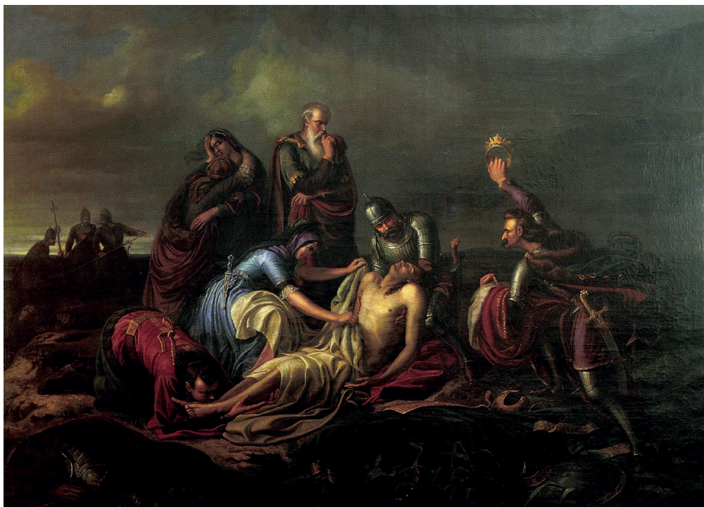
Figure 5. Soma Orlai Petrich – Discovery of the Corpse of King Louis II of Hungary on the battlefield of Mohács, 1851