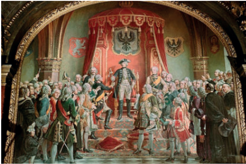
10. ábra: Wilhelm Camphausen: Szilézia hódolata Nagy Frigyes előtt Breslauban, 1741-ben (1882) Figure 10. Wilhelm Camphausen – The tribute of the Silesian estates to Frederick II in Breslau in 1741, 1882