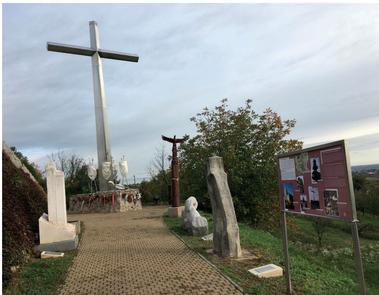
2. ábra: A nagyharsányi szoborpark csataemlékműve Figure 2. The war memorial at the Harsány hill