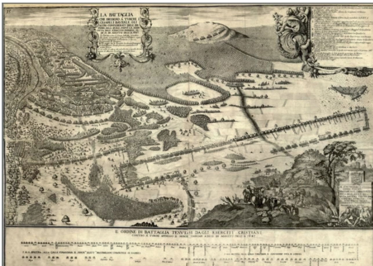
1. ábra: Michael Wening: A nagyharsányi csata (XVII. század) Figure 1. Wening, Michael – Battle of Harsány (17 th century)

Forrás: museumap.hu 3 Source: museumap.hu 4