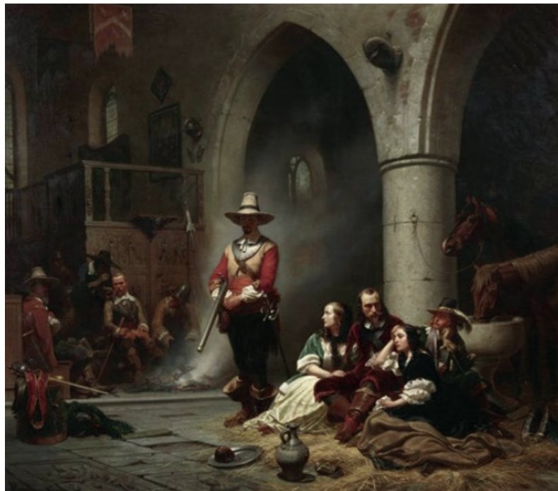
7. ábra: Wilhelm Camphausen: A foglyok (1853) Figure 7. Wilhelm Camphausen – The prisoners, 1853