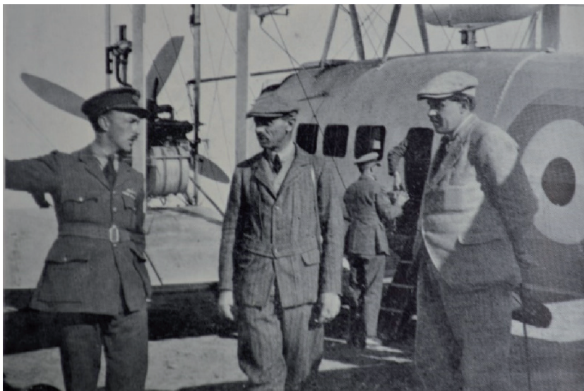
1. kép: Teleki Pál a Moszul-bizottságban a mai Észak-Irakban. Figure 1: Pál Teleki in the Mosul-commission in today's northern Iraq.