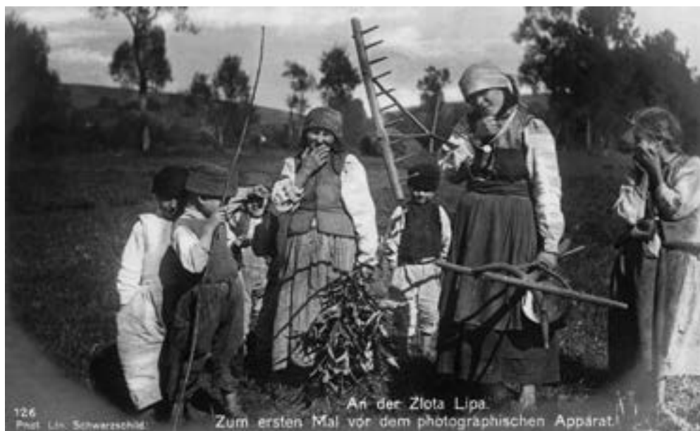
Ruszín parasztok a munkaeszközökkel, 1930-as évek