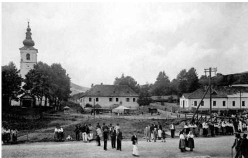
Alsóverecke látképe, 1930-as évek

A közvélemény az akcióban csupán „Rákóczi népének”, a magyarokhoz „ezer éve” hű ruszinoknak megsegítése érdekében indult önzetlen szociálpolitikai kezdeményezést látta, titkos politikai mozzatörugóit már nem. Az 1895 elején megalakult,