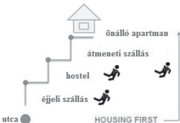
3. ábra Housing First és Staircase Modell összehasonlítása

Az „Első a lakhatás” modell filozófiája szerint a lakhatás alapvető emberi jog, azt nem kell kiérdemelni az egyéni problémák előzetes megoldásával. Az „Első a lakhatás” programok rögtön önálló lakhatás biztosítására törekednek albérteti szerződésekkel, az általános lakáspiachoz való közvetlen hozzáféréssel és az adott lakóközösségbe történő integrációval. Ez a megoldás is lehetőséget nyújt a szakmai támogatásra, terápiára, mégsem teszi ezeket kötelezővé, és főképpen, nem képezi előfeltételét a lakhatásnak.