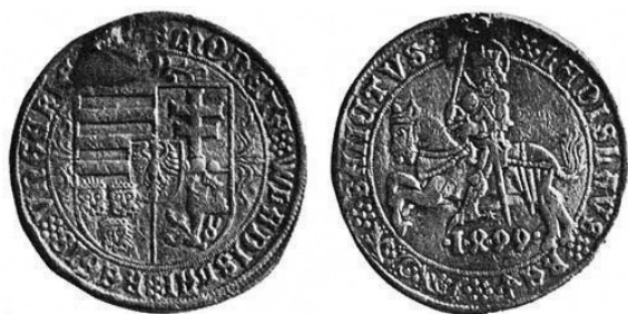
Az első magyar tallér 1499-ből, II. Ulászló pénze (Domanovszky-féle Magyar művelődéstörténet 3. kötetéből)

A következő évekből rengeteg forrás szól az ausztriai tartományok részvételéről a védelem megszervezésében. Aktív hozzájárulásuknak köszönhetően mérséklődött az örökös tartományok támadásának intenzitása, és Ferdinánd főherceg büszkén írta császári bátyjának, hogy „ami a törököket illeti, mióta embereim Horvátországban vannak, semmi rosszat nem tudtak tenni”. 34 Ettől függetlenül nem beszélhetünk az ausztriai rendek kizárólagos áldozatvállalásáról, hiszen a határszéli nemések híreket szállítottak, szervitoraikat fegyverben tartották, és nem utolsósorban az évről-évre megjelenő segélycsapatokat is Horvátország, illetve Szlavónia élmezőnyben. Az ausztriai segítségnyújtás korántsem volt a budai kormányzat ellenére, és 1526-ig joggal beszélhetünk partneri együttműködésről a magyar király által kinevezett bán és az ausztriai segélycsapatokat irányító főkapitány között Horvátország védelmé érdekében. 35