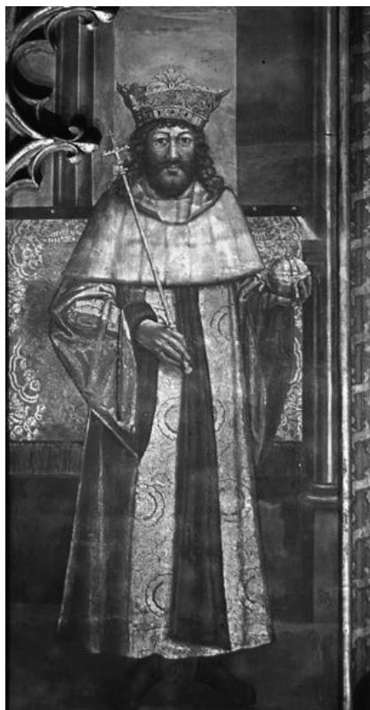
II. Ulászlóról készült freskó a prágai Szent Vitus székesegyházban, 1509

utáni hektikus kilengések után az évtized végére normalizálódott a szlavón nemességnek a báni hatalomhoz és a központi kormányzathoz fűződő viszonya. Az állandósuló katonai nyomás azonban továbbra is feszültséget eredményezett mindkét tartományban.