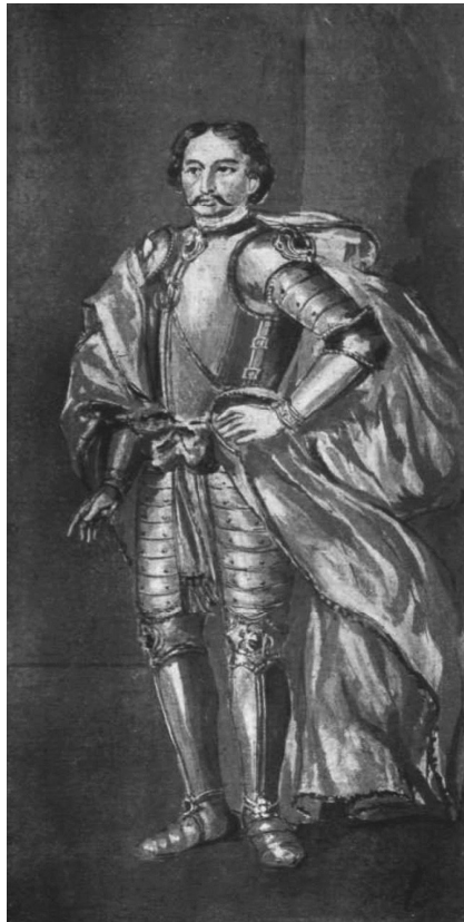
Corvin János (A magyar nemzet története című könyvből)

Mátyás király 1490-ben bekövetkezett halála kimozdította Szlavóniát és Horvátországot az addigi állapotából. A magyar országnagyok ugyanis 1490. június 17-én Corvin Jánosnak ígérték a bosnyák királyi cím mellé Szlavóniát, mintegy dukátusként, és élete végéig a horvát-dalmát báni tisztséget a királyságról való lemondásért cserébe. 13 A feltételeket a csontmezei vereség után a herceg, július 31-én pedig az országba érkező Ulászló is elfogadta. A középkori dukátus intézményének a felélesztését azonban sem a horvát, sem a szlavón rendek nem fogadták kitörő örömmel, és már a szeptember 18-ai koronázás alkalmával is tiltakoztak a döntés ellen. Az új uralkodó a béke érdekében azonban nem rúgta fel a Corvinnal kötött megállapodást, így ő ezekben az évek-