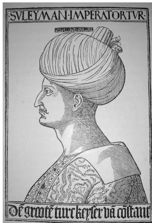
Szulejmán (A magyar nemzet története című könyvből)

Az ország konszolidációjának a részeként Habsburg Mária királyné 1524 elején elérte, hogy férje kinevezze kedvelt hívét, Tahy Jánost Korbáviai mellé szlavón bánnak. 39 Utóbbi ezt meglehetősen