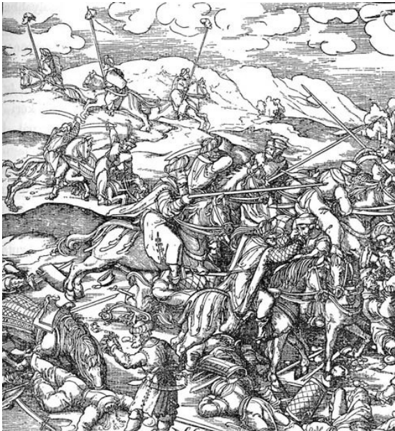
Csata a törökkel Horvátországban (A magyar nemzet története című könyvből)

tuk, kivéve az erdélyi vajdát, a temesvári grófot és a horvát bánt, úgyannyira, hogy Modrustól egészen Zágrábig nem találni sem egy várat, sem egy várost, mert a törökök minden tönkretettek, s az a szegény nép, amely ott maradt, az erdőben húzódott meg, úgyhogy amikor ezek néha valami lovas látnak arrafelé elhaladni, gyanakszanak, nem török-e az illető, s az erdőbe menekülnek előle, úgyhogy ha valaki errefelé akar utazni, kell, hogy magával vigyen élelmet, mert errefelé ennivalót nem lehet kapni. S ebben az időben, amíg ő Magyarországon követezkedett, Bosznia és Szerbia, azaz Rácország közötti területen a török 23 várat foglalt el; a határon csak Jajcza maradt meg, amely megerősített helység. És a jelenben, minthogy a töröknek nincsen rabolni valójuk, nem portyáznak már azokon a horvátországi helyeken, hanem Szlavóniába kalandoznak Zágráb kapujáig”. 26