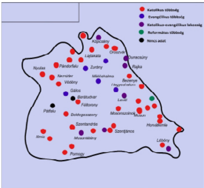
2. térkép: Moson vármegye felekezeti állapota 1713-ban 75

ahol mindhárom felekezet alsófokú iskolát tartott fent, 1680-ban két katolikus iskolamestert találunk. 72 Nezsider és Lajtakáta települések esetén hasonló, felekezeti egységesülést tapasztalhatunk. 73 A vármegye protestáns felekezetű lakossága számára még az sem jelentett biztos megmaradást, amennyiben jelentős, félezres csoportot alkottak. A köpcsényi protestáns közösség 1713-ban még 600 főt számlált, 1828-ban már egy protestáns sem élt a településen. A helyi evangélikus lakosság helyét a betelepülő zsidóság foglalta el. 74