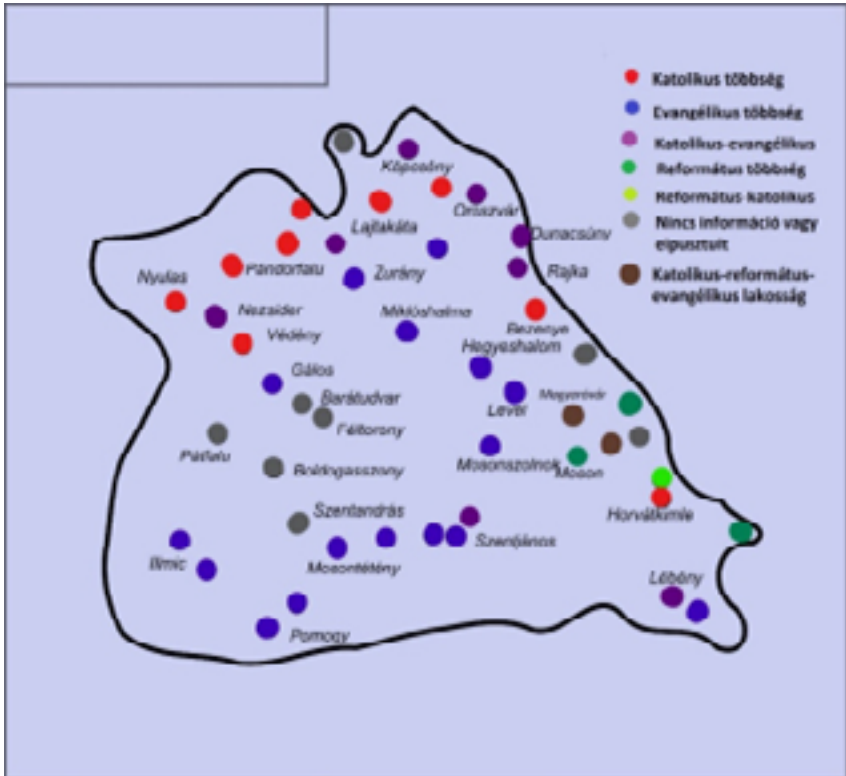
1. térkép: Moson vármegye felekezeti állapota 1659-ben 70

(1681. évi XXV. és XXVI. tv.; Explanatio Leopoldina) és lokális (1682. évi 56. Moson vármegyei közgyűlési határozat) szinteken, ketős szorításba vonva a megmaradt protestáns lakosságot. A földesurak részéről legfeljebb protestáns jobbágyaik megtérése érzékelhető, igaz, eltérő mértékben. Míg a Habsburgok kezén lévő óvári uradalom eltúrta a vármegye közepén egy tömbben élő lutheránus népeiséget, azzal egy időben Esterházy Pál reverzálist csikart ki a Fertő mellett élő jobbágyaitól.