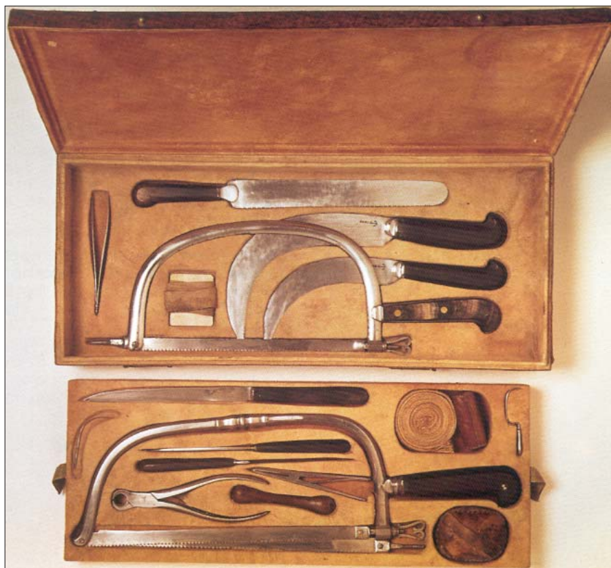
Műszerdoboz, XVIII. század

A dobozok készülhettek más anyagból is, például a XVII. és XVIII. századi finom bőr- vagy halbőr fedelű dobozok az ezüst- vagy fémműszerek részére, vagy a divatos, elegáns formájú és a felsőkabátban hordható bőr-, elefántcsont, teknőc- és ezüstdobozok. A XX. században a nikkelfémbe áztatott rozsdamentes fémdobozok jöttek divatba, majd a modern plasztik- és műbőr