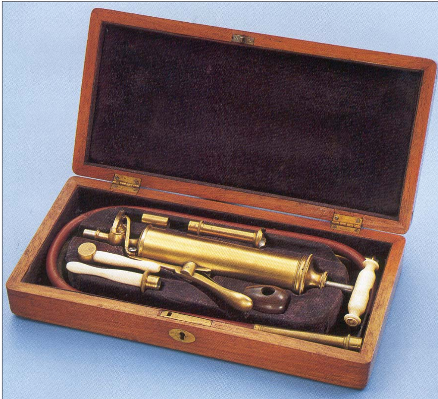
Elefáncsont nyelű műszerek, XVIII. század