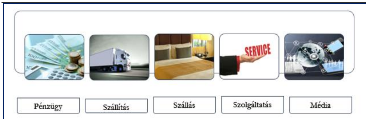
2. ábra. A sharing economy leggyakoribb megjelenése

A sharing economy modellben működő vállalkozások elképesztő mértékű növekedést produkáltak az elmúlt fél évtizedben világszerte (3. ábra). Ez egyben kihívást támaszt a meglévő üzleti modellekkel szemben, ellenben igazolja az üzleti modell innovációbeli létjogosultságát. A rohamosan növekvő közösségi modellek nem csupán a hagyományos modellek számára jelentenek komoly kihívást, de a törvényalkotás és az adóhatóságok munkájára is hatással vannak. Szakemberek véleménye szerint a magánszemélyek egymás közti szolgáltatáskereskedelmére nehezen alkalmazhatóak a hatályban lévő adójogszabályok. Az új üzleti modellben a kereslet és kínálat közvetítése sokkal egyszerűbb, transzparensabb, gyorsabb és egy időben globális mértékű. Decentralizált szervezeti forma jellemzi a legtöbb ilyen vállalatot. A sharing economy formájában megvalósított világméretű beruházások növekedését az alábbi ábra jól szemlélteti.