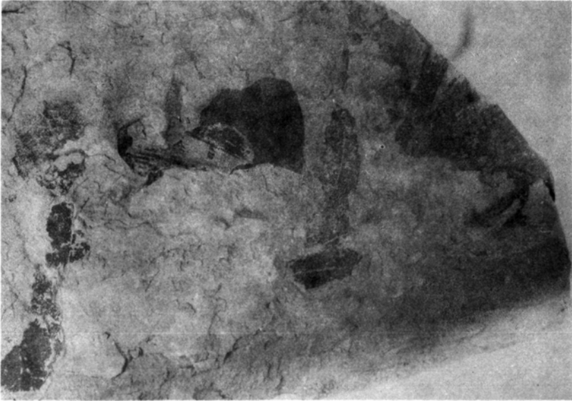
1. kép: Ginkgo adiantoides (UNGER) HEER - (BK-4476)