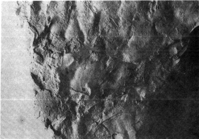
2. kép: Ginkgo adiantoides (UNGER) HEER - (BK-4478)