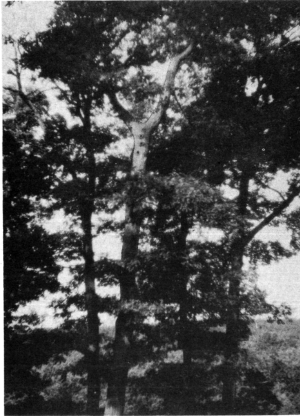
1. kép: A sarlósfecskék ( Apus apus ) mátrai költőhelye.