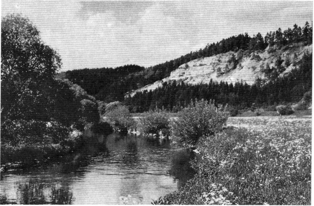
Das Verra Tal bei Leutersdorf