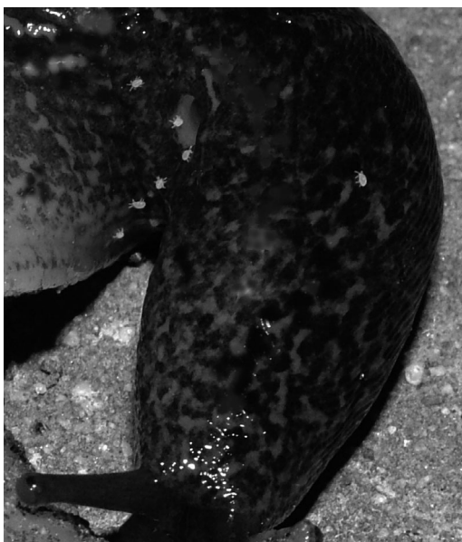
1. ábra: Csiga atkák a Limax maximus légzőnyílása körül

Riccardoella oudemansi elsődlegesen európai elterjedésű faj, de az utóbbi időben Dél Afrikában is megtalálták (UECKERMANN & TIEDT 2003). Ez a gyors mozgású csiga atka a kü-lönféle szárazföldi puhatestűek köpenyüregében és a testének felszínén fordul elő (1. ábra). Hazánkban a meztelencsigák kutatása eléggé elhanyagolt terület, így nem is lehet azon cso-dálkozni, hogy ezek a világos színű apró állatok elkerülték a hazai gyűjtők figyelmét. Ezt a fajt eddig az alábbi csigákon találták meg: Limax maximus , Deroceras reticulatum , Limax flavus , Limax cinereoniger , Arion rufus , Arion ater , Tandonia budapestensis , Oxychilus dra-panaudi , Caepa nemoralis , Acahtina schweinfurthi semifusca (FAIN & GOETHEM 1986).