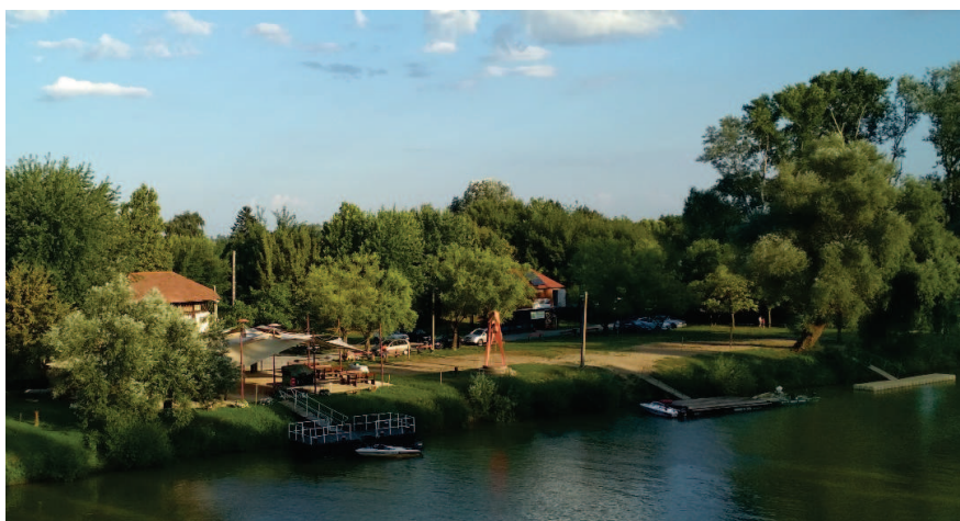
8. ábra: A sárospataki kikötő és a lábasház

Sárospatak évtizedek óta igyekszik kihasználni a Bodrog kínálta lehetőségeket mint a turisták, mind a lakosság számára. Amíg a folyó tisztasága fürdésre is alkalmassá tette, kibójázott szabadstrand működött a várral szemközti oldalon. Régóta működik a híd lábánál az un. lábasház, ebben vízesblokkot alakítottak ki, s nyáron elsősorban a fiatalság hétfégi szabadtéri szórakozóhelyeként funkcionál.