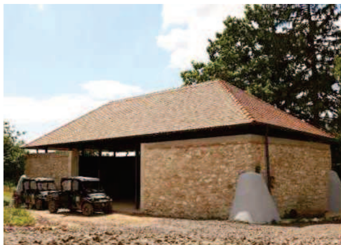
3. ábra: A Ciróka pihenőpark tájbaillő épülete

A tengerszem a gyalogosok és kerékpárosok számára térköves úton, a gépkocsik részére pedig tömörített, burkolat nélküli kőterítéses úton közelíthető meg a parkolóval kialakított Ciróka pihenőig, innen gyalogos ösvényen juthatunk fel a tengerszemhez.