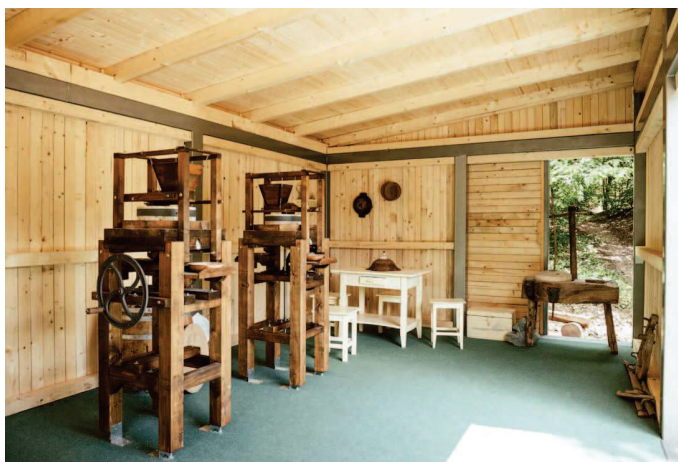
6. ábra: Kézi hajtású malomköves örlők az örlőműhelyben

A tengersizem meglátogatásakor kipróbálhatjuk az örlőműhelyben a kézi hajtású malmot, amely betekintést ad a gabonaszemek malomkövek közötti darálásába, lisztté őrlésébe: