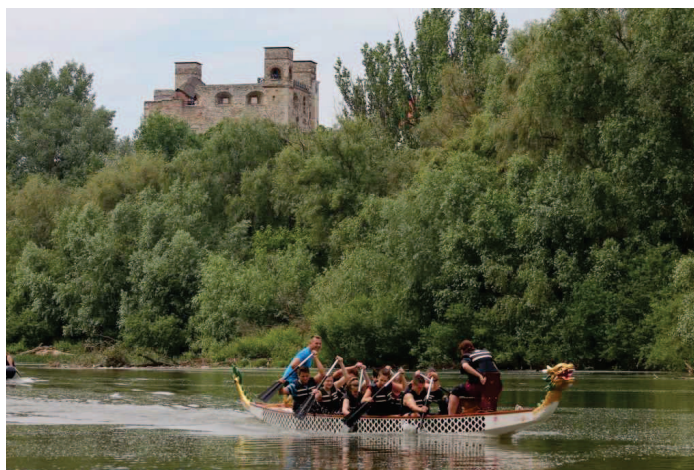
1. ábra: Sárkányhajózás a Bodrogon

Sárospatakat a Bodrog folyó szeli át, ami Magyarország leglassabb folyója. Nagyon kedvező ez az idelátogatóknak, akik szeretnek a természetes vízen eltölteni egy, akár több órát! Csapatépítést, osztálykirándulást, baráti összejövetelt felejthetlenné lehet tenni, ha együtt evez a csapat a vízen!