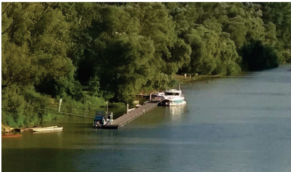
9. ábra: Nyaralóhajó a sárospataki mólónál

A Bodrogon a nyaralóhajózás tavalyi elindulásával új szintre lépett a pataki turisztikai élet. Ez a program a világ minden pontján célzottan a tehetősebb turistákat célozza meg. Egy-egy nyaralóhajó bérlete a minőségi kikapcsolódást kedvelők számára igazi lehetőség, ez viszont azt is jelenti, hogy az érkező turisták, akik miután kikötöttek, Sárospatakon is szolgáltatásokat vesznek igénybe az itt kikötők, tartózkodók. Az éttermek, vendéglátóhelyek és természetesen a Patakot közismertté tevő egyházi, történelmi és épített értékek, múzeumok sokasága számíthat a külföldi turisták megjelenésére.