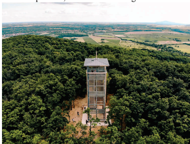
4. ábra: Megyer-hegyi kilátó – Sárospatak

A Megyer-hegy tetején került kialakításra a természetvédelmi szempontokat figyelembe vevő 18 méter magas kilátó, melyből megcsodálhatjuk a 360 fokos panorámát a Zempléni-hegység hegyeire, erdeire, a Keleti-Kárpátokra, valamint a Bodrogközre.