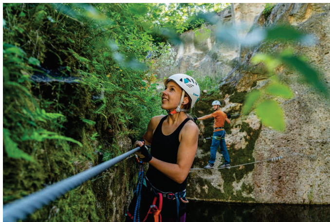
5. ábra: A via ferrata pálya a tengersizem sziklafalain

2020 júliusától üzemel Sárospatak Tengersizem speciális attrakciója, a via ferrata. A „via ferrata” olasz elnevezéséből fordított „vasalt út” olyan hegyi kalandot takar, amely biztonságosan nyújt komoly adrenalinlöketet akár kezdő mászók számára is a függőleges sziklafalakon. A sziklába telepített kapaszkodókon, lépéseken, kábeleken, olykor a szikla peremeken való haladáshoz ugyanis nem szükséges előképzettség, csak megfelelő állóképesség és némi fizikai erő.