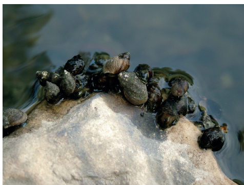
2–3. ábra. Holandriana holandrii , Vízvár, kősarkantyú, tömegesen lepi el a köveket

A Dráva Somogy-megyei szakaszának jellegzetes faja a Holandriana holandrii (2–3. ábra). Jelen ismereteink szerint a faj Őrtilostól Drávatamási településig (Drávagárdony felé) fordul elő (1. ábra a). Az élőhelyek jellemzése községhatáronként: