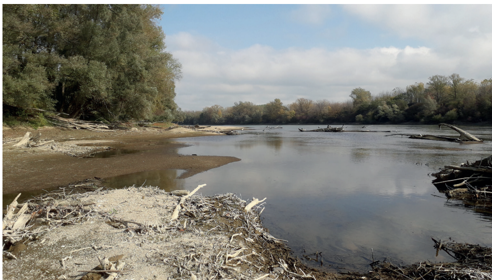
9. ábra. Barcs közeli Drávaszakasz partszegélyi mélyedései, ahol átvészelik a kiszáradást