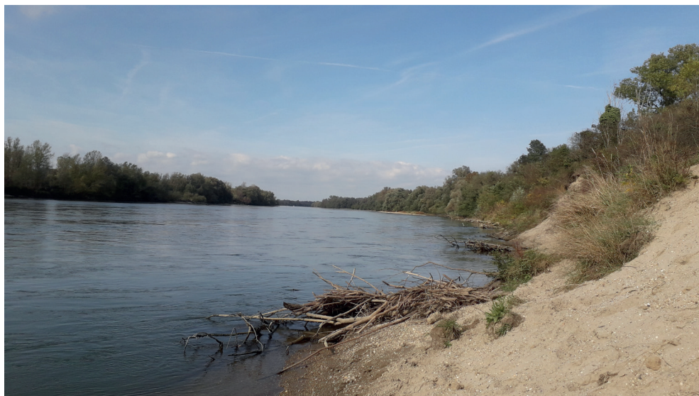
7. ábra. A Holandriana holandrii új előfordulása: Bolhó (Rugy-szigeti dűlő) Dráva (20 számú mintavételi pont). Az élőhely 1-3 méterre található az elakadt uszadékfás zónában, magas vízállásnál elérhetetlen