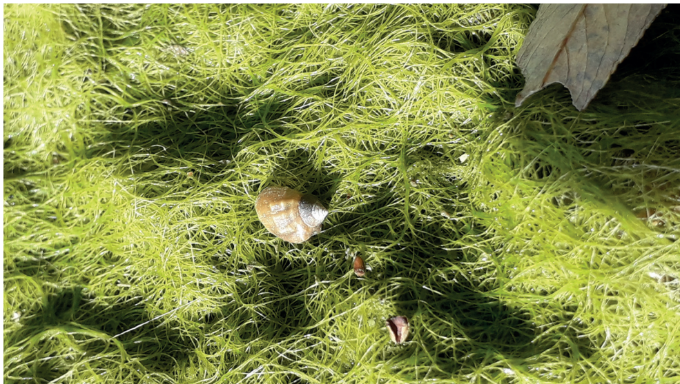
11. ábra. A nedves moszat felületén egy fiatal élő Holandriana holandrii