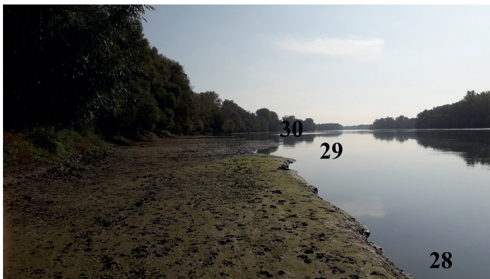
12. ábra. Drávatomási Dráva (Drávagárdony irányában), a Holandriana a jelenlegi vízszegélytől 2-3 méter távolságban él az iszapos-homokos felületen kis egyedszámban (5-6/négyzetméter)