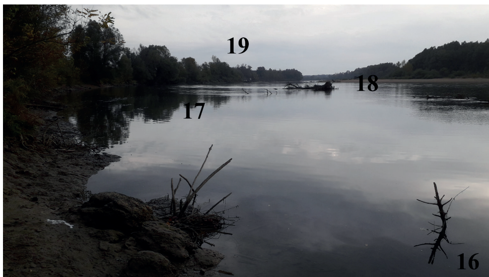
6. ábra. Heresznye – Bolhó (kavicskotró) közötti Drávaszakasz. Magas vízállásnál a Holandriana élőhelye mintázásra elérhetetlen