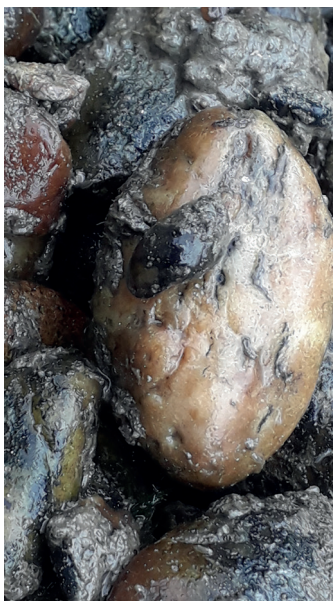
4. ábra. A Holandriana holandrii fajt a szennyezett kavicsokon terepi viszonyok között nehéz észrevenni (Őrtilos 2 számú előfordulási hely), ezért eredményesebb a kotrási-minták otthoni válogatása