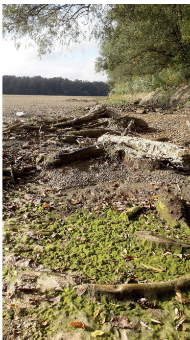
10. ábra. Barcs közeli Drávaszakasz partszegélyi mélyedéseiben kialakult moszattömeg menedékhelyet biztosít a kiszáradt mederszakaszban a Holandriana holandrii és számos csiga illetve kagyló fajnak