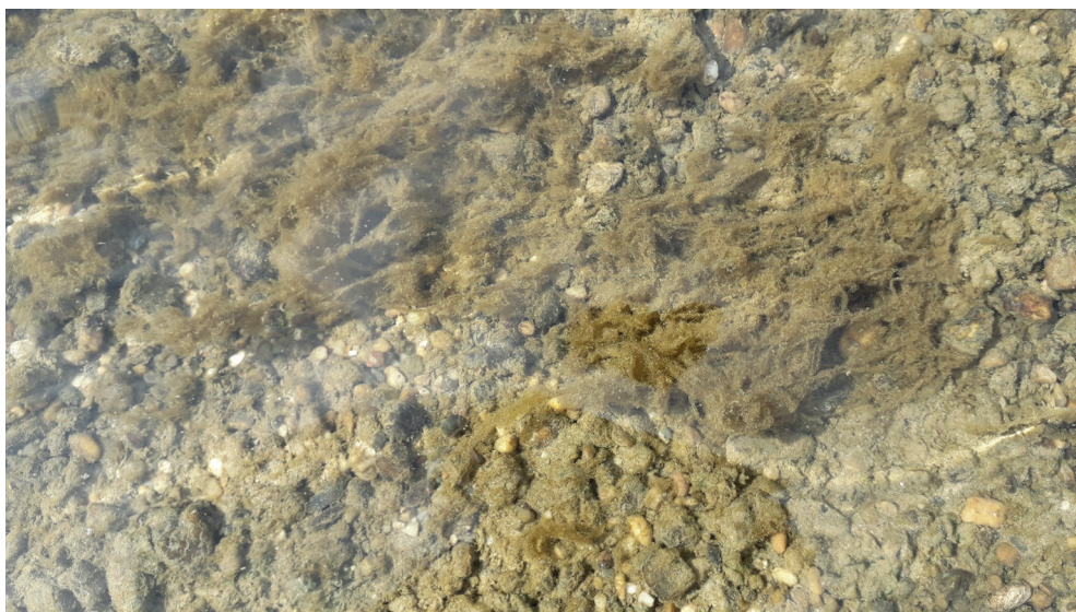
8. ábra. Moszatos mederfenék, Barcs (Mosói-tábla – Drávaerdő)