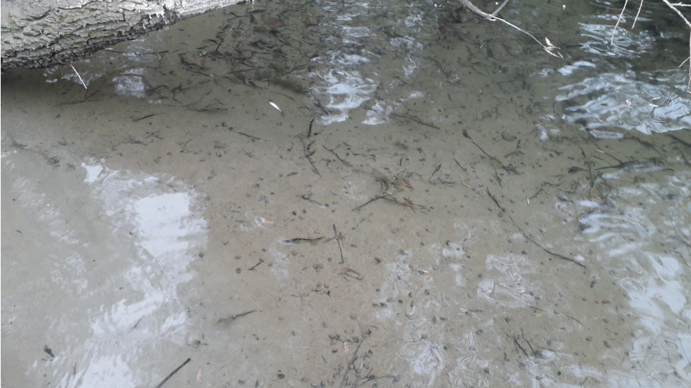
5. ábra. A Holandriana (fényképen feketés pontok) tömeges előfordulása a folyó sekélyvizű zónájában, Vízárt térsége, a heresznyei magaspárt előtti szakasz (fotó: Varga A.)

Vízvár községhatárához két Dráva-szakasz tartozik (0,2 és 5 fkm), ezek együttes hossza kb. 5,2 fkm (1. ábra c). Vízártól Heresznye felé, a sekélyebb vizű kisebb sodrású, zátonyokkal, szigetekkel jellemezhető szakaszain (1. ábra c, 6–15. pont) tömegesen fordul elő, négyzetméterenként akár több száz példány is lehet (5. ábra).