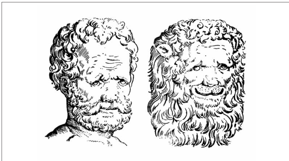
Fig. 2. G. B. Della Porta, Della fisionomia dell'huomo . La fronte umana simile a quella del Leone.

«per ciò che l'abito dell'anima potersi mutar con diligenza dice [Galeno] esser cosa chiara: con cibi, con bere e con esercizi mutar il temperamento in meglio, et in bono temperamento giovare alle virtudi». 1 Il poema di D'Alessandro finisce così nella piena fiducia dell'utilità della fisionomica, con cui è possibile «trasmutare in buon quel che fu rio»: e la tesi è ancor più valida se viene sostenuta dallo «star con Dio». Il nostro autore segue quindi fedelmente l'approccio tematico-speculativo del famoso predecessore cinquecentesco nella convinzione che la fisionomica fosse stata sempre trattata «più per divertimento che per altro». 2 Il poemetto stesso sembra essere stato concepito più per divertimento che per altro in un clima culturale che, pur rispettando e tramandando i valori antichi, era aperto alle nuove dimensioni intellettuali.