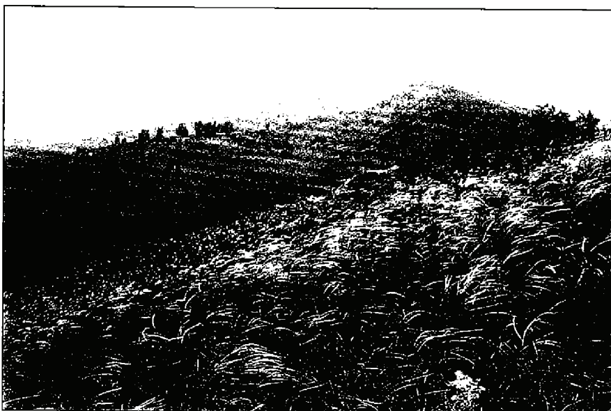
4. kép Stipa joannis állomány sziklafüves lejtőgyepben, Cseket-hegy (Sáska)