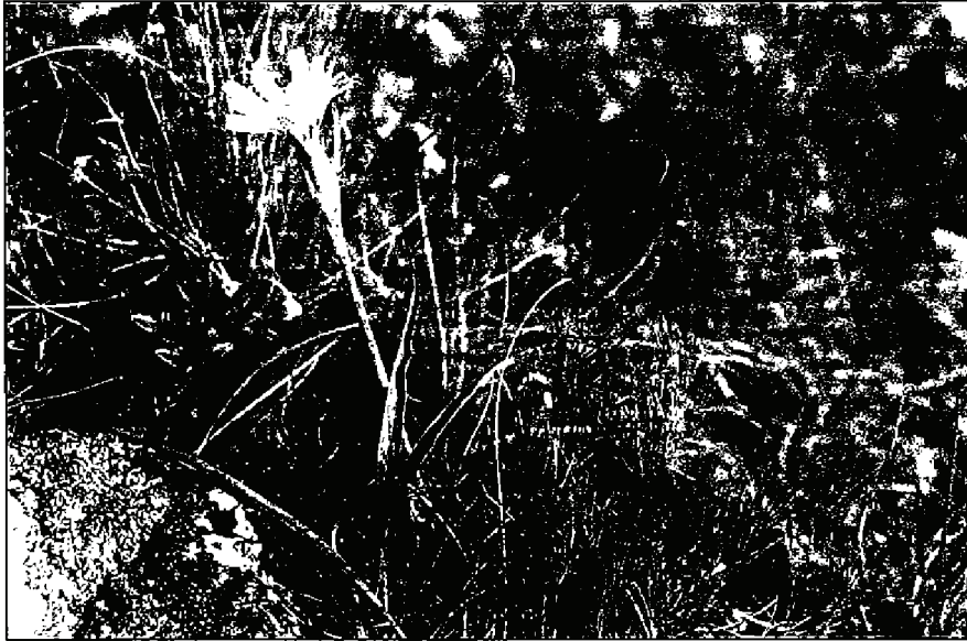
1. kép Seseli leucospermium és Scorzonera austriaca nyílt dolomitsziklagyepben, Tekeres-völgy (Nemesvámos)