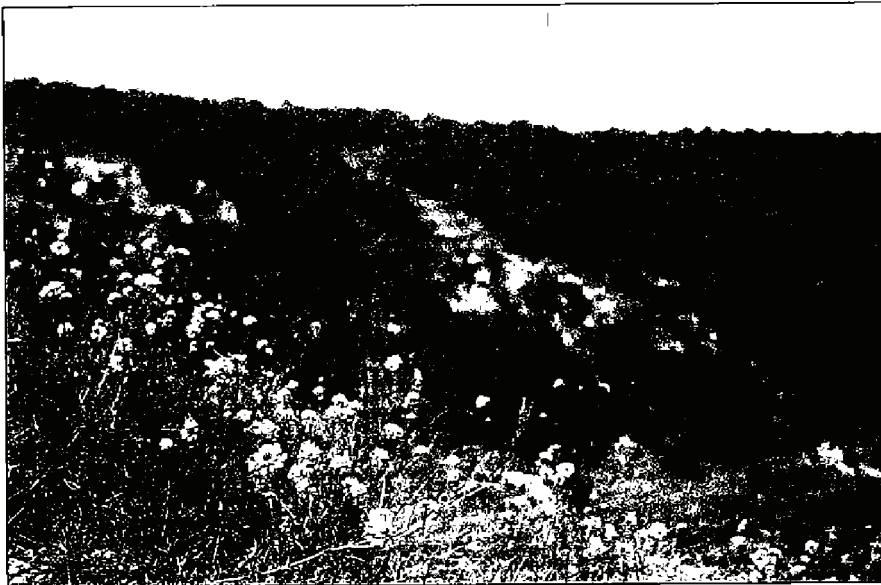
2. kép Scabiosa canescens zárt dolomitsziklagyepben, Tekeres-völgy (Nemesvámos)