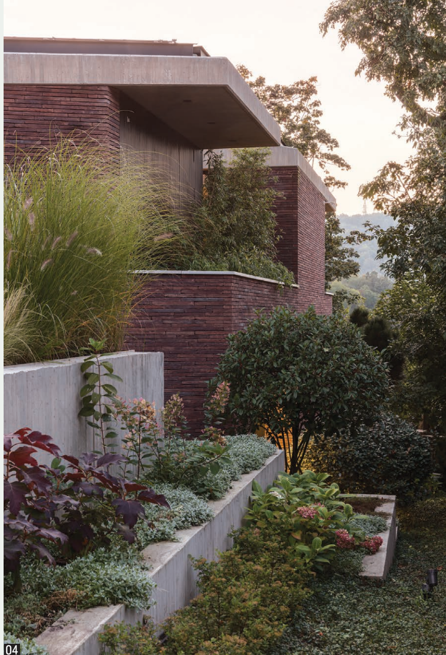
03-04 A tömeg kiharapásai, áttörései állandó átlátásokat, a természettel intenzív kapcsolatokat eredményeznek 05 Az épület tömegalakítása és belső működése is a telek meredekségét használja ki

reflektáló határozott kortárs megoldások, építészeti részletek egyértelműen mentesek a múlt felé fordulástól, az utca meglehetősen heterogén és bizonytalan értékű építészeti jellegétől. A relatív keskeny telekszélességre vezethető vissza az épület hosszirányú, lejtő felé történő kitarulkozása, míg a tulajdonképpen kompakt zárt tömeg további megnyitását az excentrikusan elhelyezett, mindkét szinten átfutó átrium biztosítja. A tetőn átvezetett átrium és az épülettömeg utcával párhuzamos negyedik oldalának ferdeségéből adódó dőlt ereszt eredményezi, hogy a majdnem szabályos sátor tető ellenére a zárt tömeg dinamikusan felszakad, és a szabályozás megkövetelte magastető a domborzatra reflektáló játékos tömegformává szelídül, elrejtve