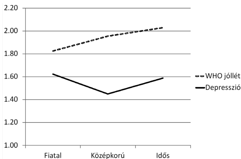
1. ábra. Jóllét és depresszió átlagok életkori csoportonként

Varianciaanalízis alapján a fiatalok, középkorúak és idősek között nincs szignifikáns különbség sem jóllét, sem depresszió tekintetében. A következő grafikonon (ld. 1. ábra) látható azonban, hogy a jóllét tekintetében az életkorral egy enyhe növekvő tendencia mutatkozik, melyet rangkorrelációs vizsgálattal is megvizsgáltunk. Az életkor és a WHO jóllét pontszám között 0,13-as gyenge, de szignifikáns ( p = 0,023 ) rangkorreláció mutatkozott.