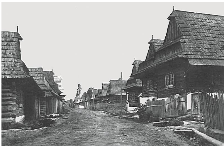
A régi Hrustin képeslapon